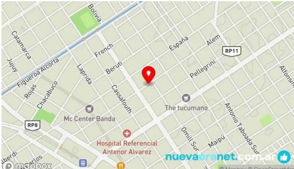
Panificadora san francisco mapa