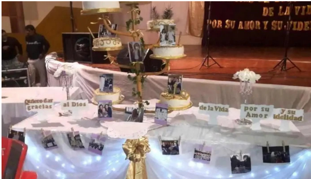
Panificadora san francisco interior