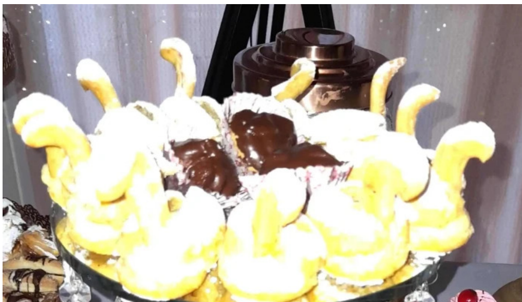
Panificadora san francisco cerca de mi