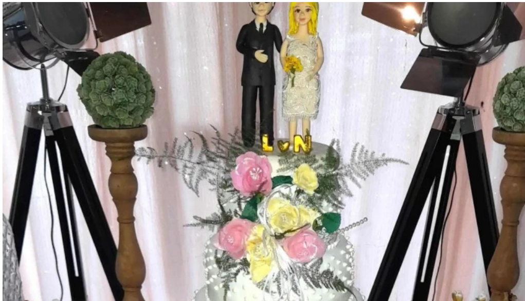
Panificadora san francisco la banda