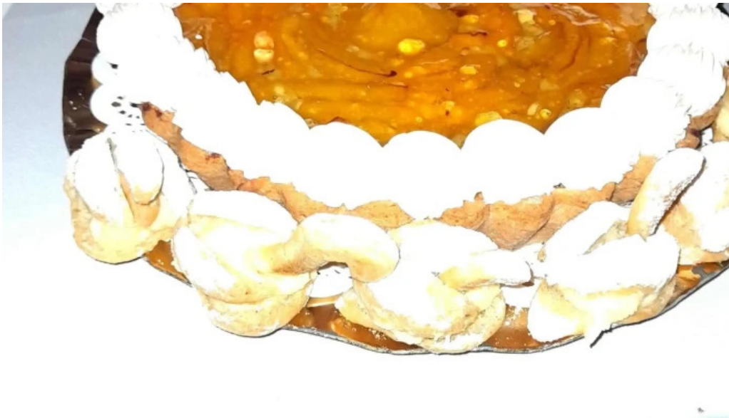
Panificadora san francisco opiniones