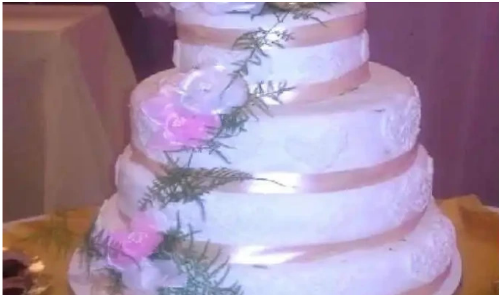
Panificadora san francisco del propietario