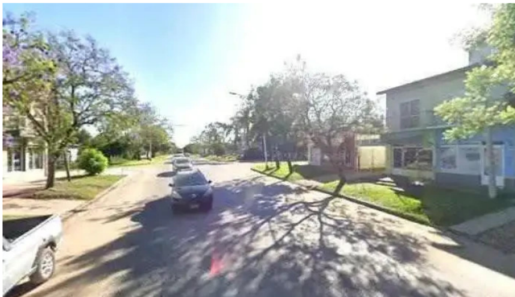
Pisapan colon horariodeg