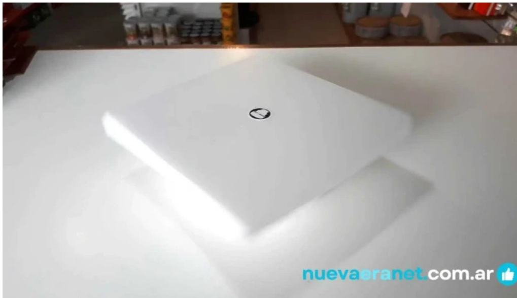
Pisapan colon videos