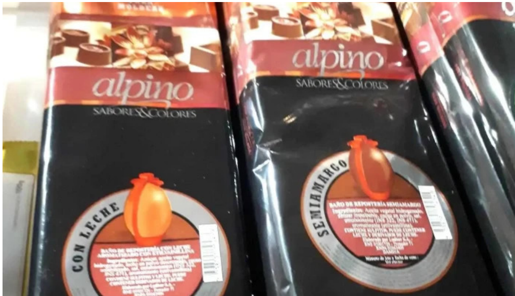
Pisapan colon chocolate