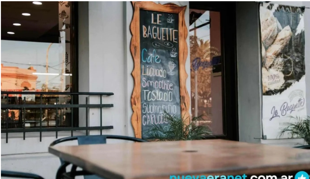
Le baguette carta