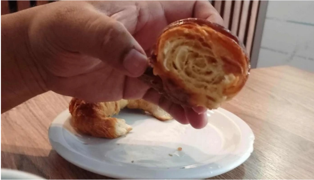
Le baguette donde