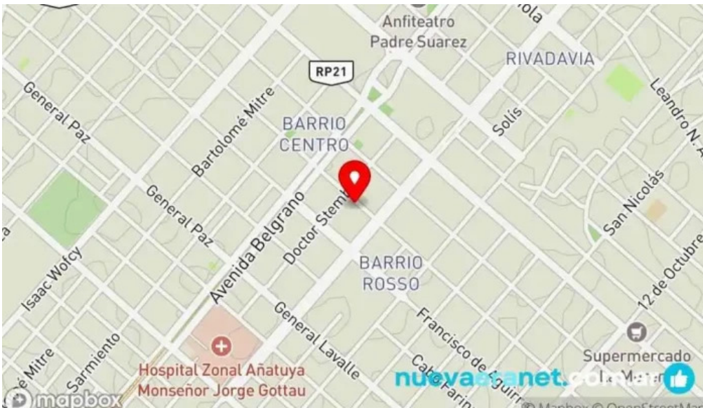
Le baguette mapa