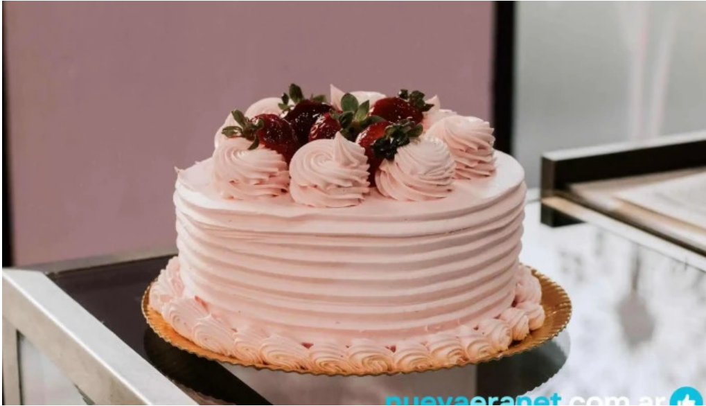
Le baguette comida y bebida