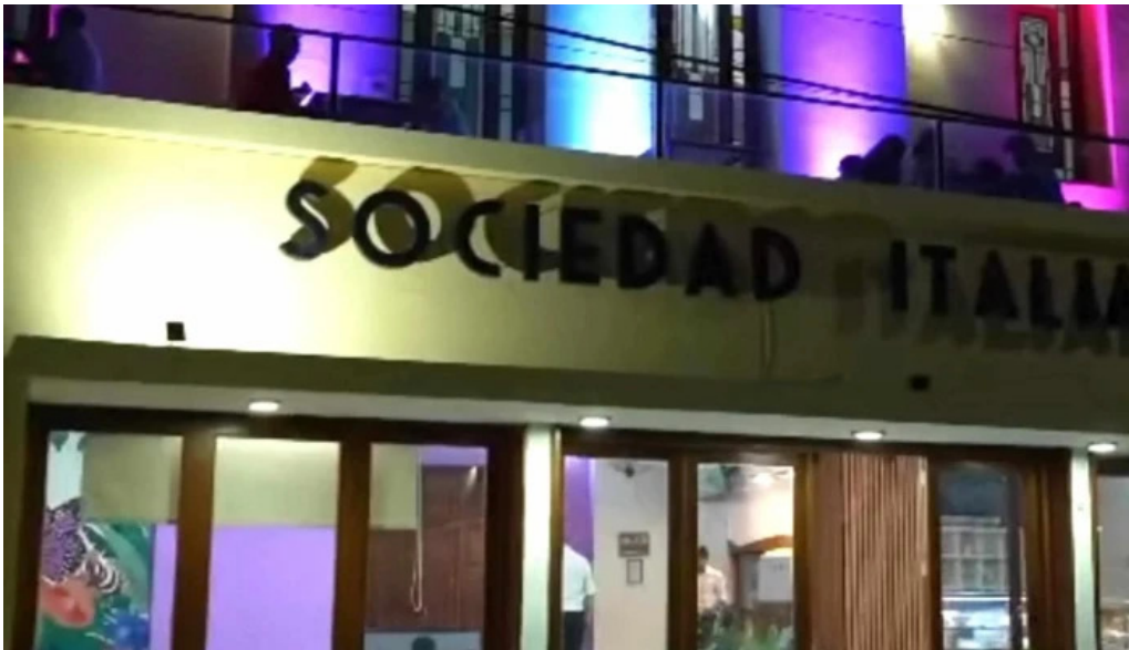
Le baguette precios