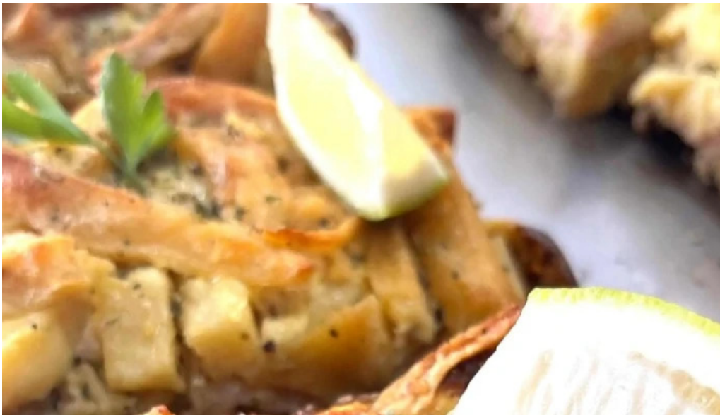
Le baguette fotos