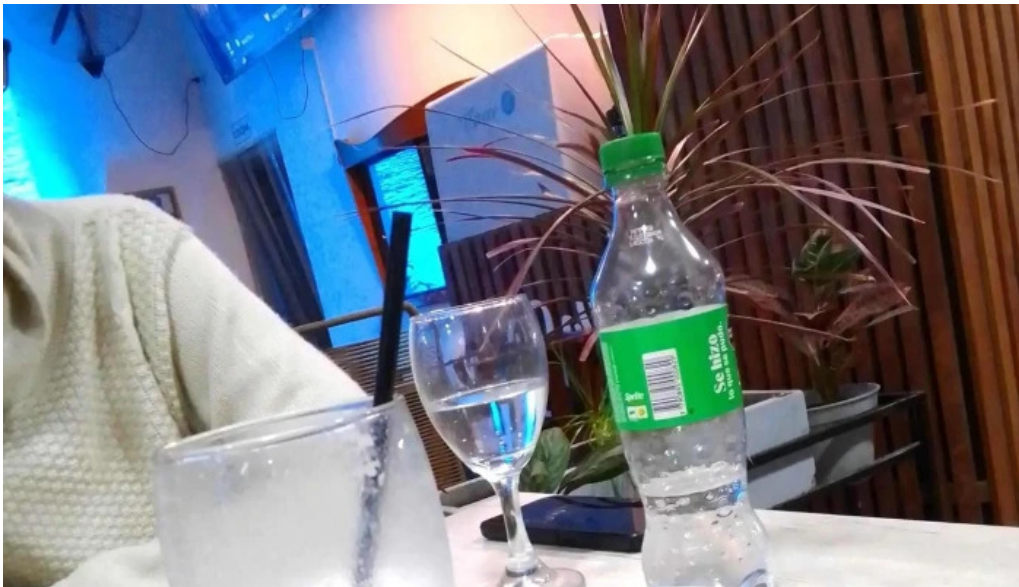
Le baguette catalogo