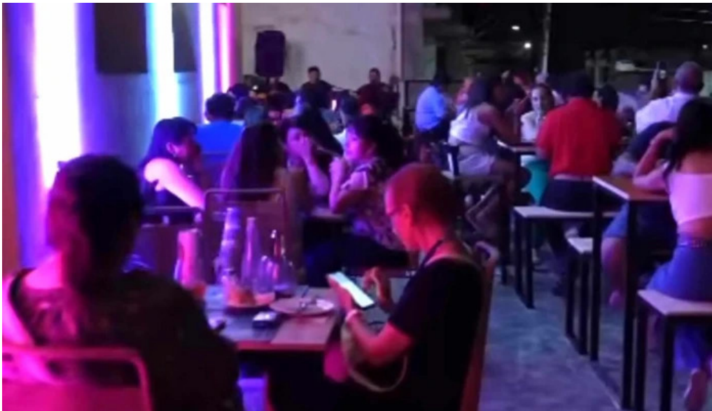
Le baguette anatuya