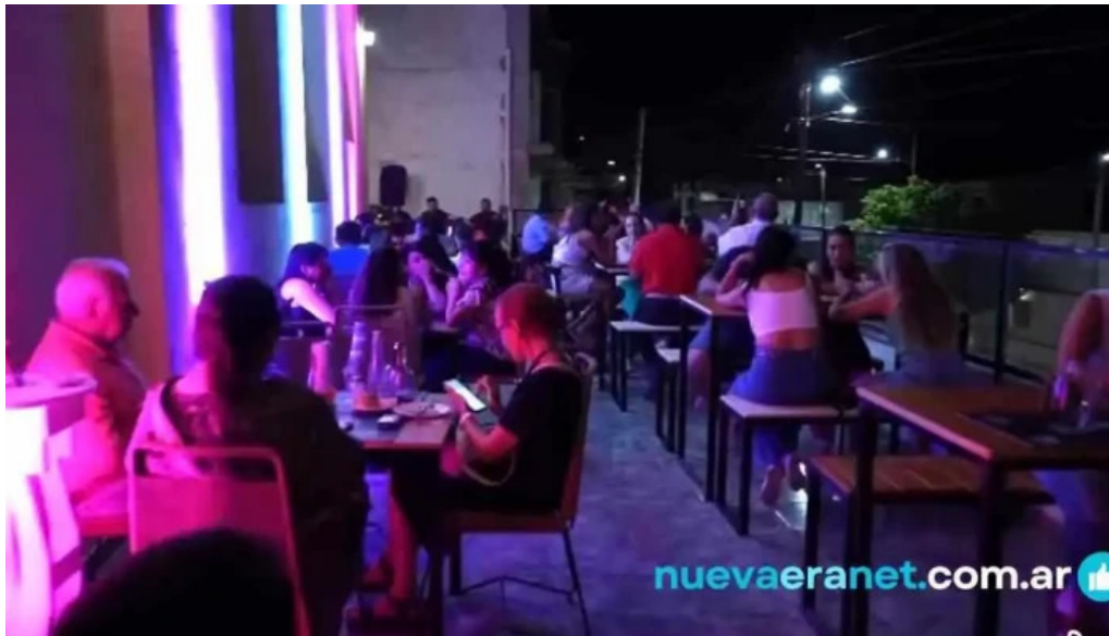
Le baguette ambiente