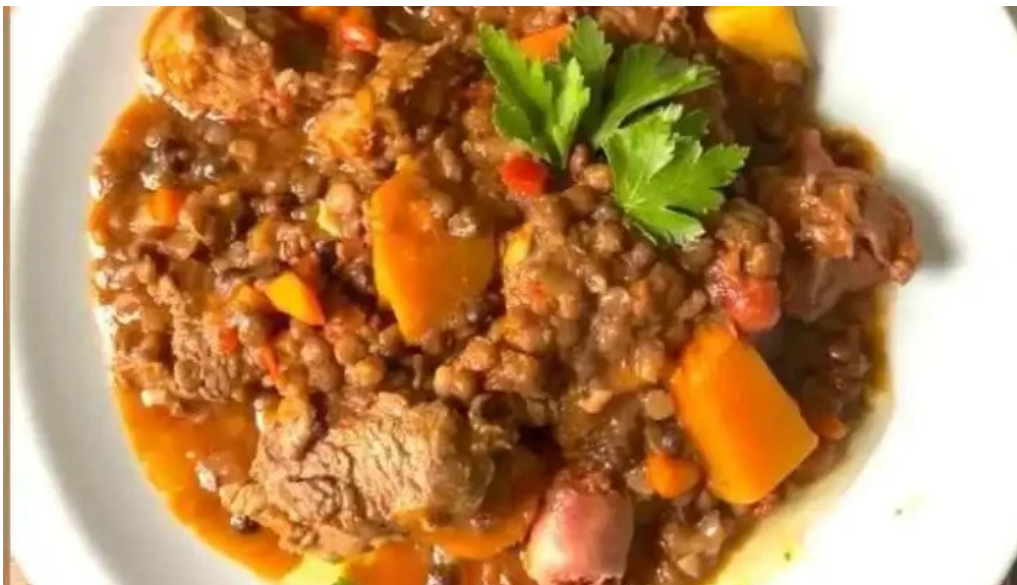
Le baguette videos