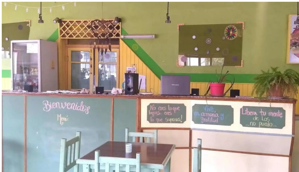
Nicanor rotiseria reposteria sitio web