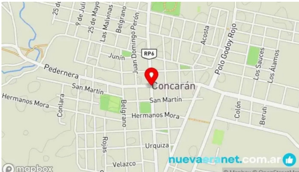
Nicanor rotiseria reposteria mapa