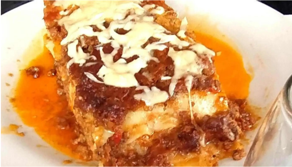
Nicanor rotiseria reposteria concaran