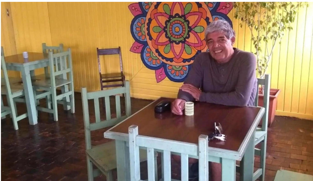
Nicanor rotiseria reposteria ubicacion