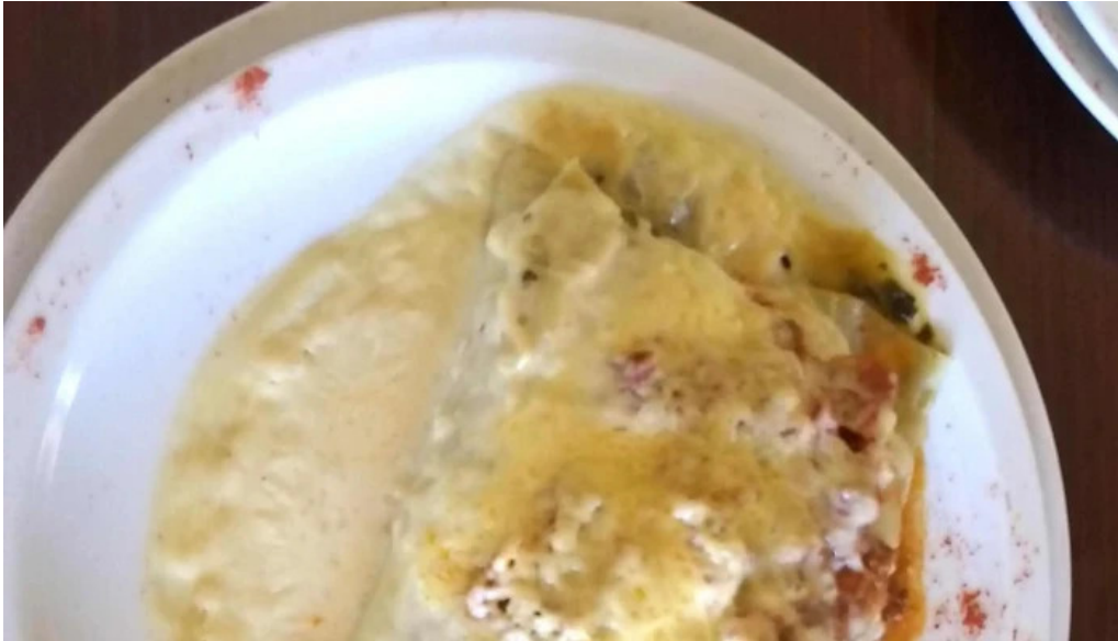
Nicanor rotisería repostería abierto ahora