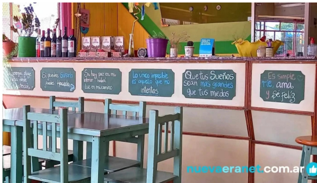
Nicanor rotiseria reposteria ambiente