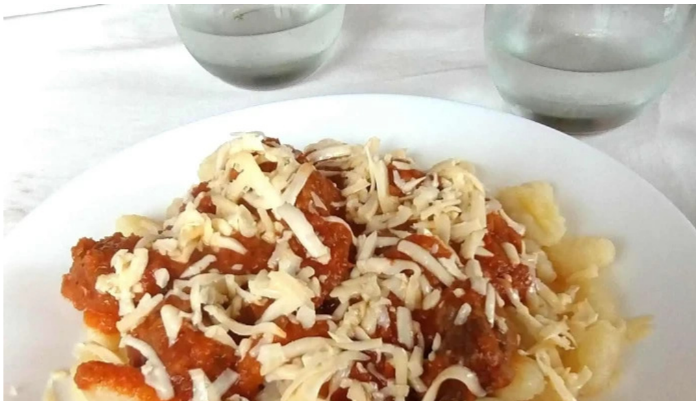
Nicanor rotiseria reposteria numero