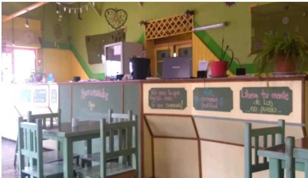
Nicanor rotiseria reposteria descuentos