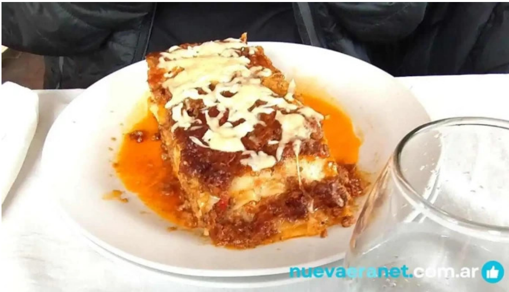
Nicanor rotiseria reposteria comida y bebida