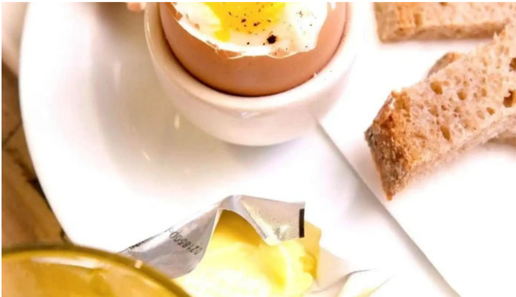
Le pain quotidien huevo duro