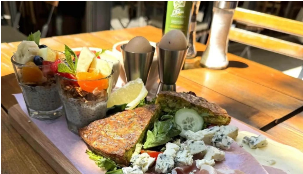
Le pain quotidien cdad autonoma de buenos aires