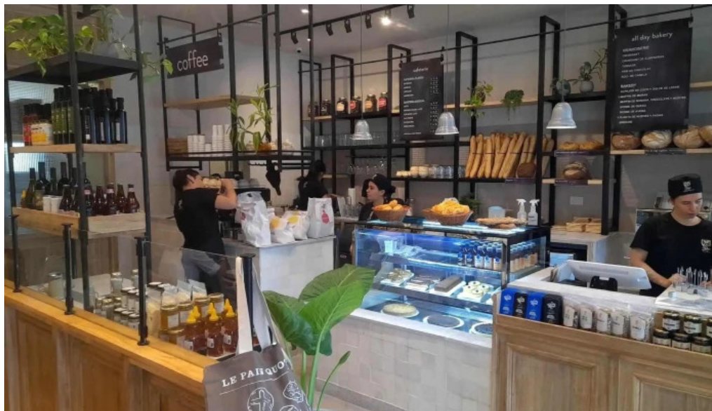
Le pain quotidien ambiente