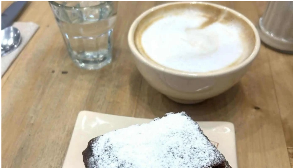
Le pain quotidien sitio web