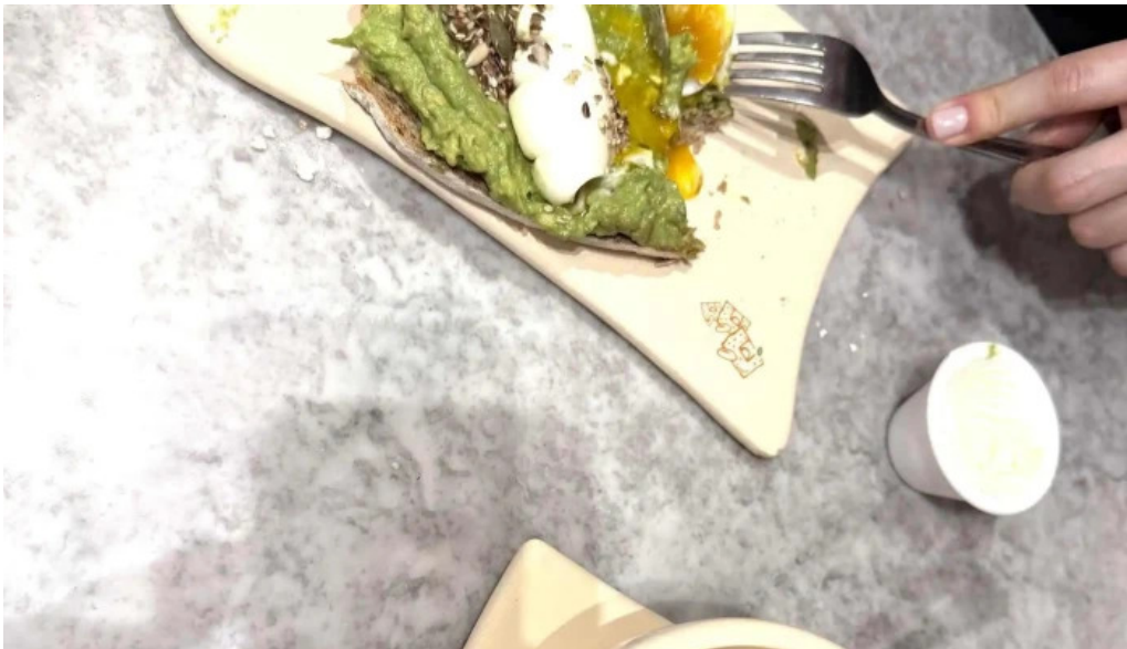
Le pain quotidien comentarios