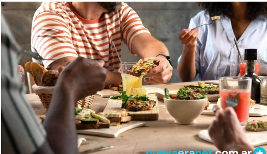
Le pain quotidien mas recientes