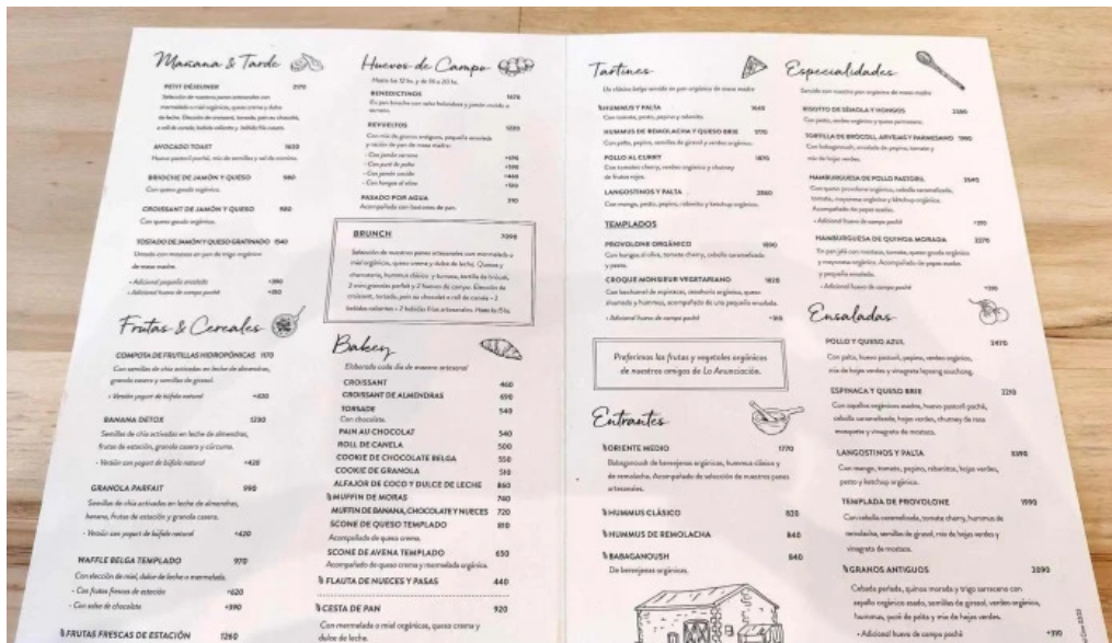
Le pain quotidien carta