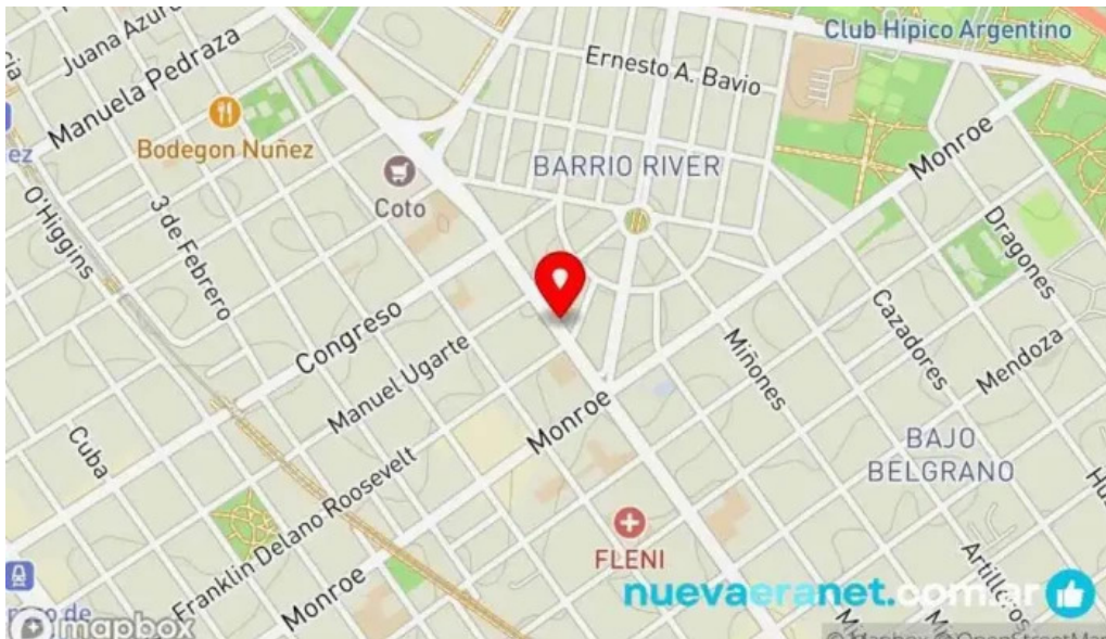
Le pain quotidien mapa