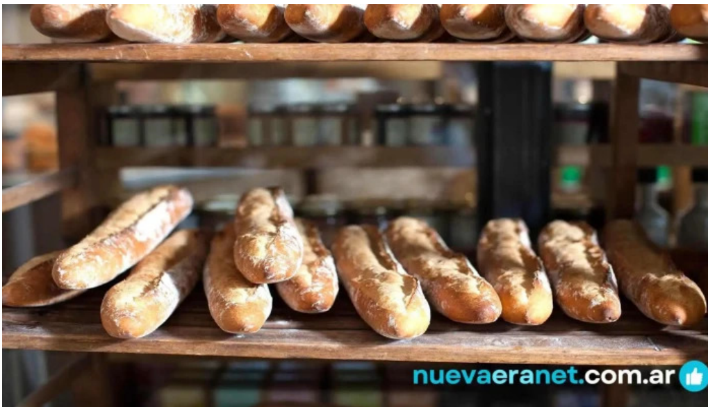
Le pain quotidien del propietario