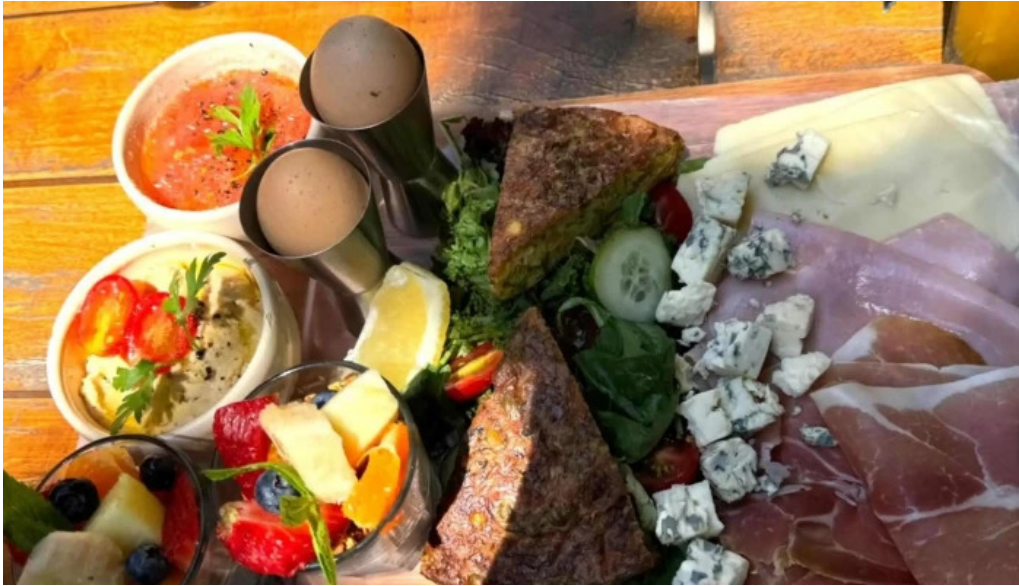
Le pain quotidien cerca de mi