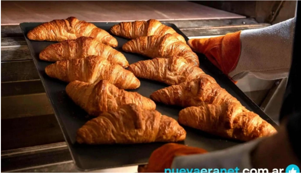
Le pain quotidien comida y bebida