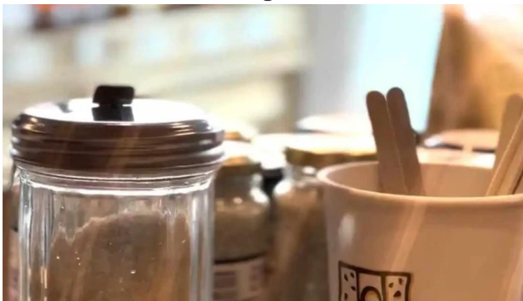
Le pain quotidien videos