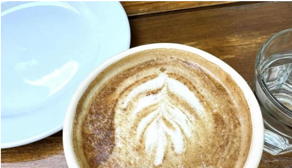
Le pain quotidien instagram