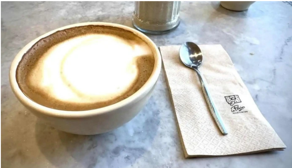
Le pain quotidien cortado