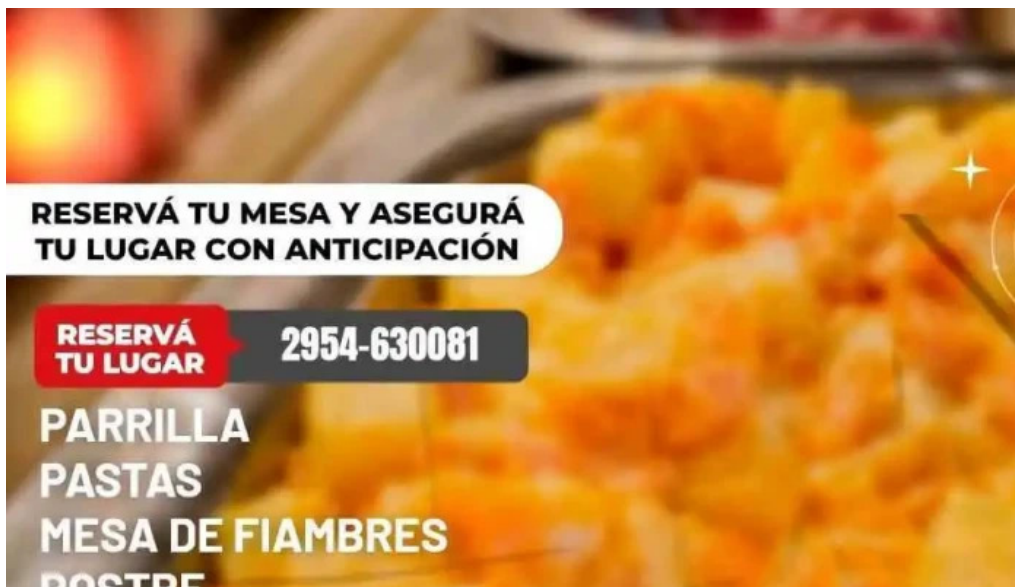
Fina resto pasteleria cafe helados carta