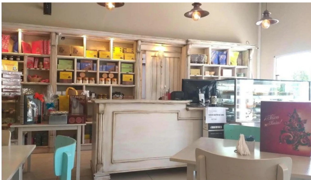
Fina resto pasteleria cafe helados ambiente