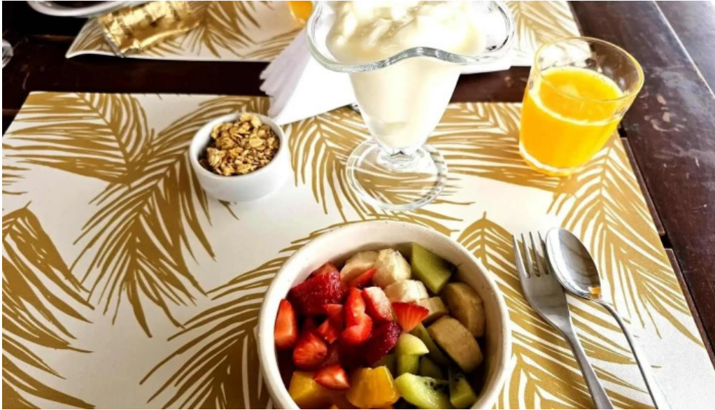
Fina resto pasteleria cafe helados comida y bebida