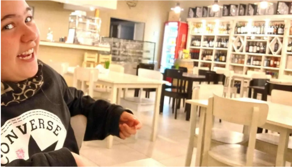
Fina resto pasteleria cafe helados sitio web