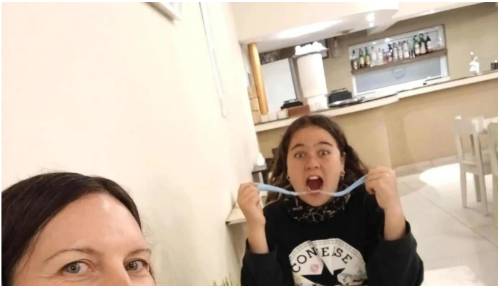
Fina resto pasteleria cafe helados opiniones