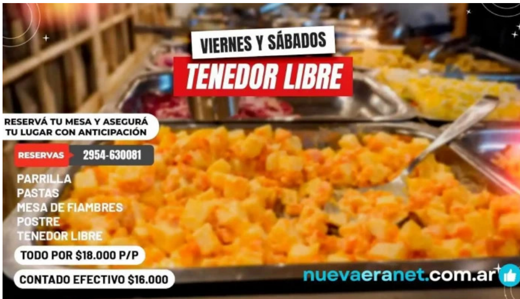
Fina resto pasteleria cafe helados del propietario