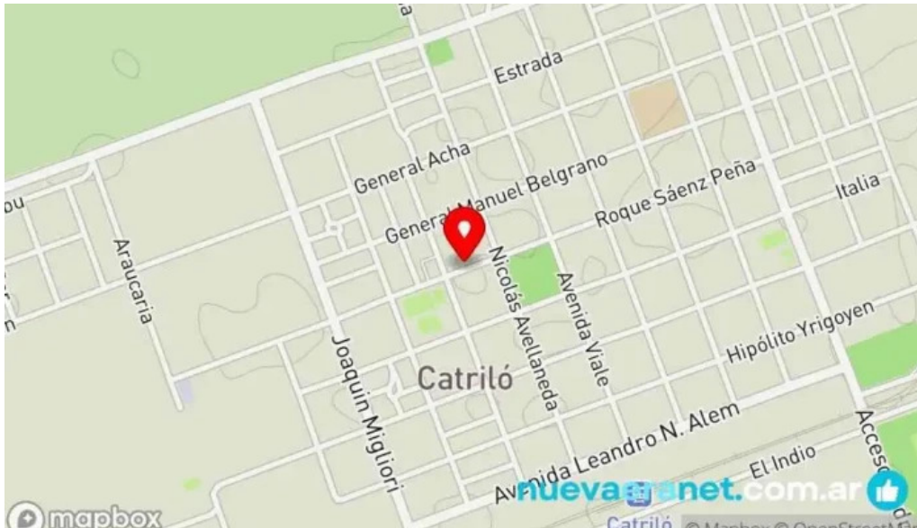
Fina resto pasteleria cafe helados mapa