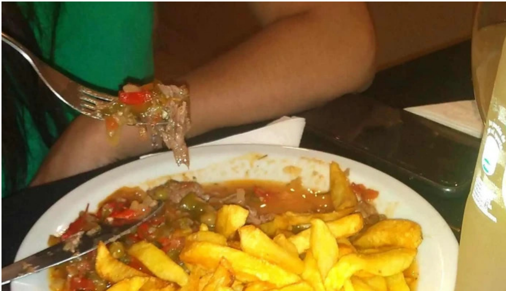
Fina resto pasteleria cafe helados telefono