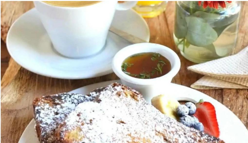
Cocu boulangerie del proprietario