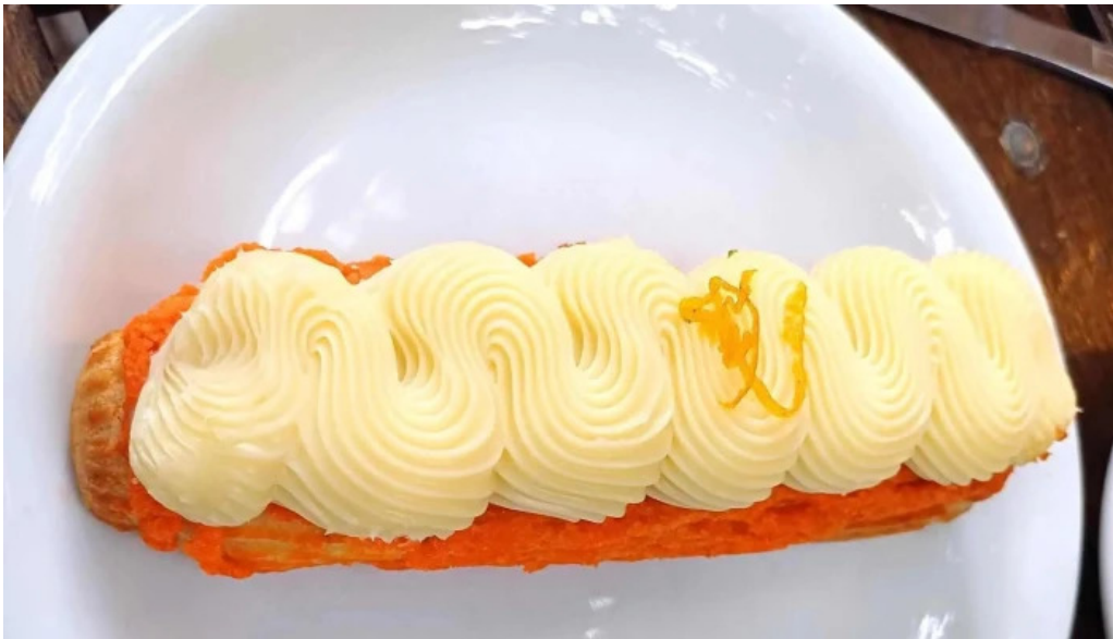
Cocu boulangerie videos