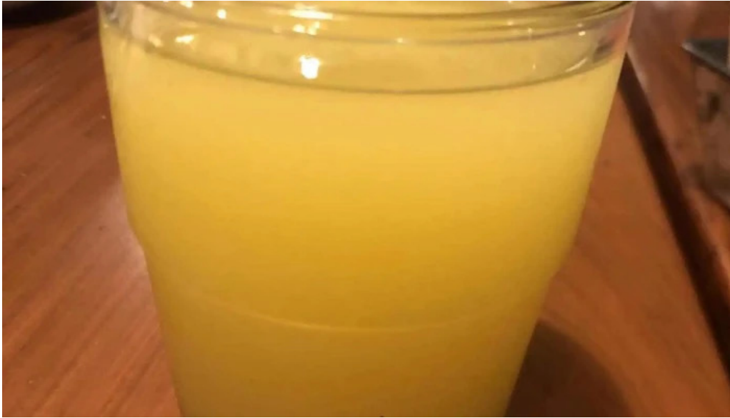
Cocu boulangerie jugo