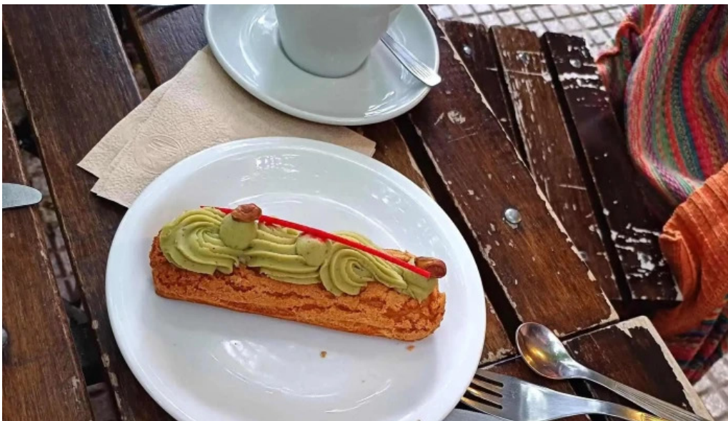
Cocu boulangerie comentarios