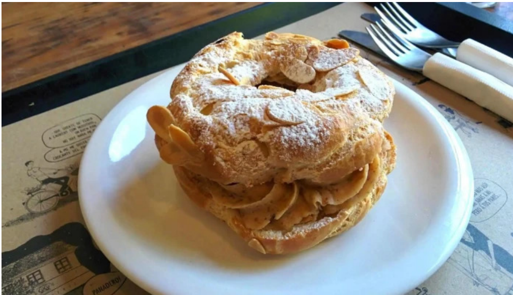
Cocu boulangerie paris brest