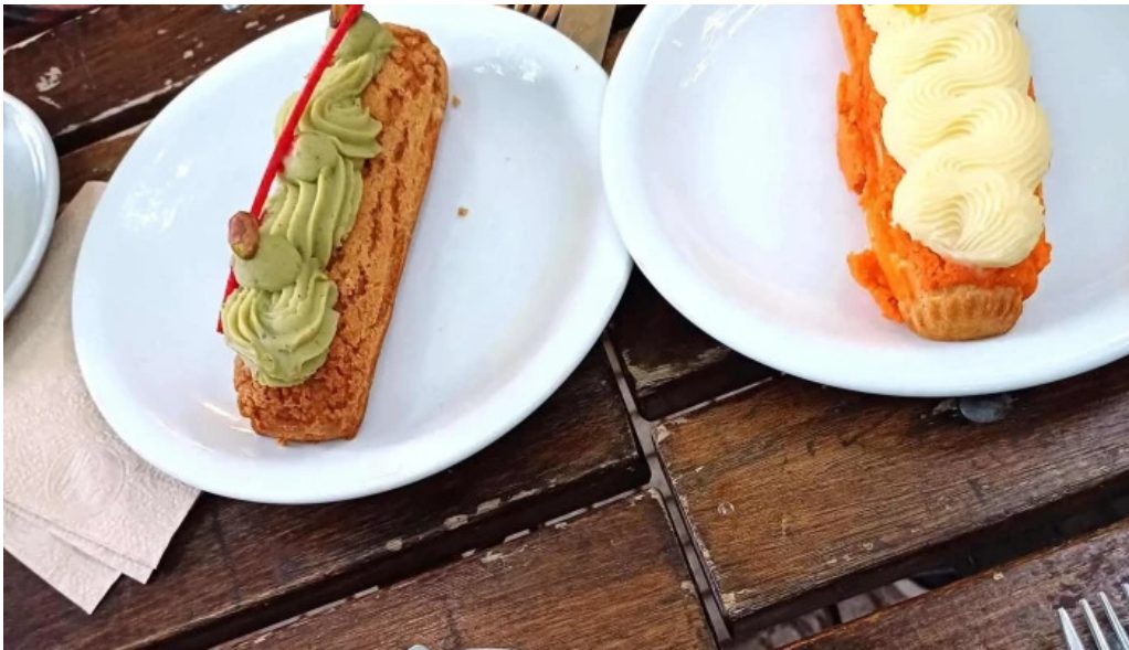
Cocu boulangerie direccion