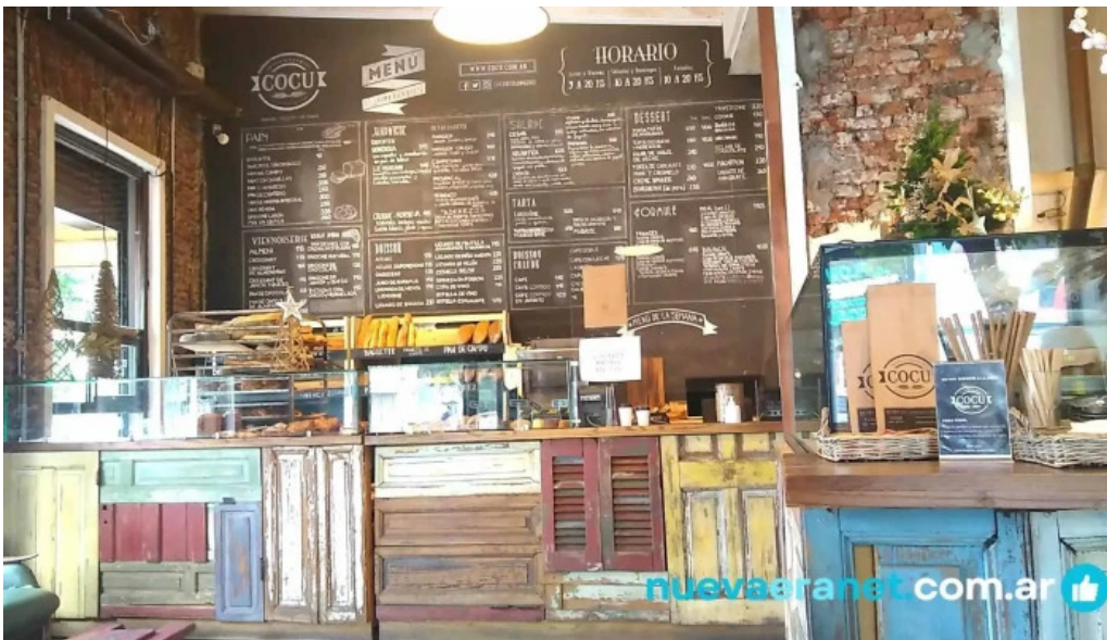
Cocu boulangerie carta