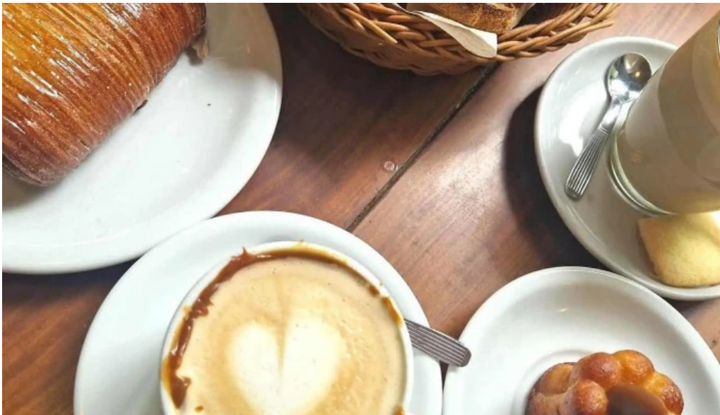
Cocu boulangerie mas recientes