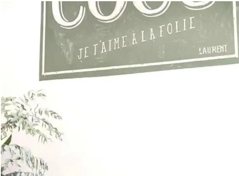
Cocu boulangerie ambiente