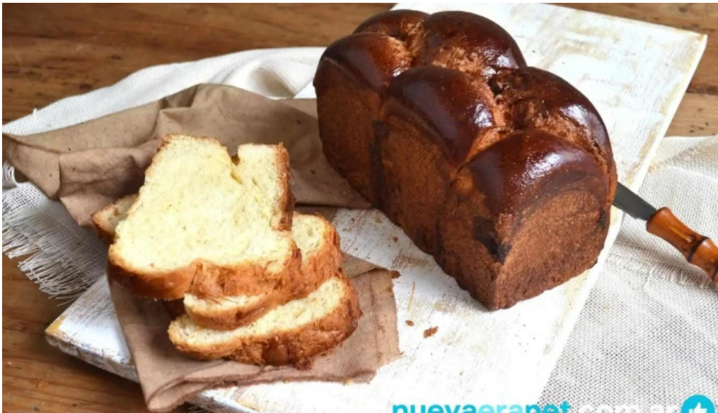
Cocu boulangerie comida y bebida