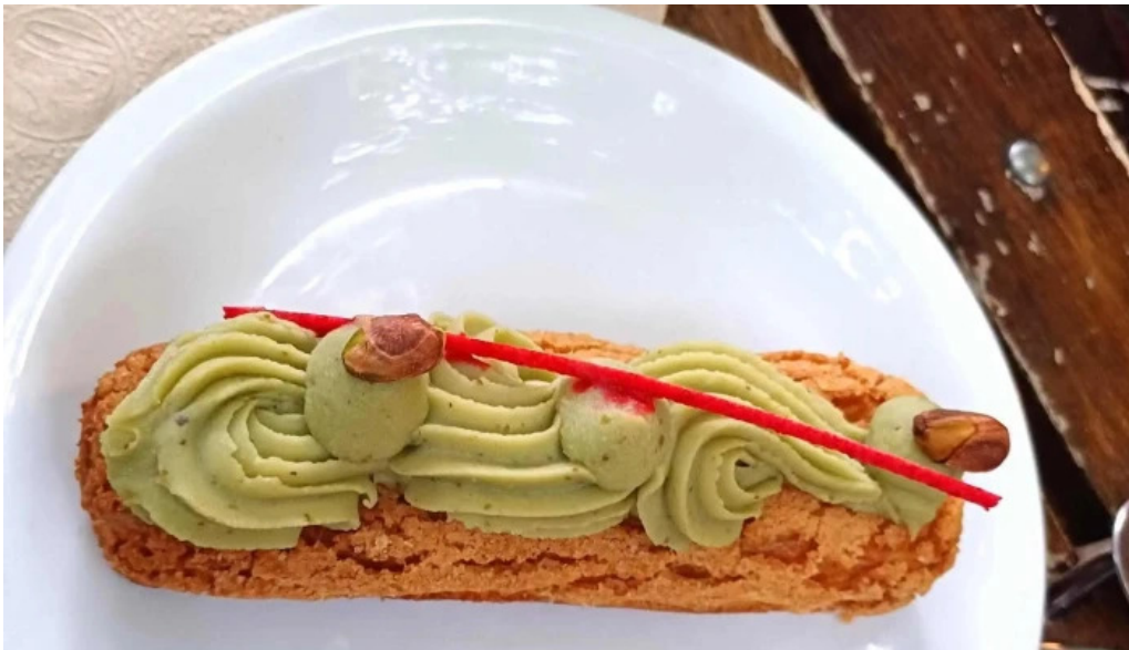
Cocu boulangerie cdad autonoma de buenos aires