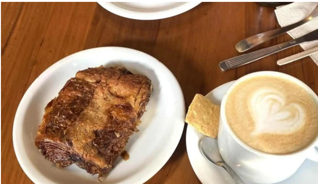
Cocu boulangerie croissant