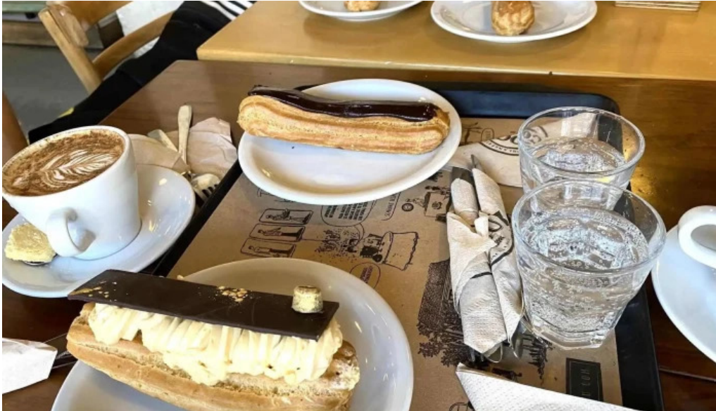
Cocu boulangerie capuchino