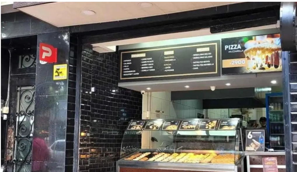
Sabores express carta