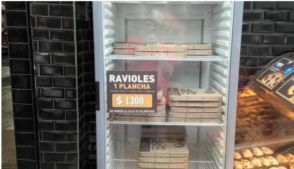
Sabores express ambiente