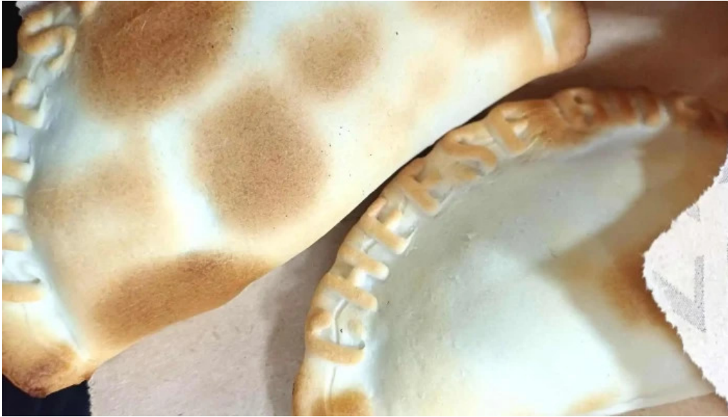
Sabores express comida y bebida