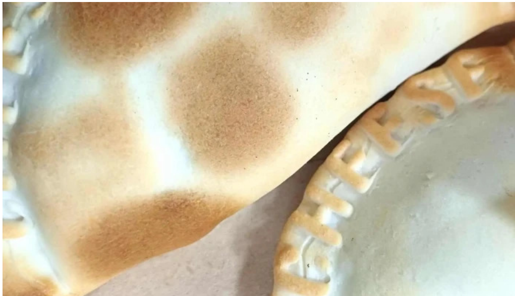
Sabores express donde