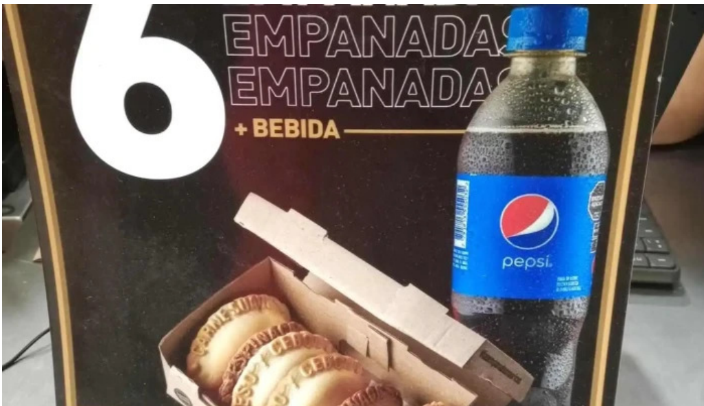
Sabores express comida reconfortante