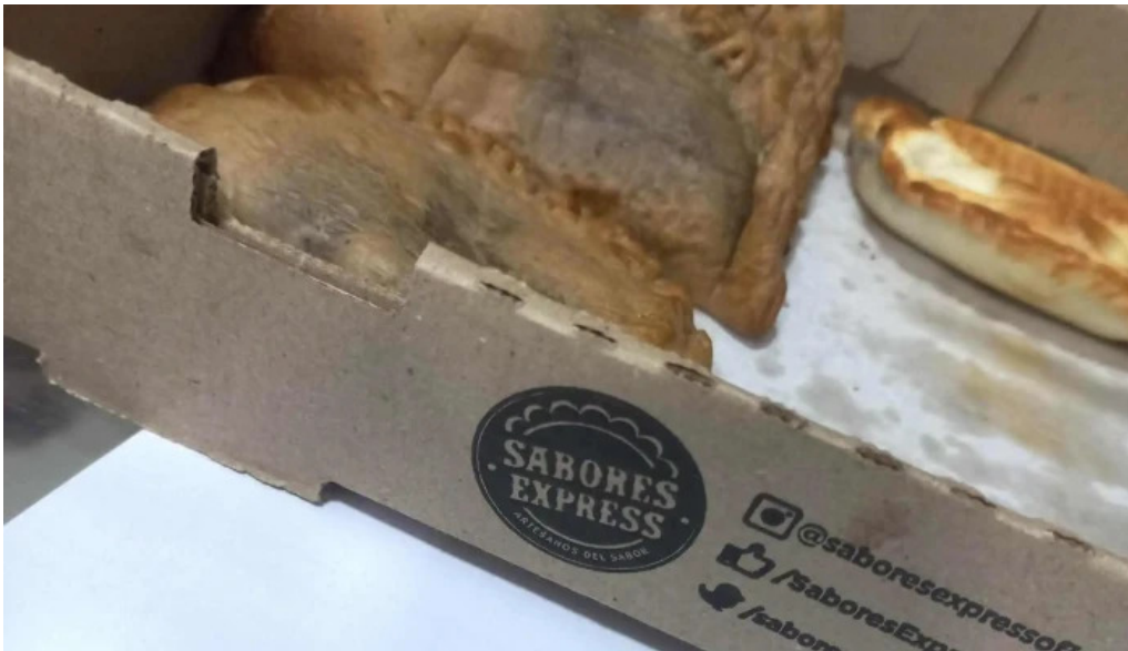
Sabores express cdad autonoma de buenos aires