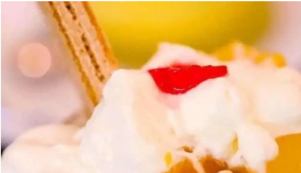
La nueva mega pena la panaderia del chuna del propietario