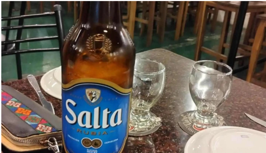
La nueva mega pena la panaderia del chuna cerveza