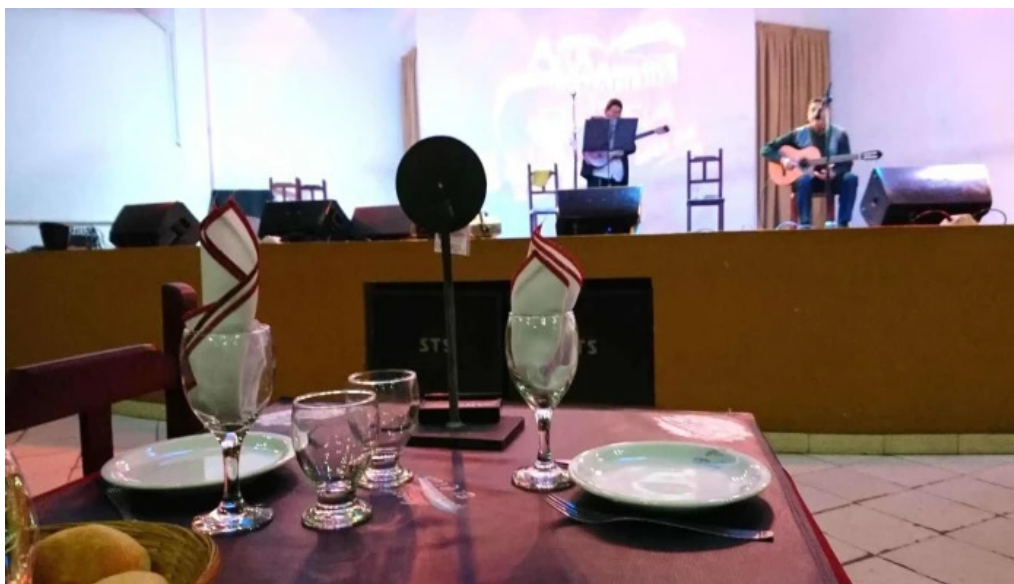
La nueva mega pena la panaderia del chuna ambiente