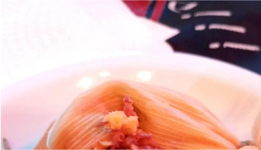
La nueva mega pena la panaderia del chuna instagram