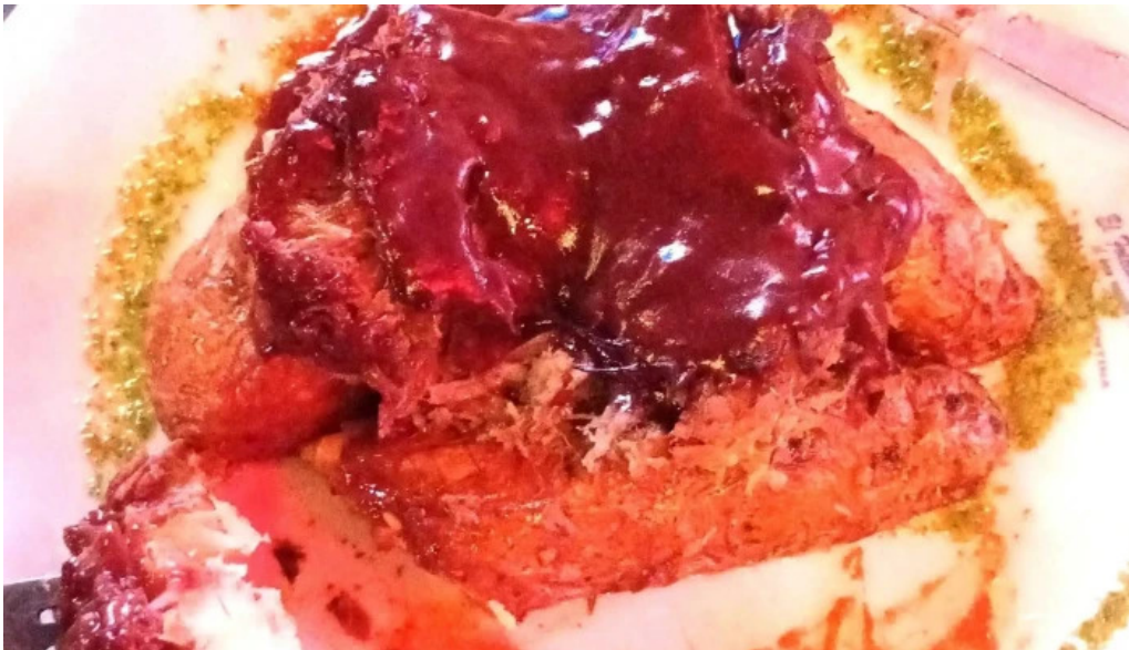
La nueva mega pena la panaderia del chuna numero