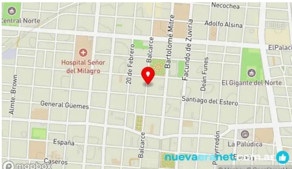
La nueva mega pena la panaderia del chuna mapa