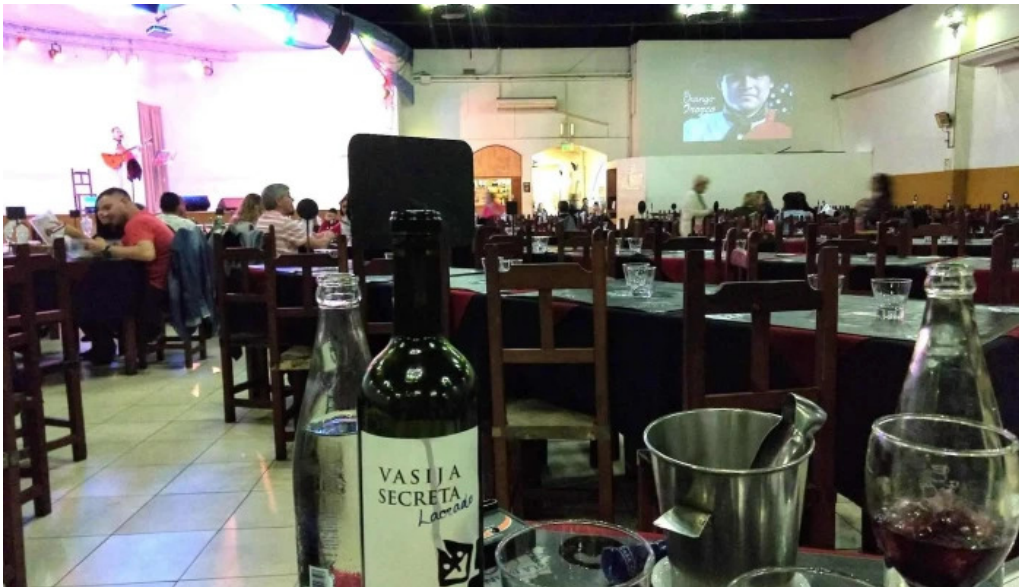
La nueva mega pena la panaderia del chuna comida y bebida