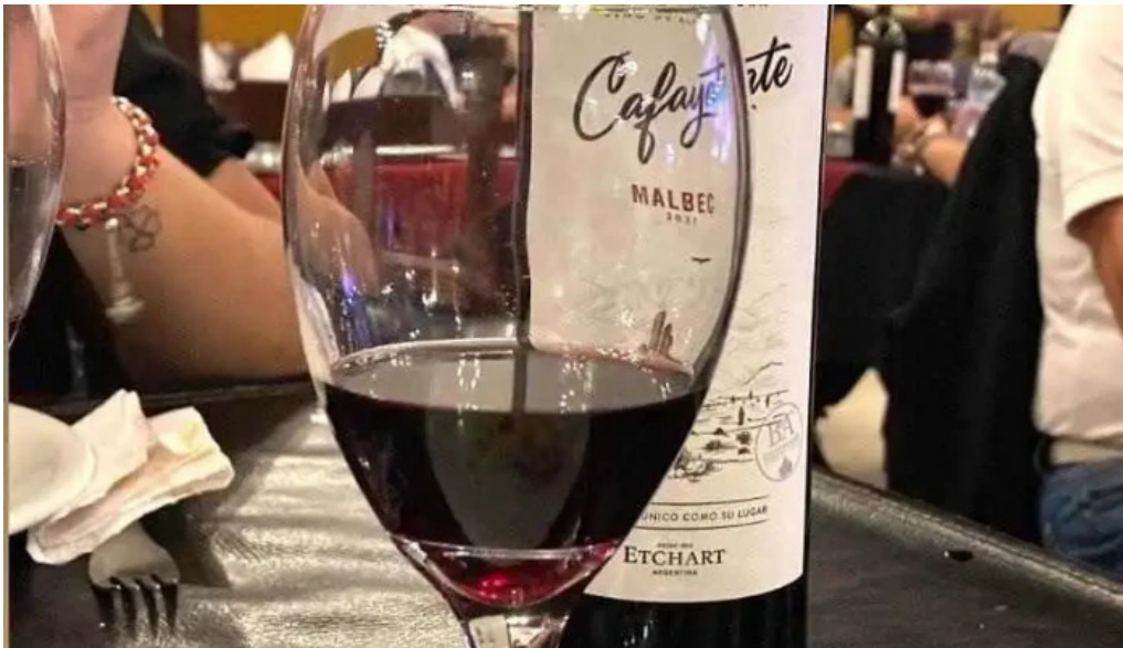
La nueva mega pena la panaderia del chuna vino