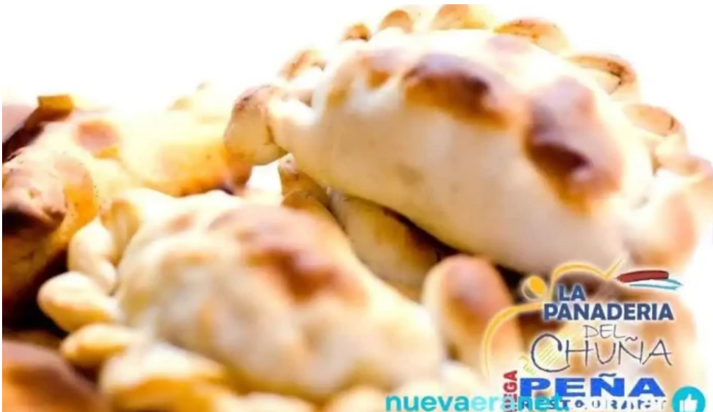
La nueva mega pena la panaderia del chuna empanada