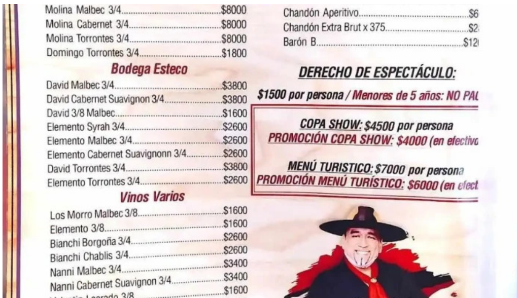
La nueva mega pena la panaderia del chuna carta