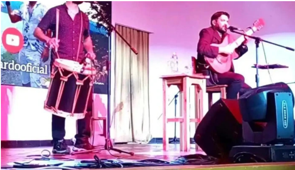
La nueva mega pena la panaderia del chuna mas recientes