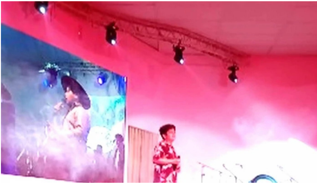
La nueva mega pena la panaderia del chuna salta