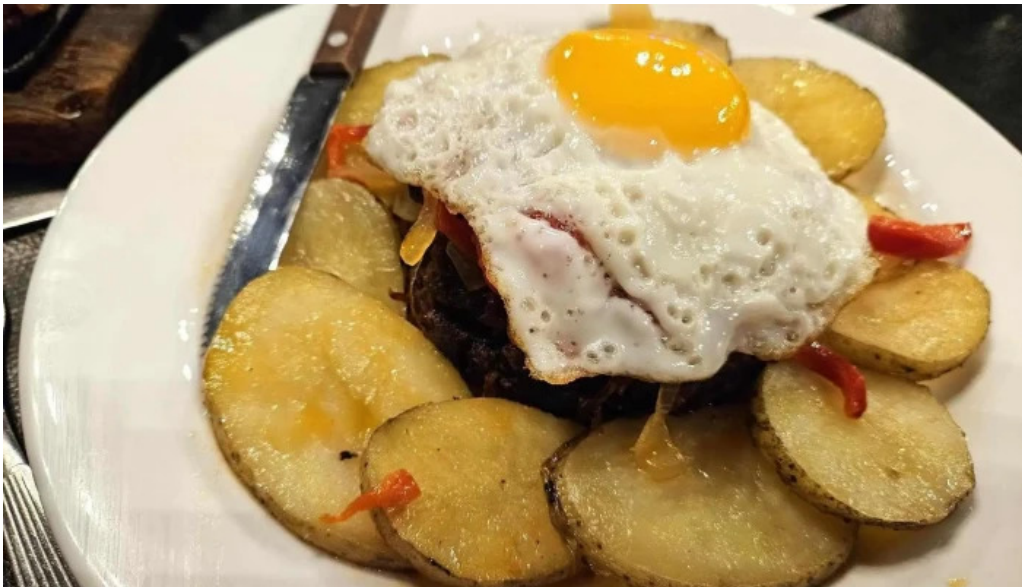
La nueva mega pena la panaderia del chuna huevos estrellados