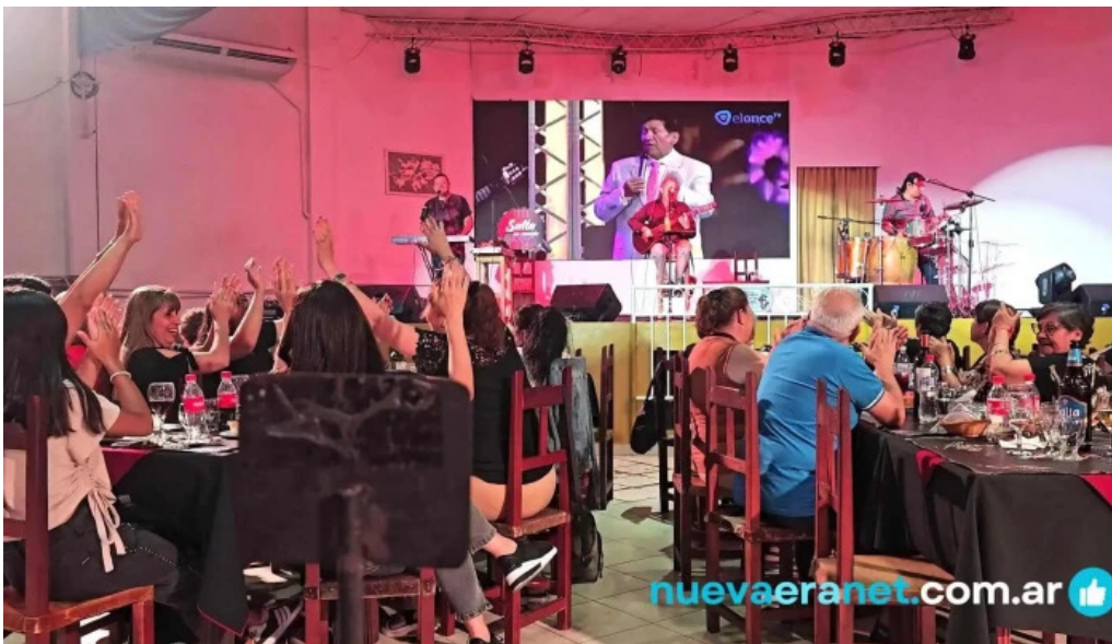
La nueva mega pena la panaderia del chuna videos