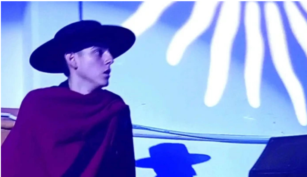
La nueva mega pena la panaderia del chuna comentarios