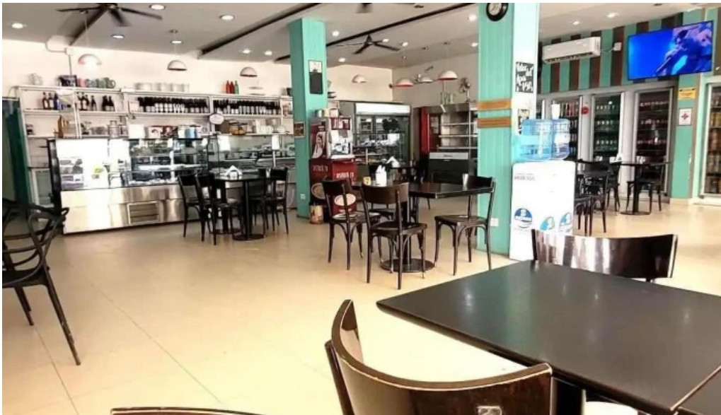
Panaderia restaurante san cayetano ambiente