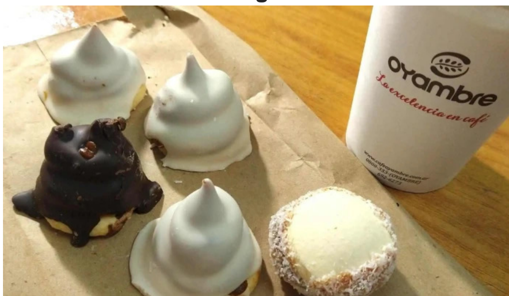
Panadería restaurante san cayetano zona