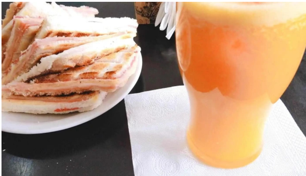
Panaderia restaurante san cayetano comentarios