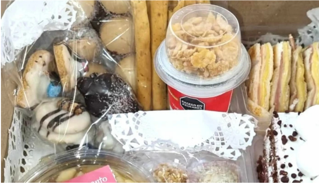
Panaderia restaurante san cayetano anelo