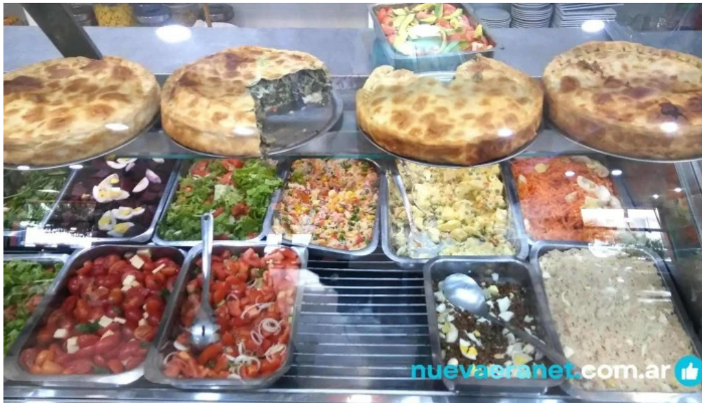
Panaderia restaurante san cayetano comida y bebida