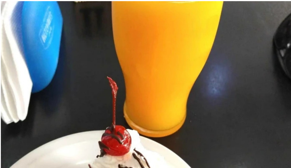
Panaderia restaurante san cayetano ubicacion