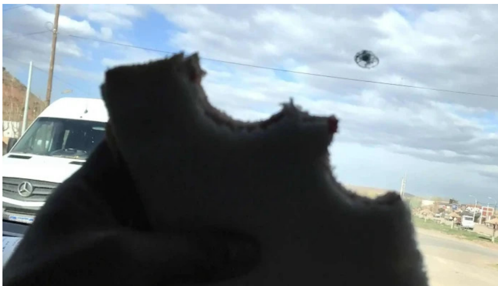
Panaderia restaurante san cayetano abierto ahora