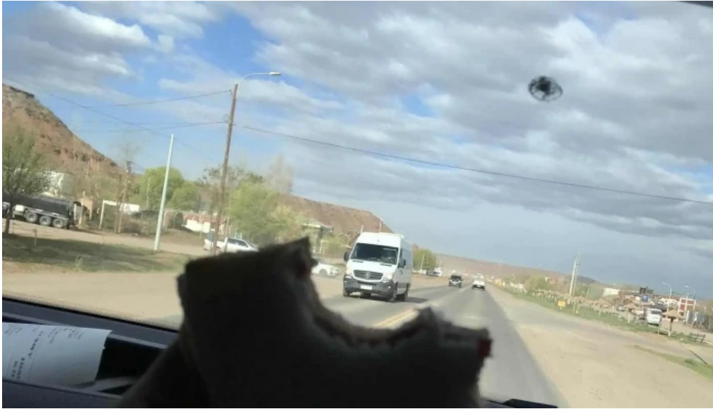
Panaderia restaurante san cayetano videos