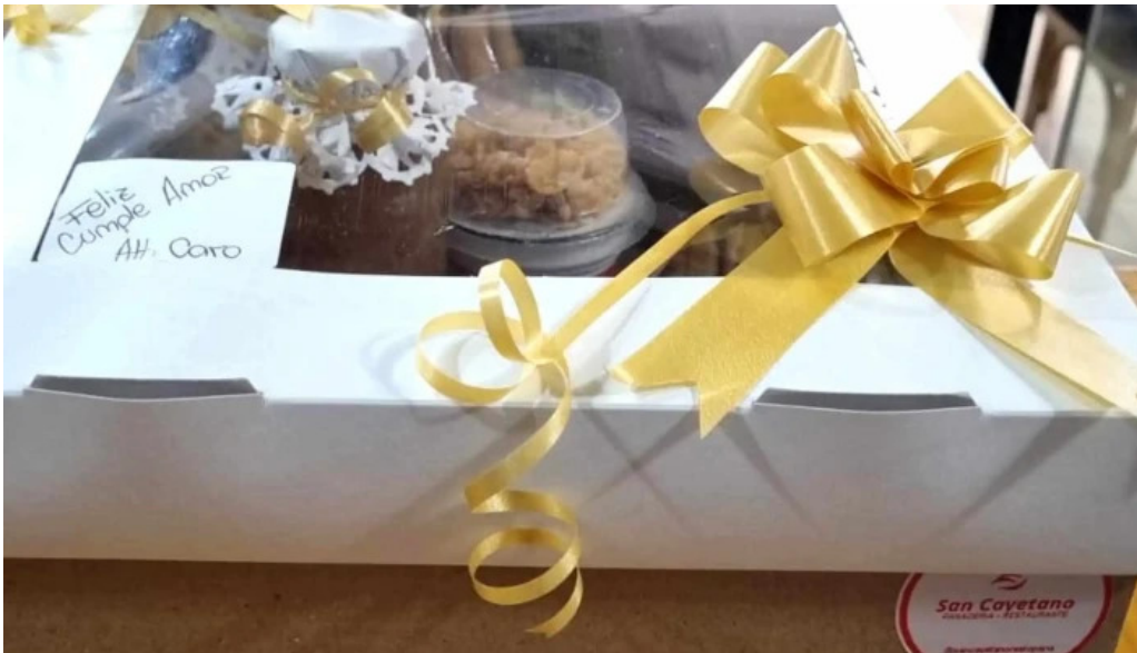
Panaderia restaurante san cayetano fotos