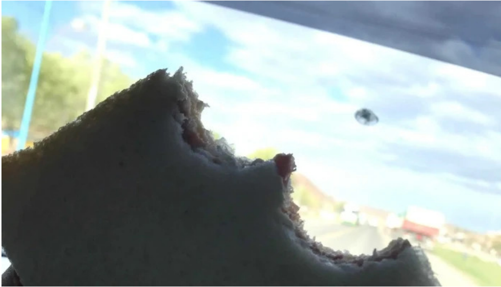
Panaderia restaurante san cayetano opiniones