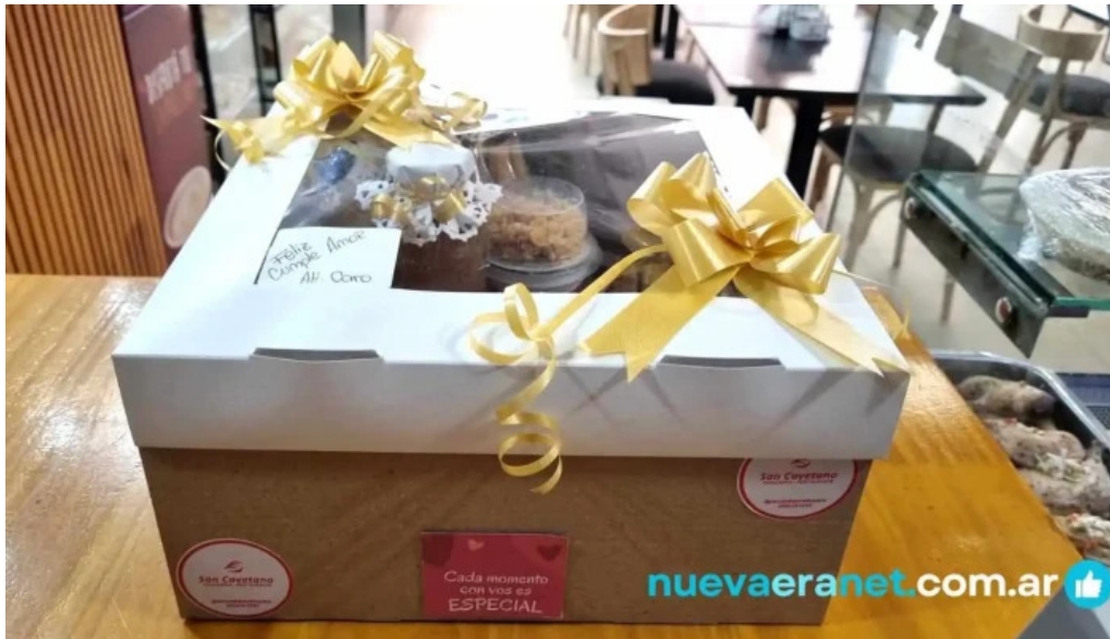
Panaderia restaurante san cayetano mas recientes