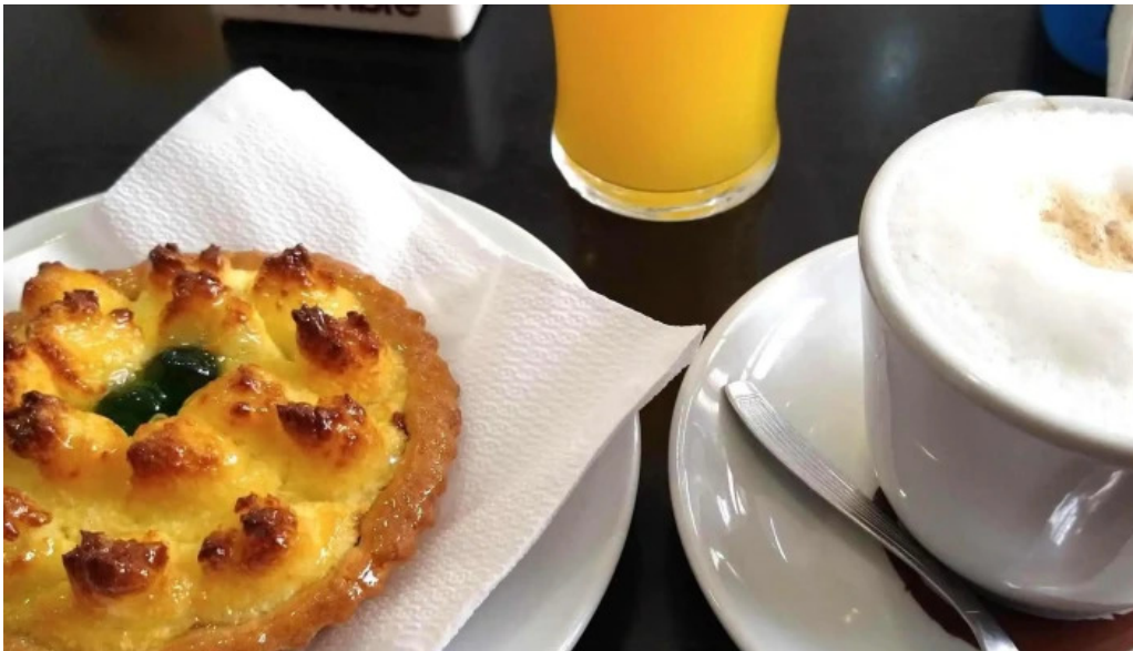
Panaderia restaurante san cayetano numero