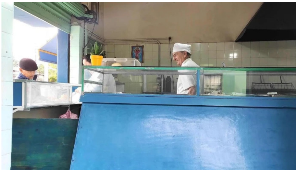
Pasteleria rosa clara w3400anr w3400anr