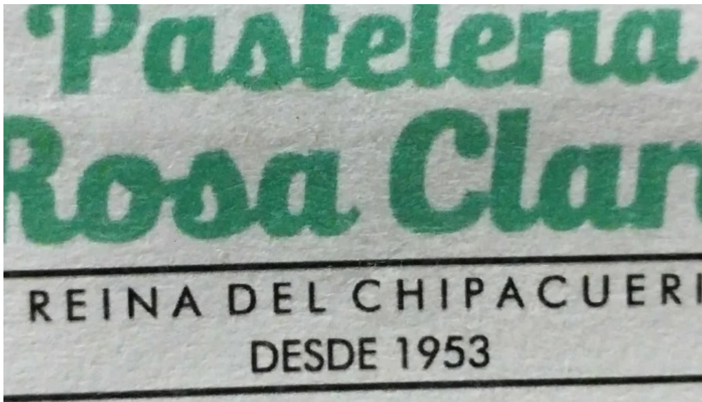
Pasteleria rosa clara opiniones