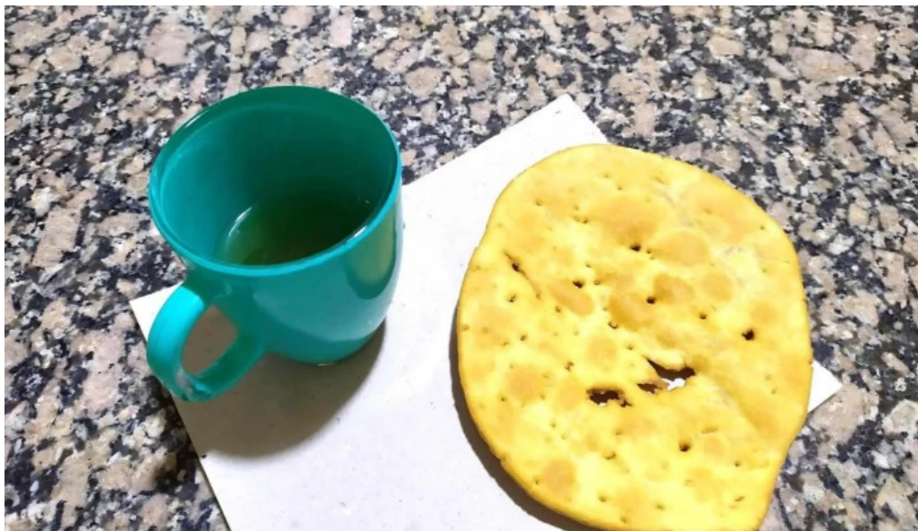
Pastelería rosa clara comida y bebida