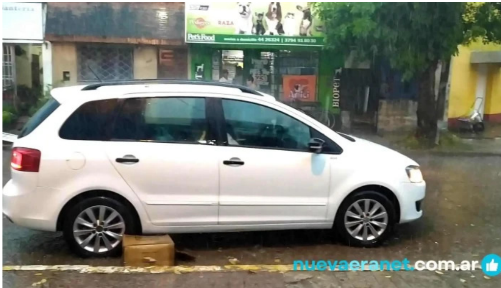
Pasteleria rosa clara videos