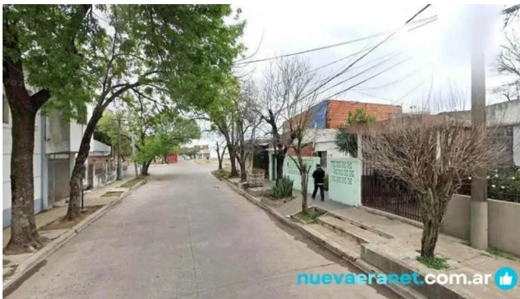
Repostería artesanal eli corrientes