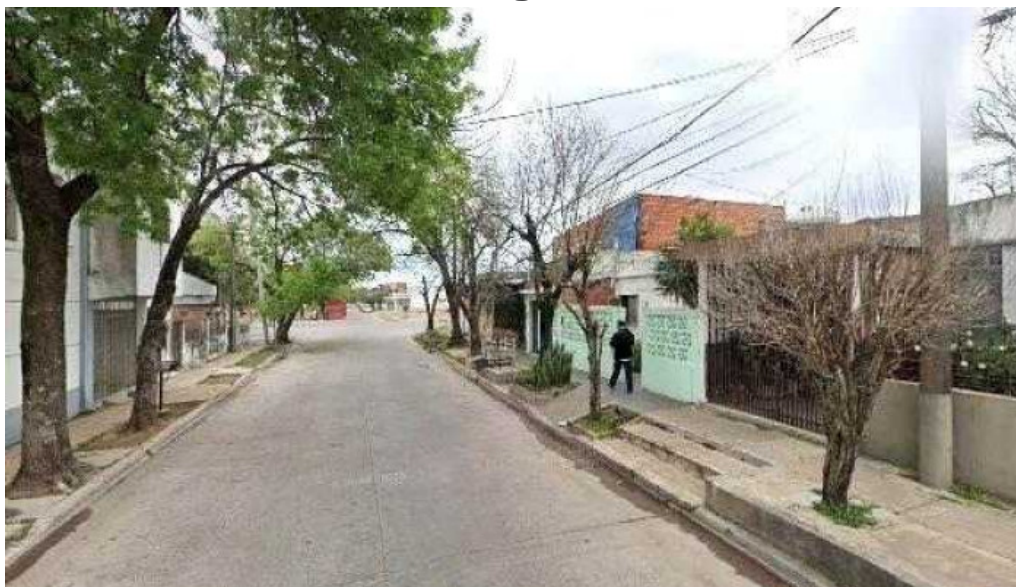
Reposteria artesanal eli opiniones