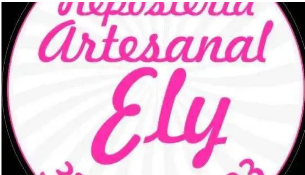
Reposteria artesanal eli del propietario