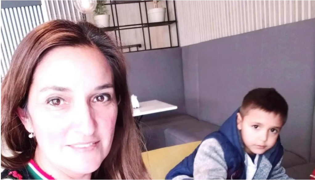
Andrea Franceschini fotos