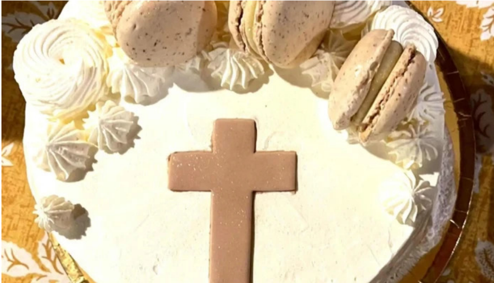
La pastelería comida y bebida