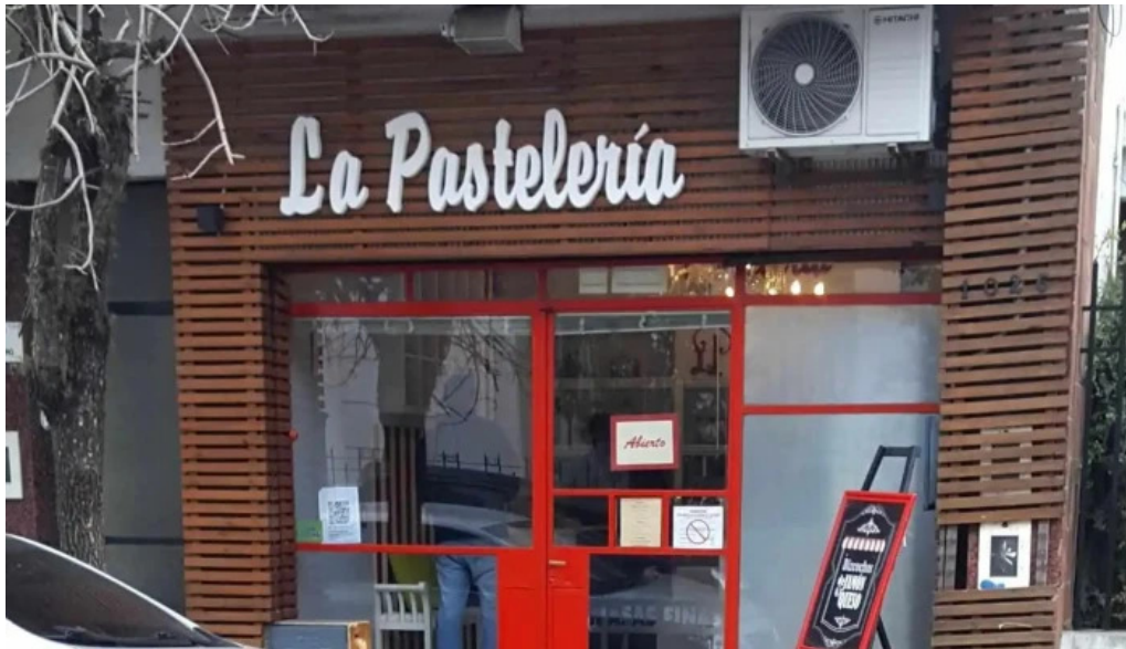
La pasteleria horario