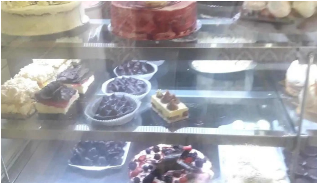
La pastelería ambiente