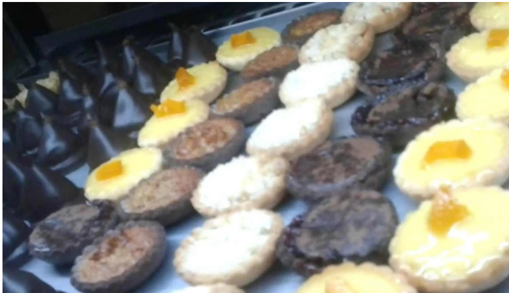
La pasteleria concordia