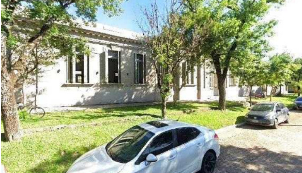
Red velvet cerca de mideg