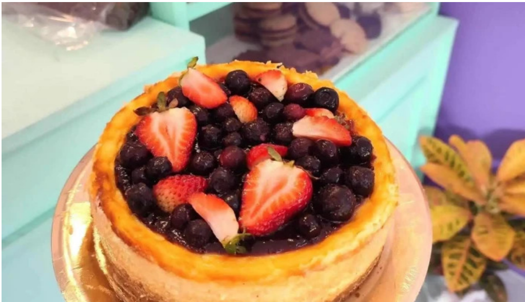
Red velvet cerca de mi