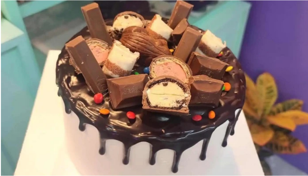
Red velvet comida y bebida