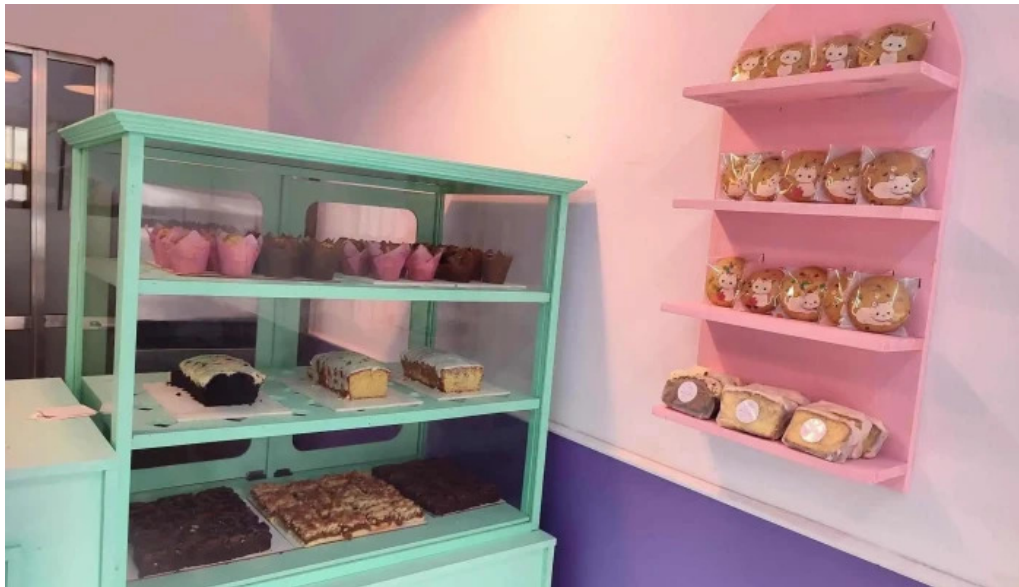
Red velvet ambiente