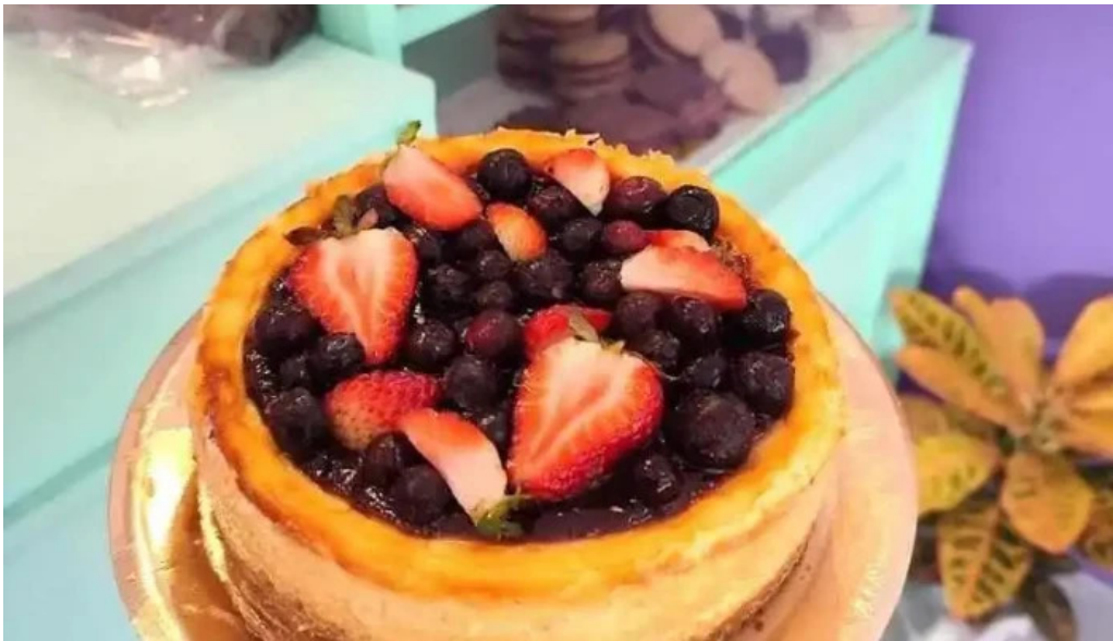
Red velvet colon