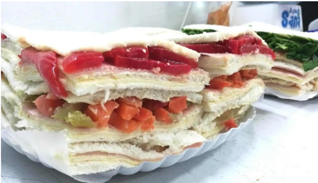
Lo de naty comida y bebida