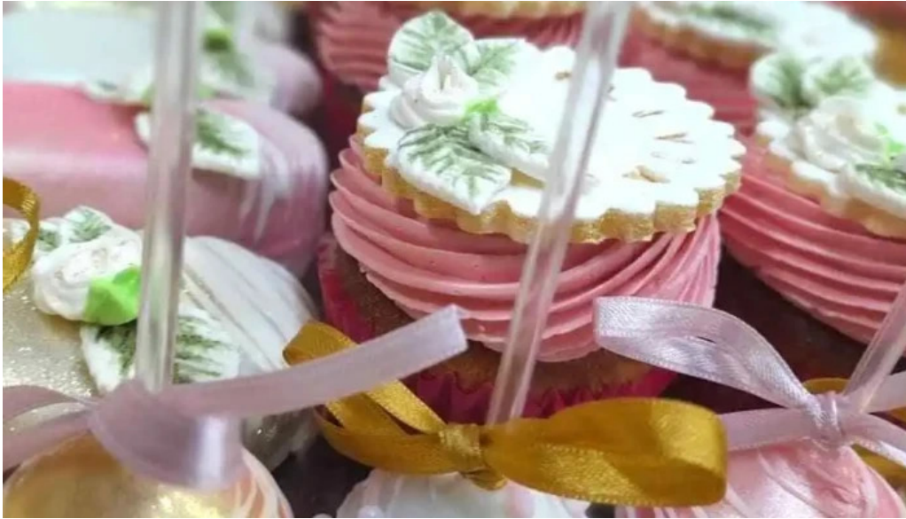
Lo de naty del propietario