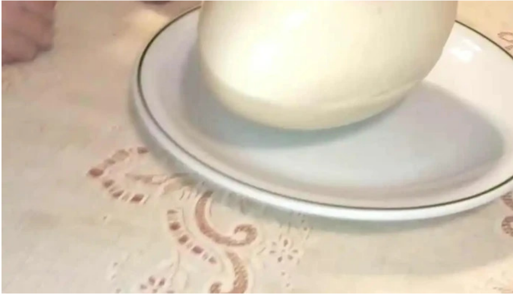
Lo de naty videos