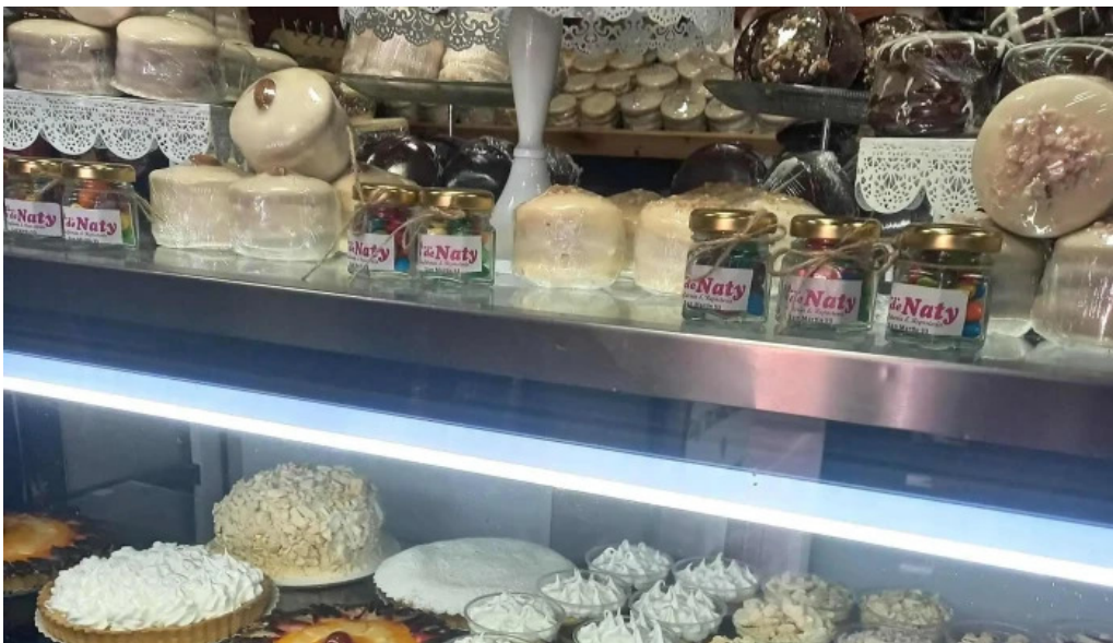
Lo de naty comentarios