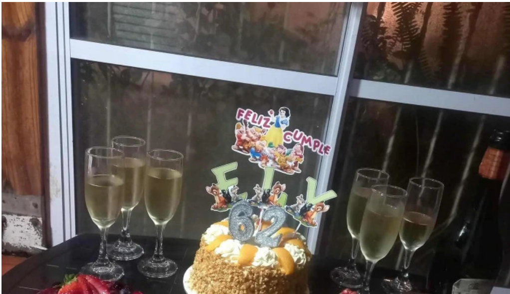
Lo de naty promocion