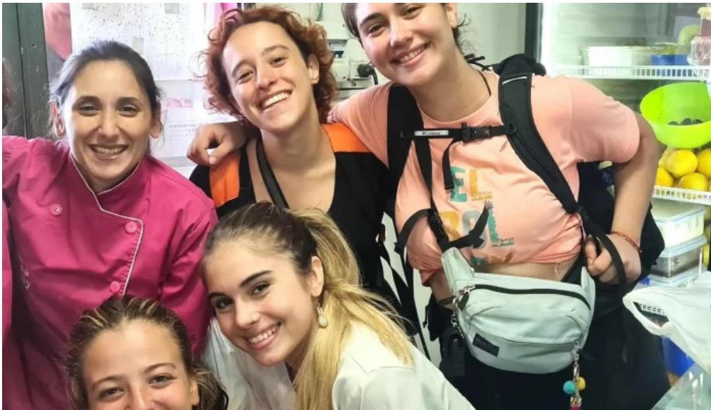
Lo de naty direccion