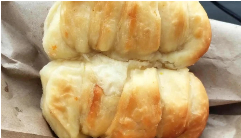
Lo de naty catalago