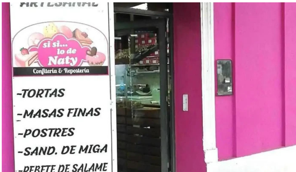
Lo de naty carta