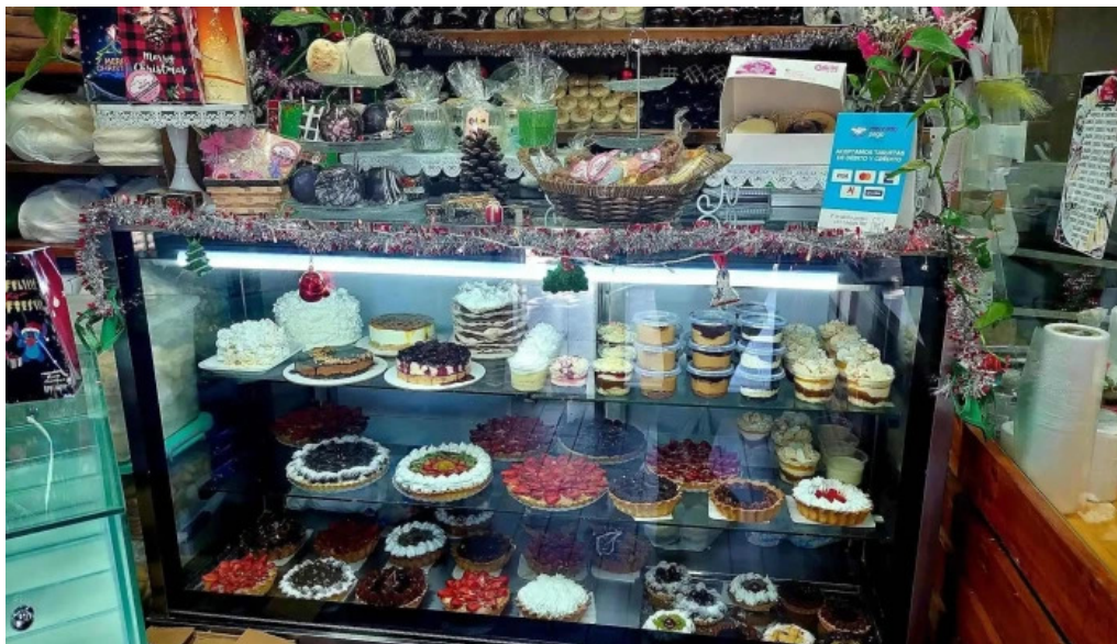
Lo de naty ambiente