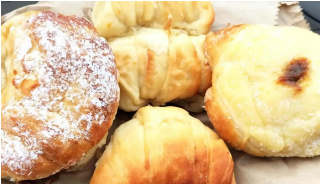
Lo de naty colon