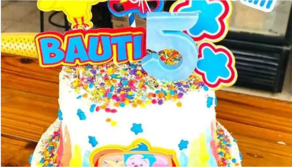
Tia maria pasteleria pastel de cumpleaños