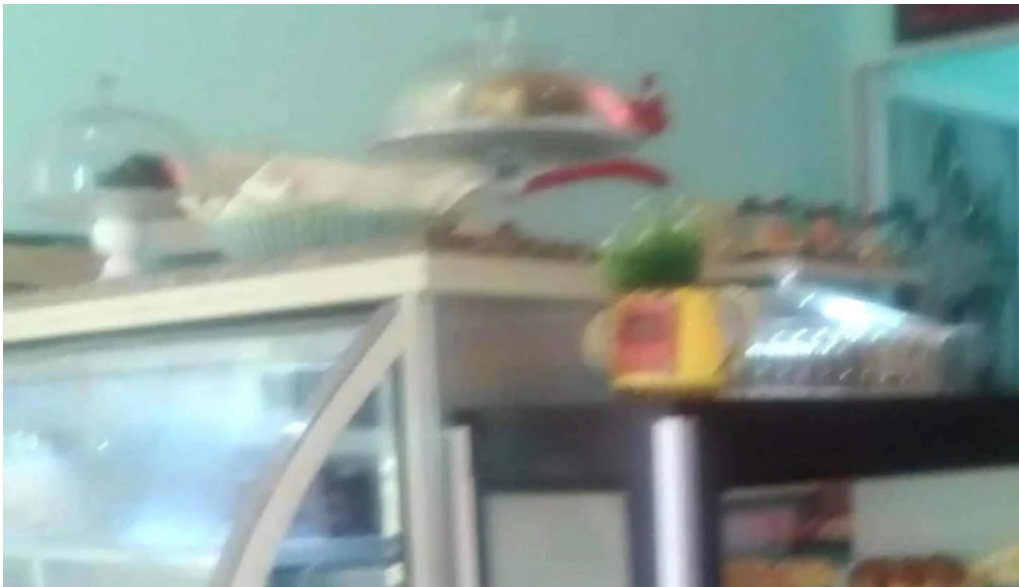
Tia maria pasteleria puntaje