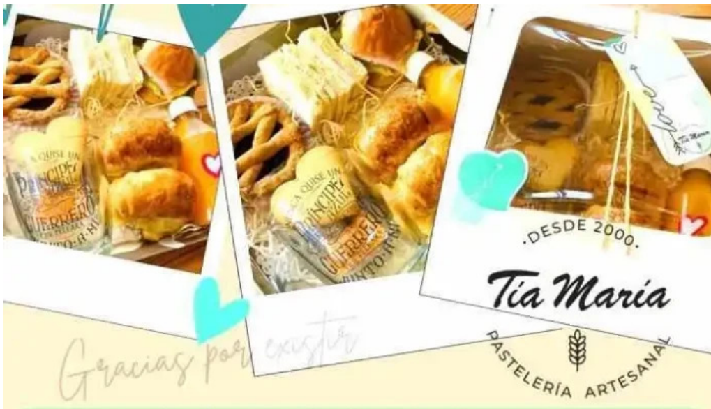
Tia maria pasteleria del propietario