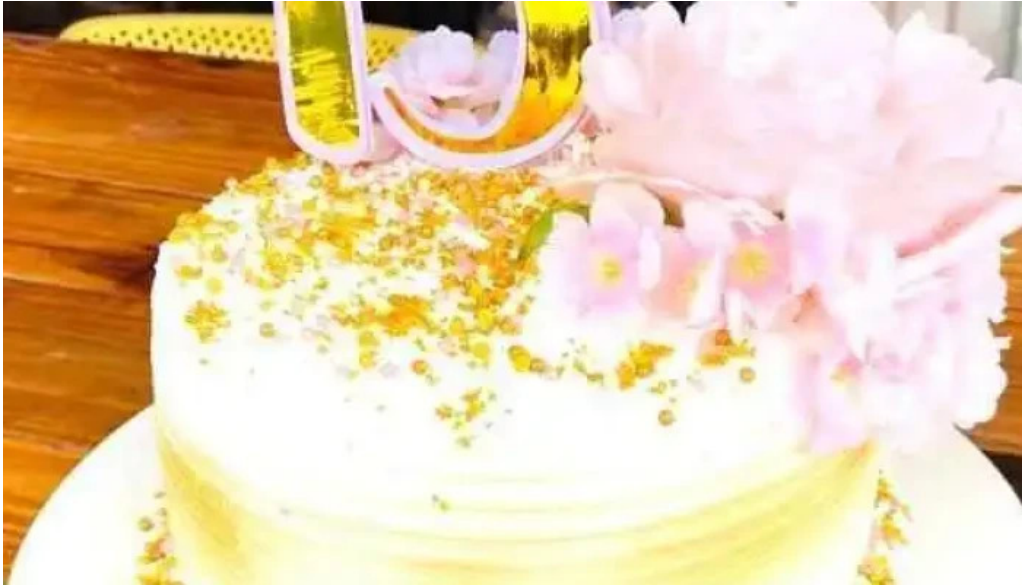
Tia maria pasteleria comida y bebida