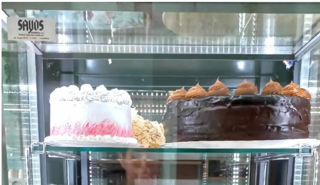
Tia maria pasteleria instagram