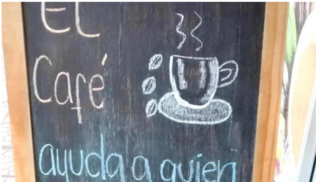
Tia maria pasteleria descuentos