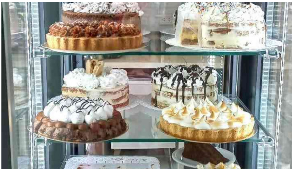
Tia maria pasteleria ambiente