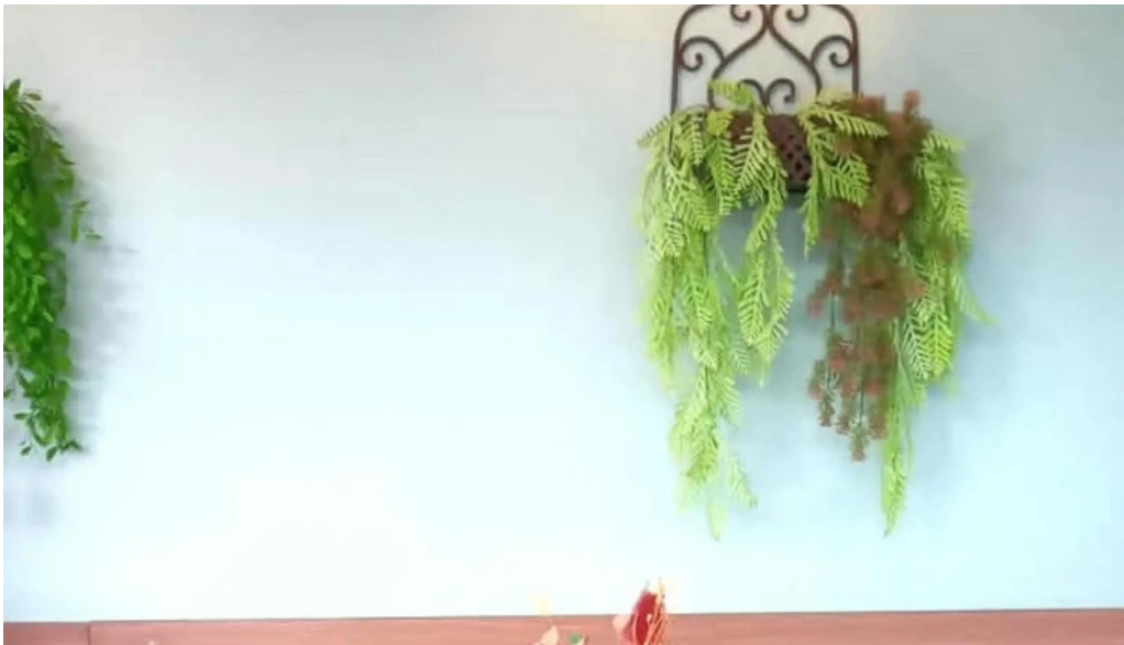
Tia maria pasteleria numero