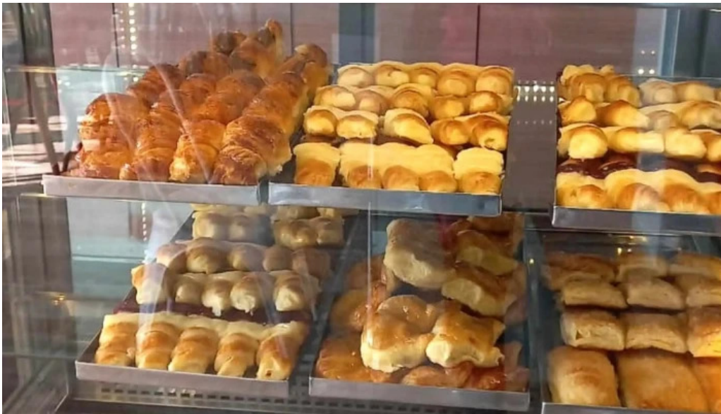
Tia maria pasteleria clorinda