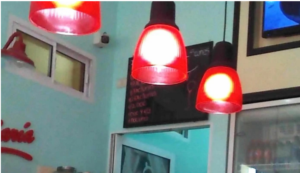
Tia maria pasteleria sitio web