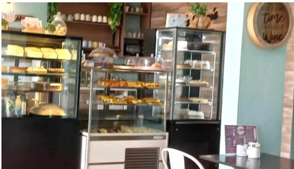
Tia maria pasteleria abierto ahora