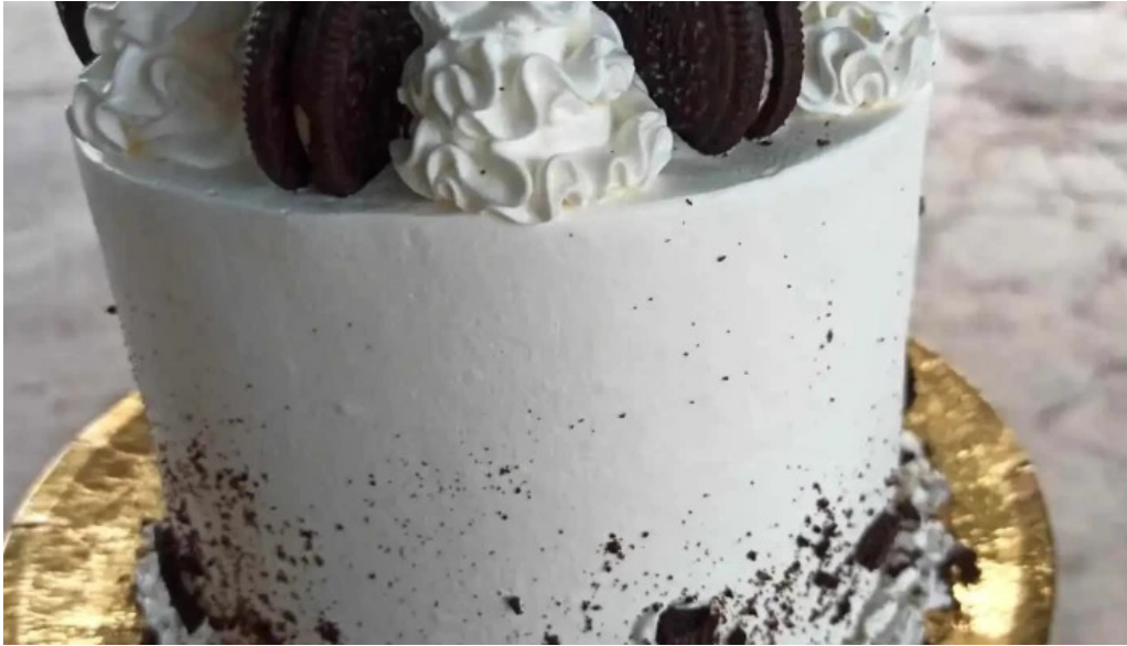
Punto nieve pastel