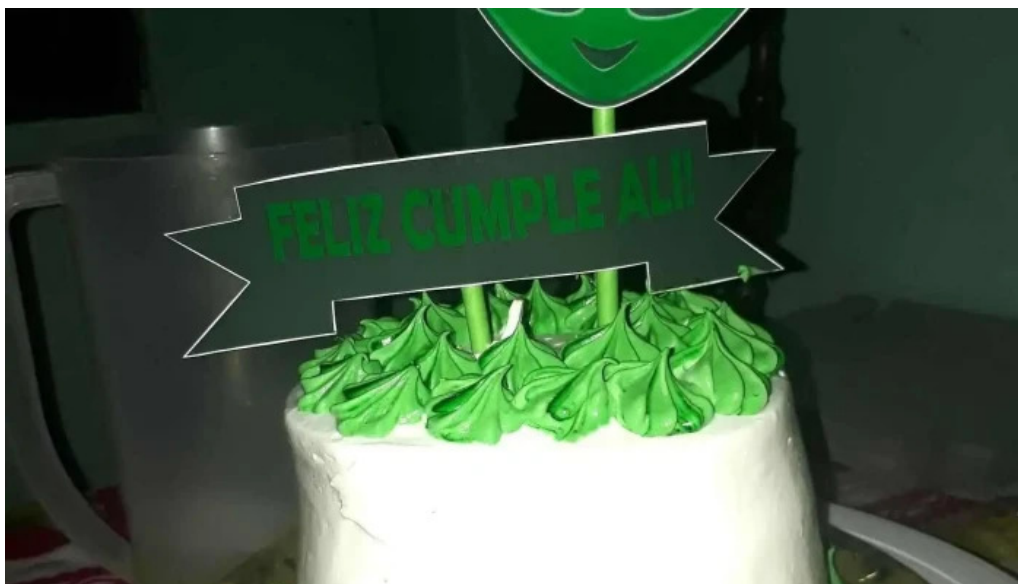
Punto nieve del propietario