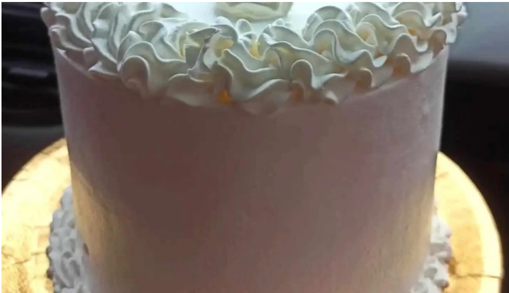
Punto nieve direccion