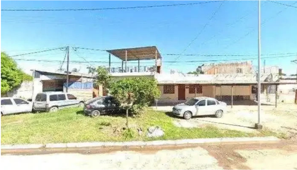
Punto nieve direcciondeg