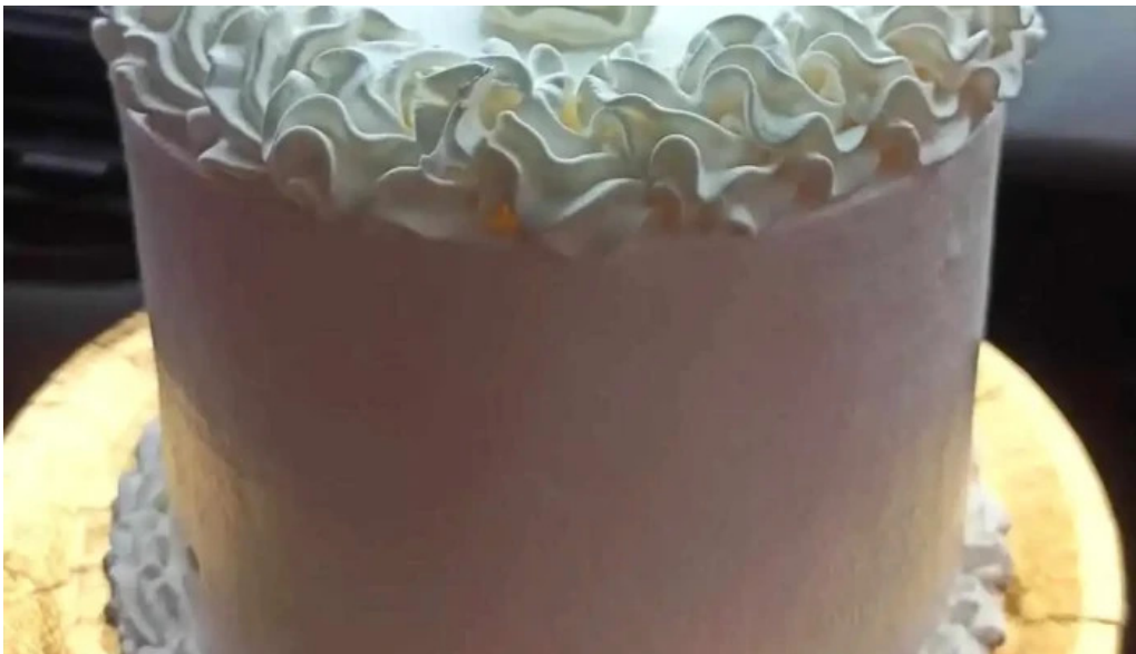
Punto nieve ? clorinda