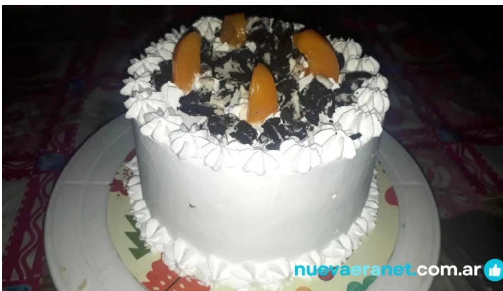
Punto nieve comida y bebida