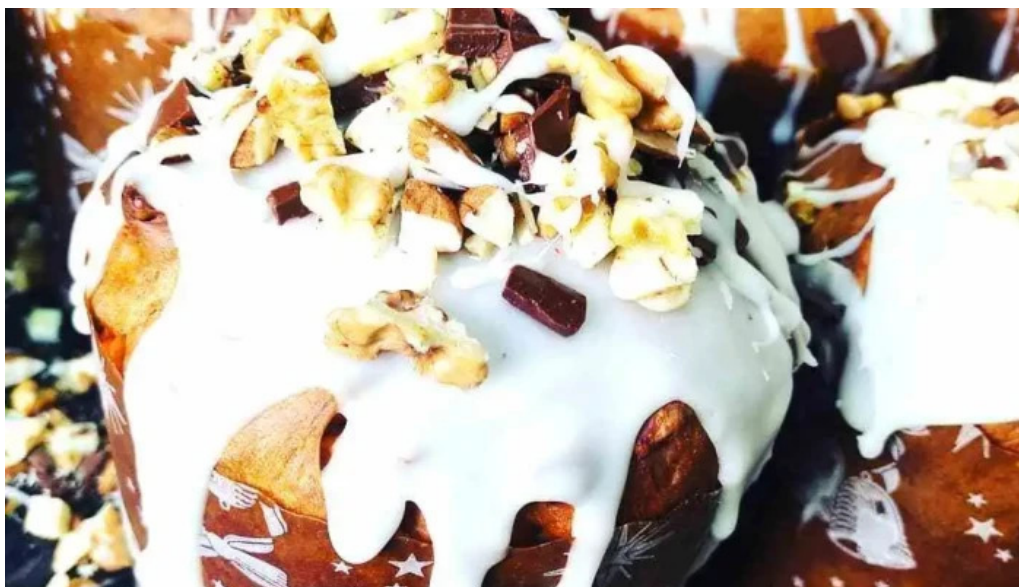
Punto caramelo 2012 cipolletti