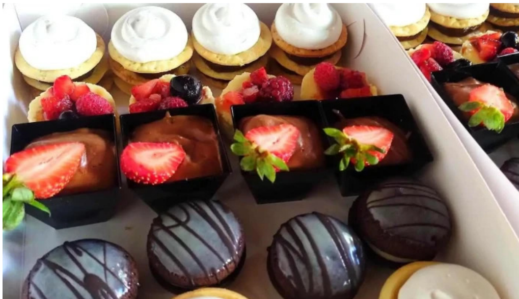
Punto caramelo 2012 del propietario