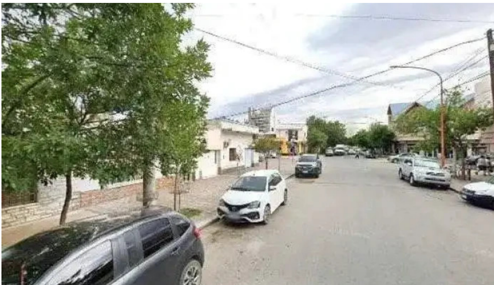
Punto caramelo 2012 opinionesdeg