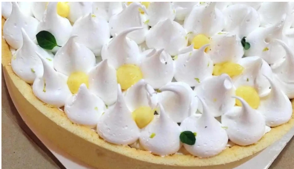
Punto caramelo 2012 comida y bebida