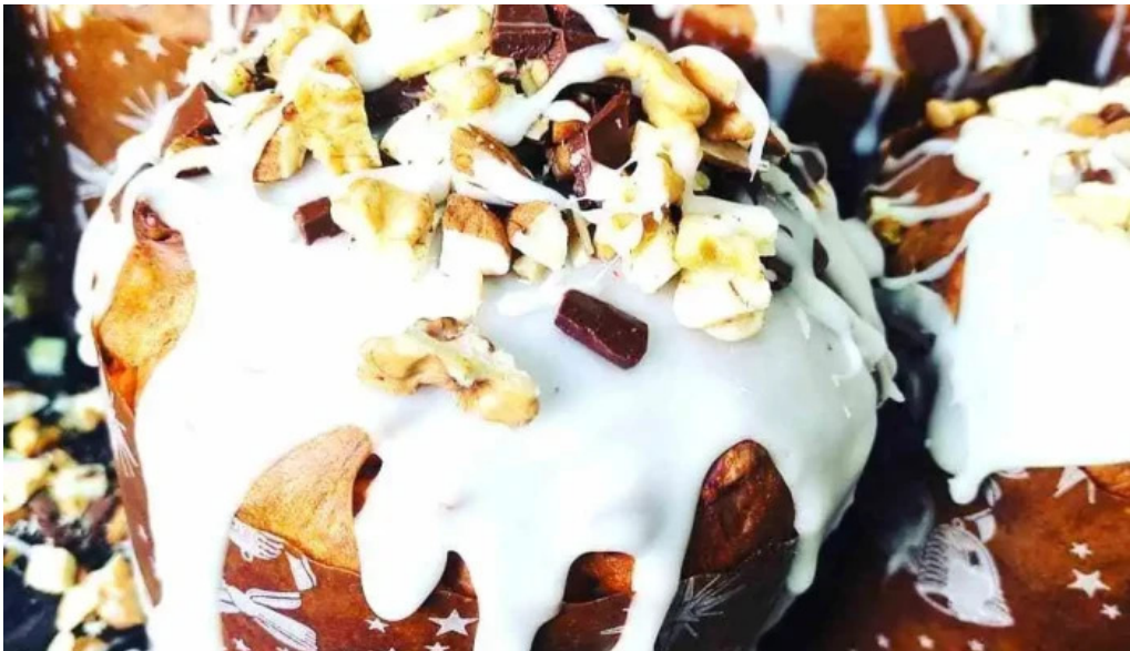
Punto caramelo 2012 opiniones