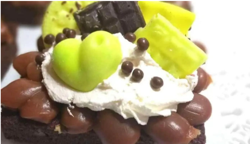
Pasteleria artesanal carmencita chocolate