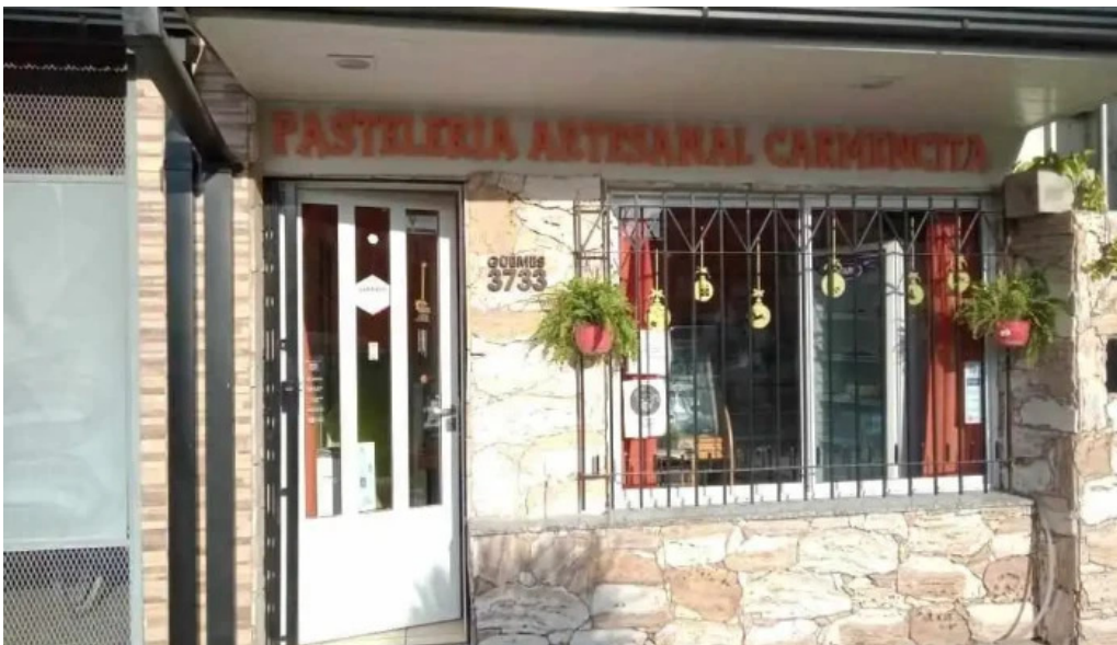
Pasteleria artesanal carmencita casilda