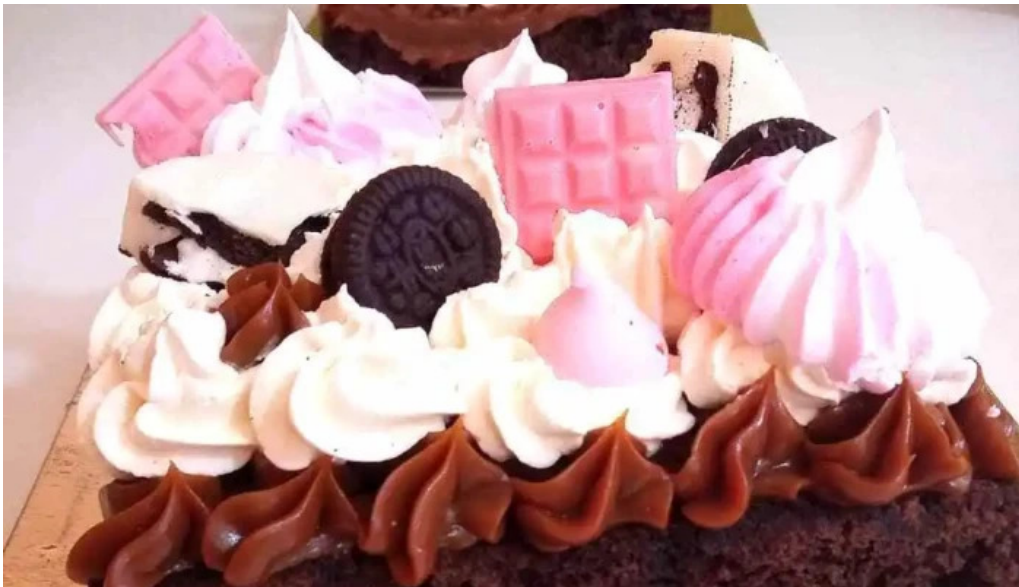
Pasteleria artesanal carmencita comida y bebida