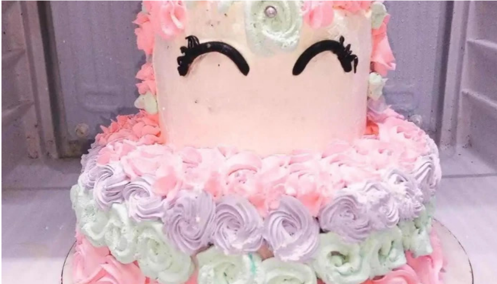
Pasteleria artesanal carmencita del propietario