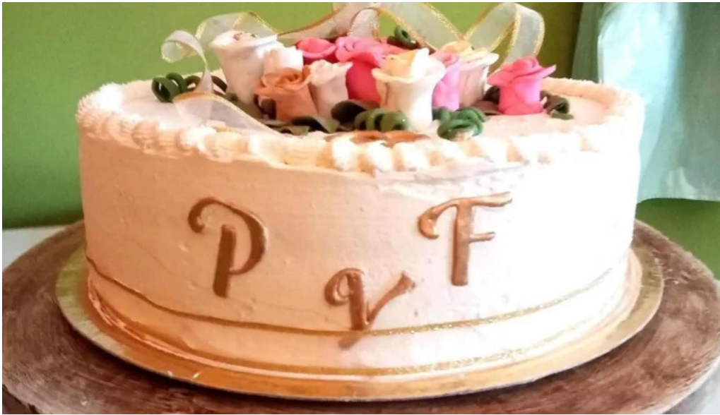
Pasteleria artesanal carmencita pastel de cumpleaños