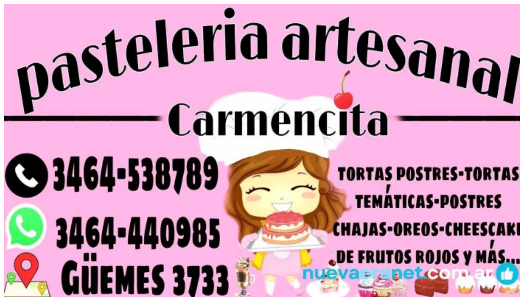
Pasteleria artesanal carmencita carta