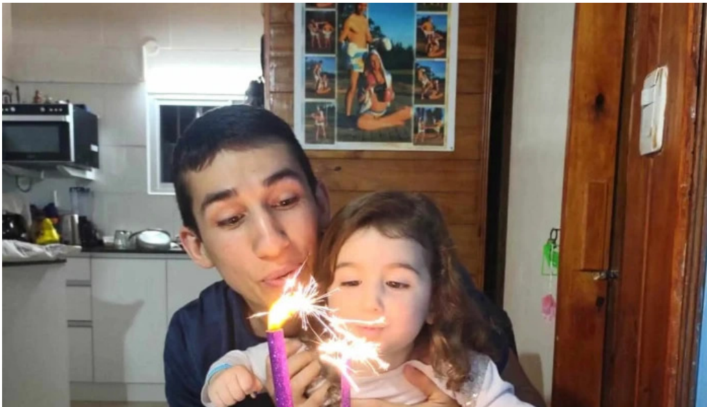
Antojos pasteleria artesanal instagram