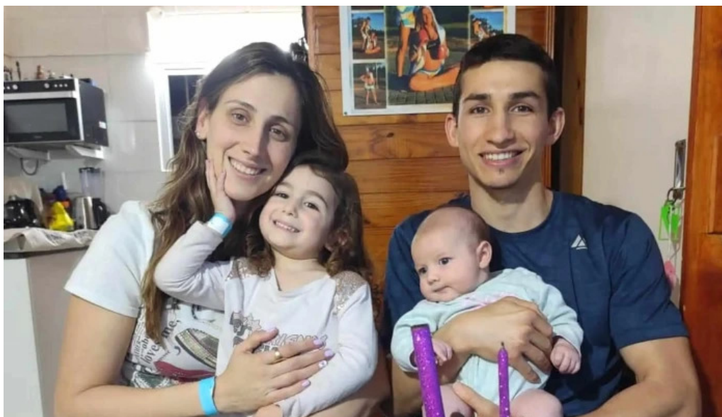
Antojos pasteleria artesanal casilda