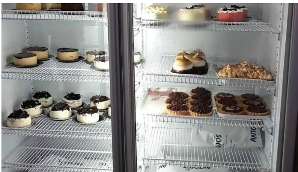
Antojos pasteleria artesanal ambiente