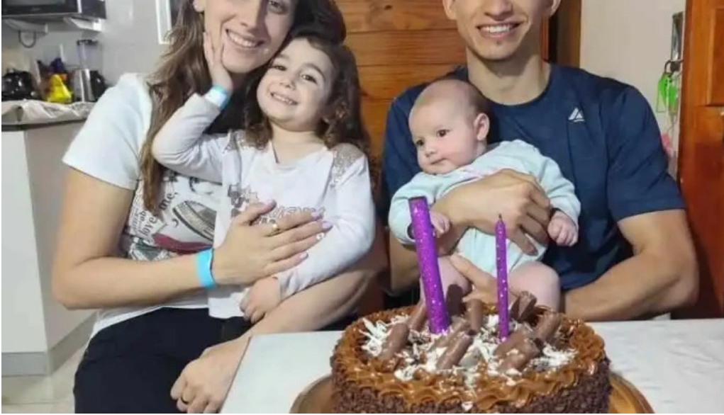
Antojos pasteleria artesanal pastel