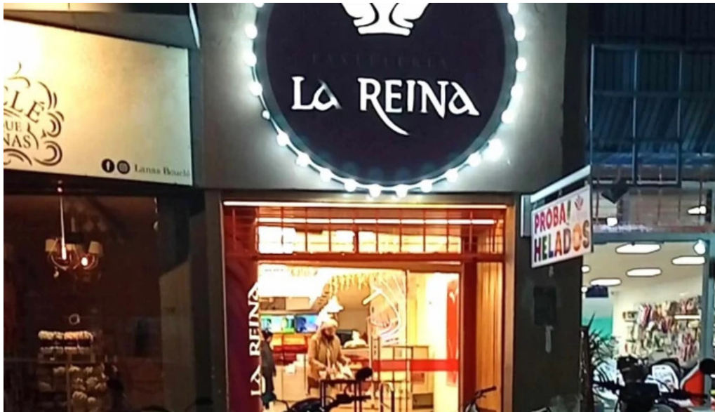
Pastelería la reina bell ville