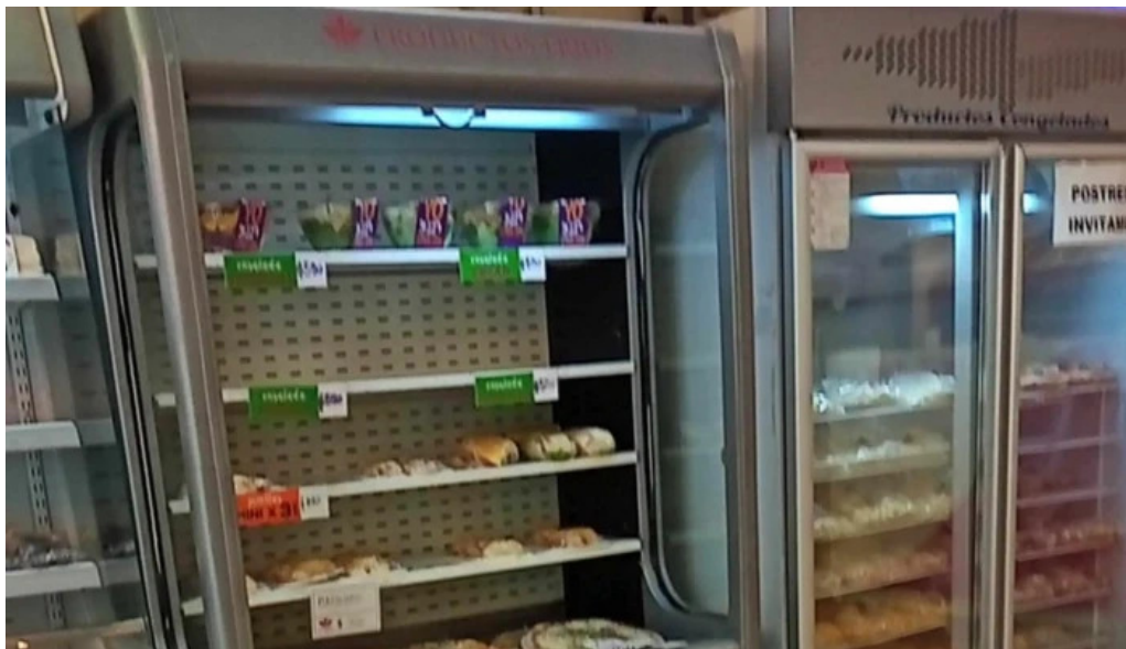
Pasteleria la reina catalogo