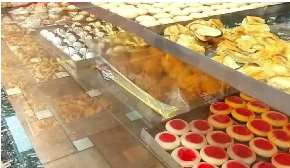
Pastelería la reina ambiente