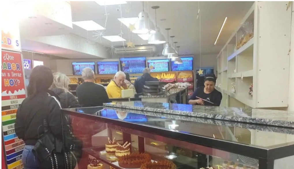
Pasteleria la reina puntaje