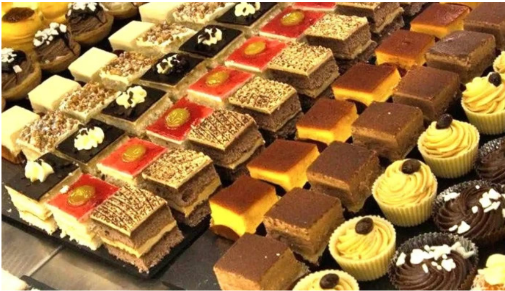
Pasteleria la reina videos