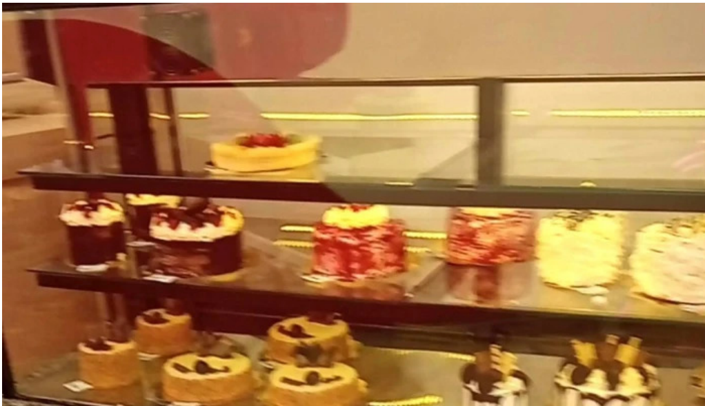
Pasteleria la reina ubicacion