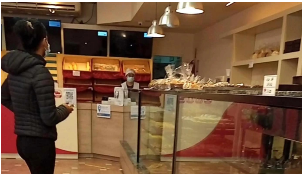
Pastelería la reina zona