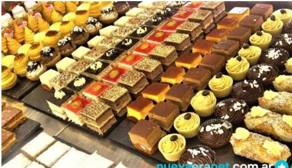
Pasteleria la reina pastel