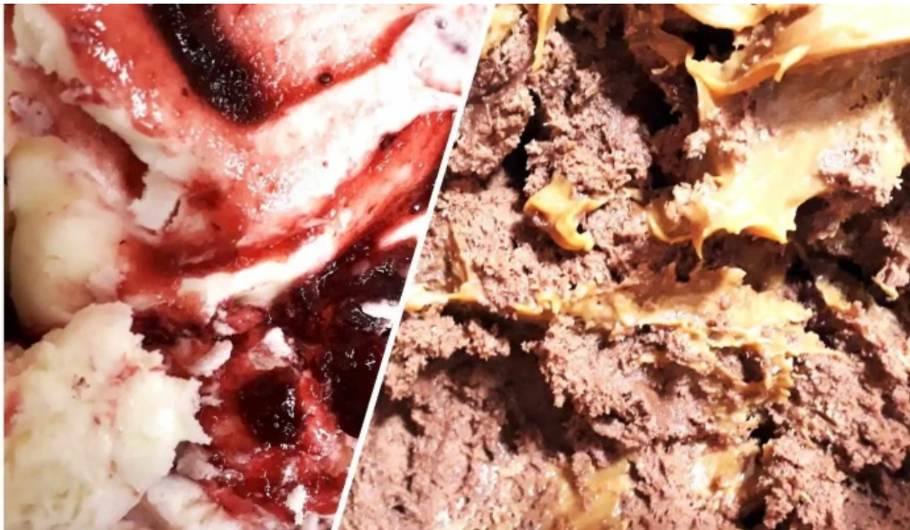
Pasteleria la reina comida y bebida