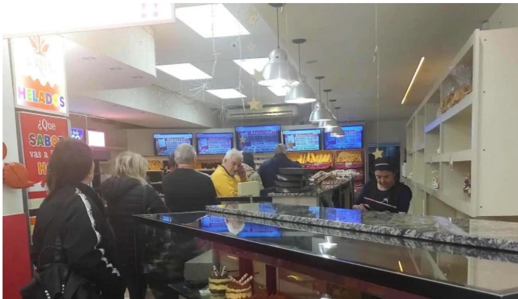
Pasteleria la reina promocion