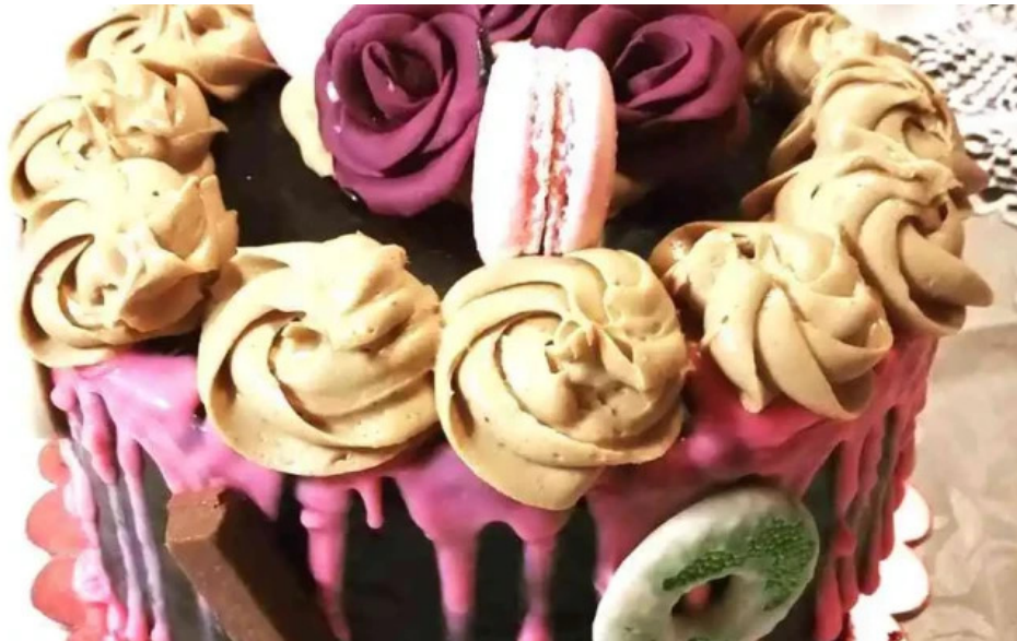
Mil delicias pasteleria barranqueras