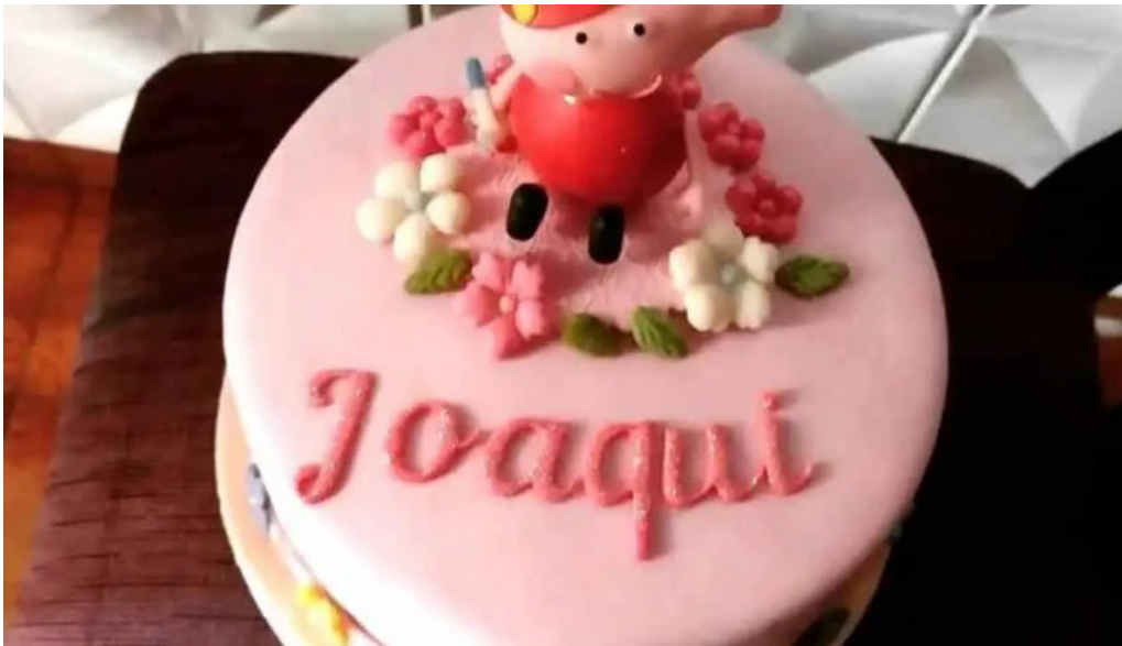
Mil delicias pasteleria del propietario