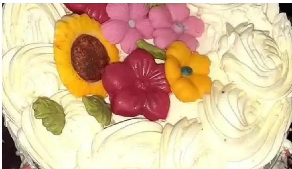
Mil delicias pastelería horneado