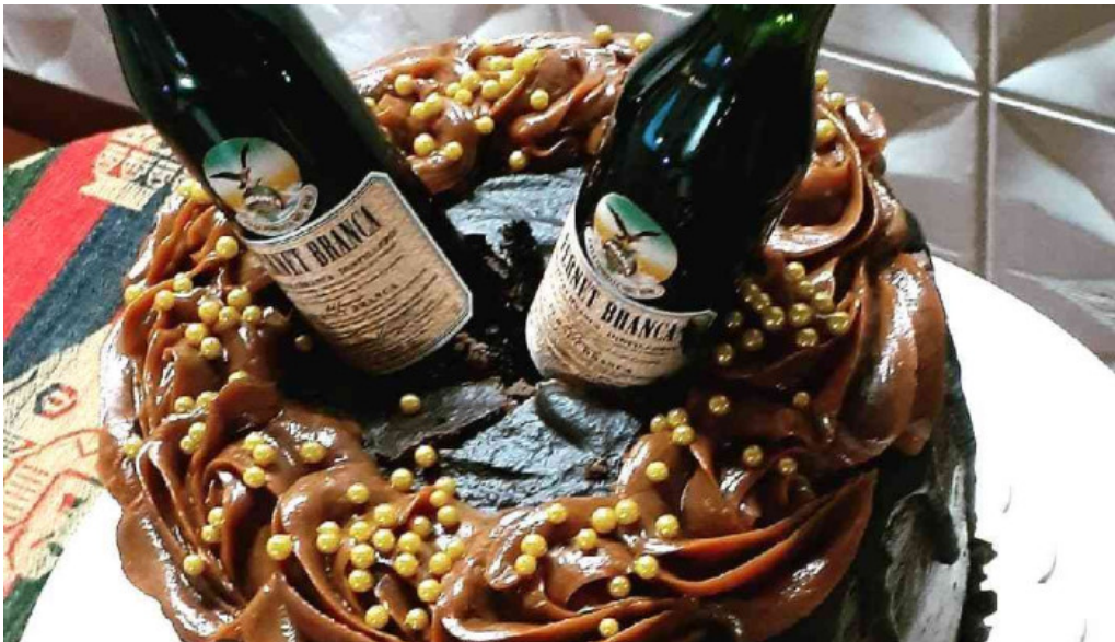
Mil delicias pasteleria comida y bebida