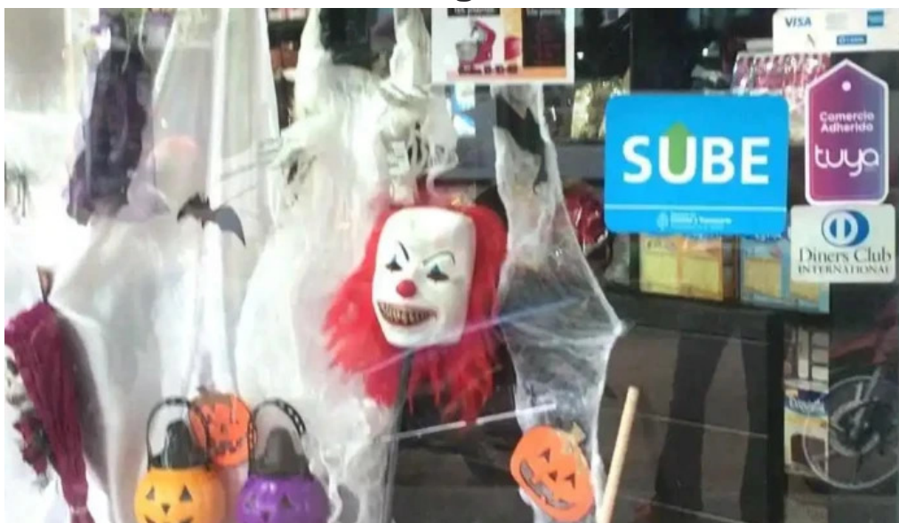
Chocolate cotillon reposteria descartables videos