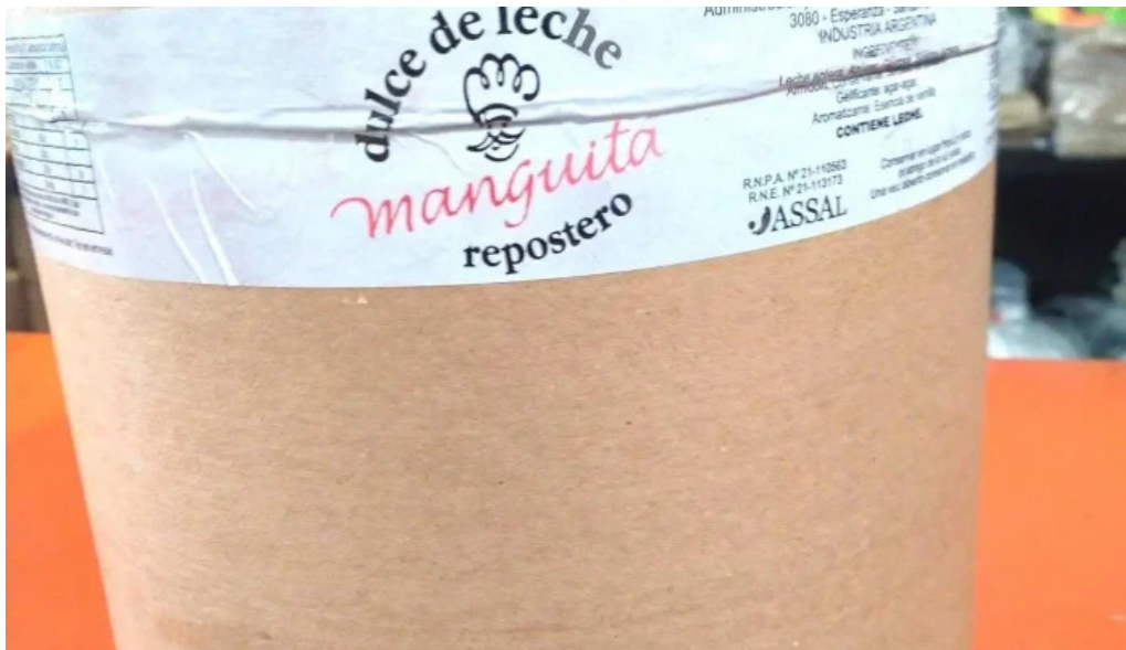
Chocolate cotillon reposteria descartables comida y bebida