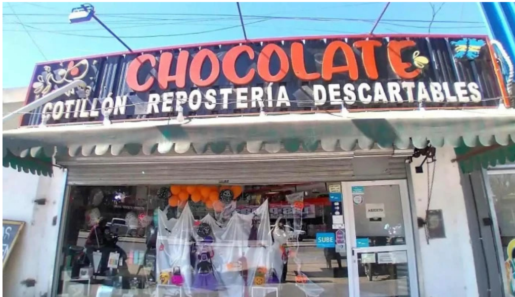
Chocolate cotillon reposteria descartables barranqueras