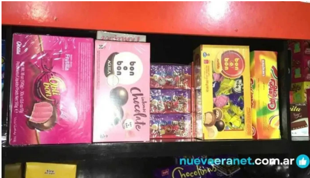
Chocolate cotillon reposteria descartables carta