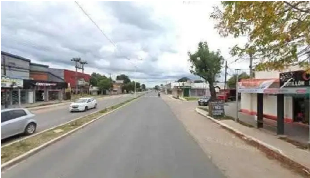
Chocolate cotillon reposteria descartables sitio web