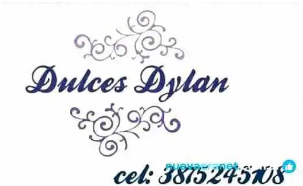
Dulces dylan del propietario