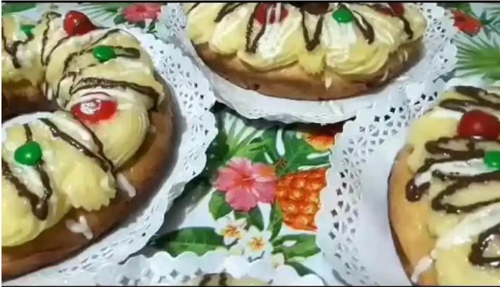
Dulces dylan comidas y bebidas