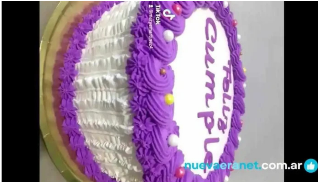
Dulces dylan videos