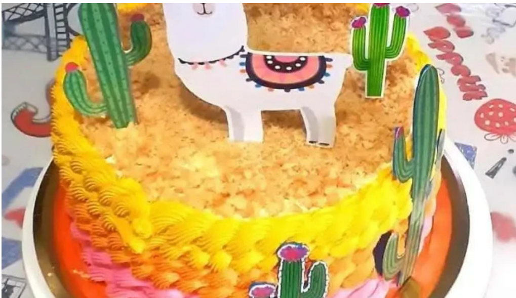
Dulces dylan 28 de noviembre