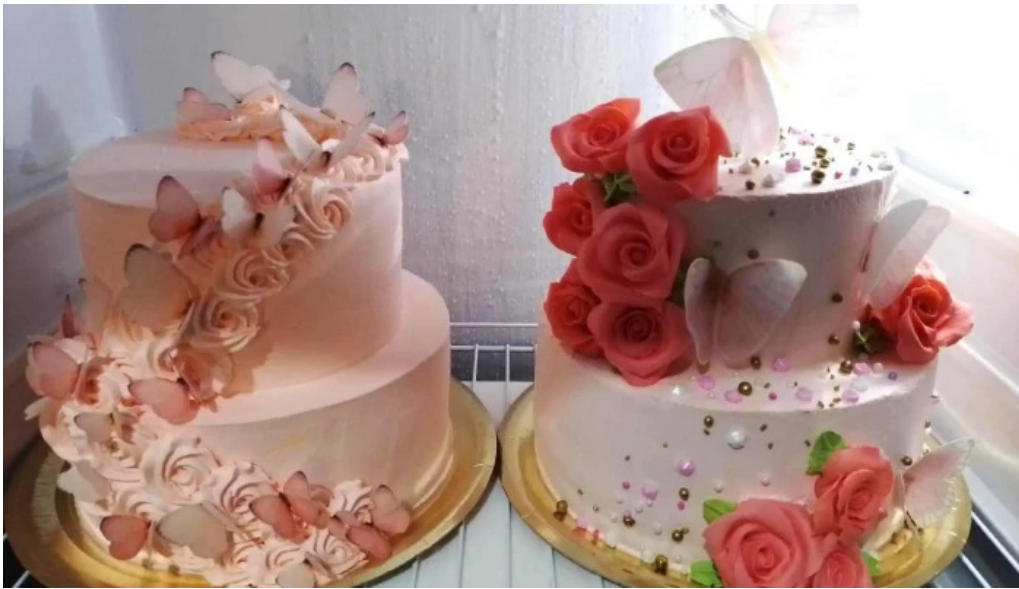
Dulces dylan pastel