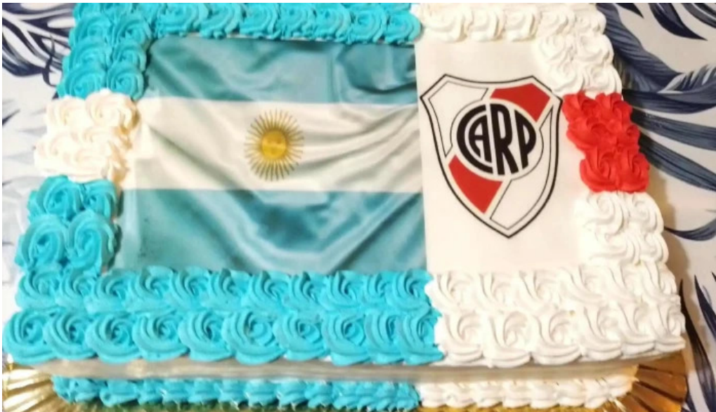
Dulces dylan pastel de cumpleaños