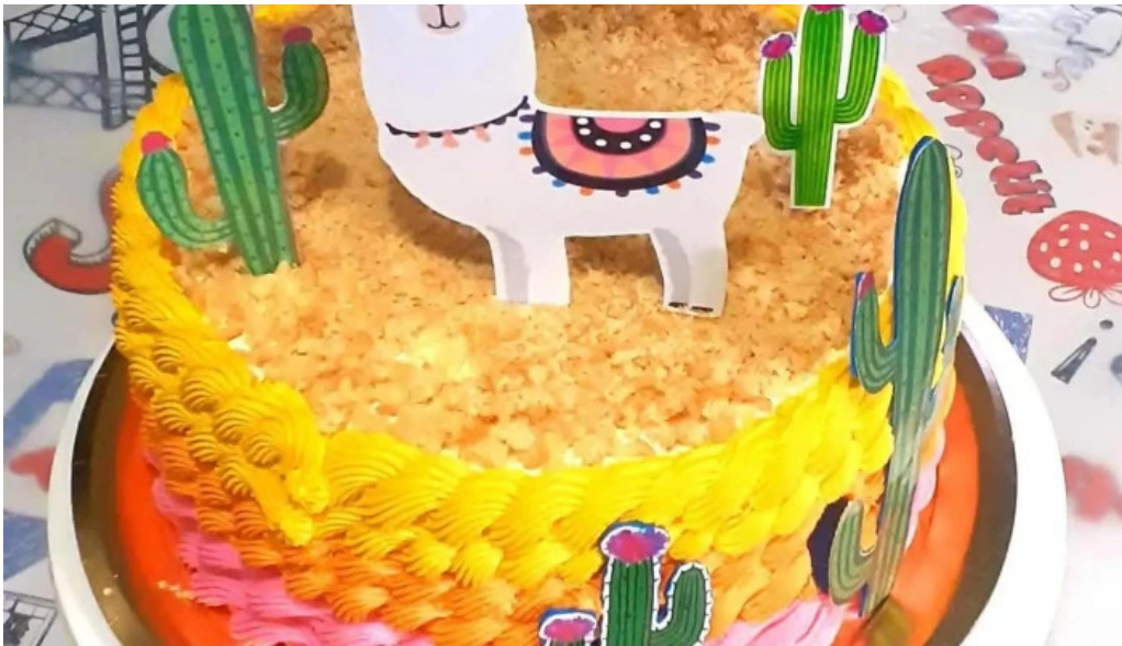
Dulces dylan pasteleria