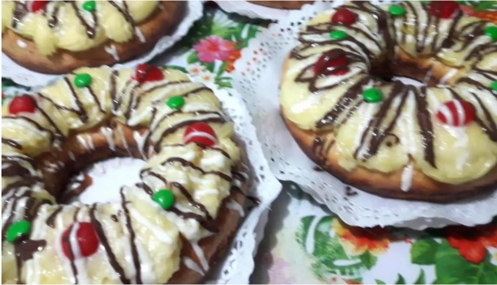
Dulces dylan rosca de reyes