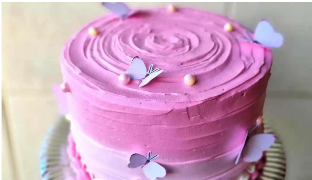
Dulces caprichos reposteria artesanal comidas y bebidas