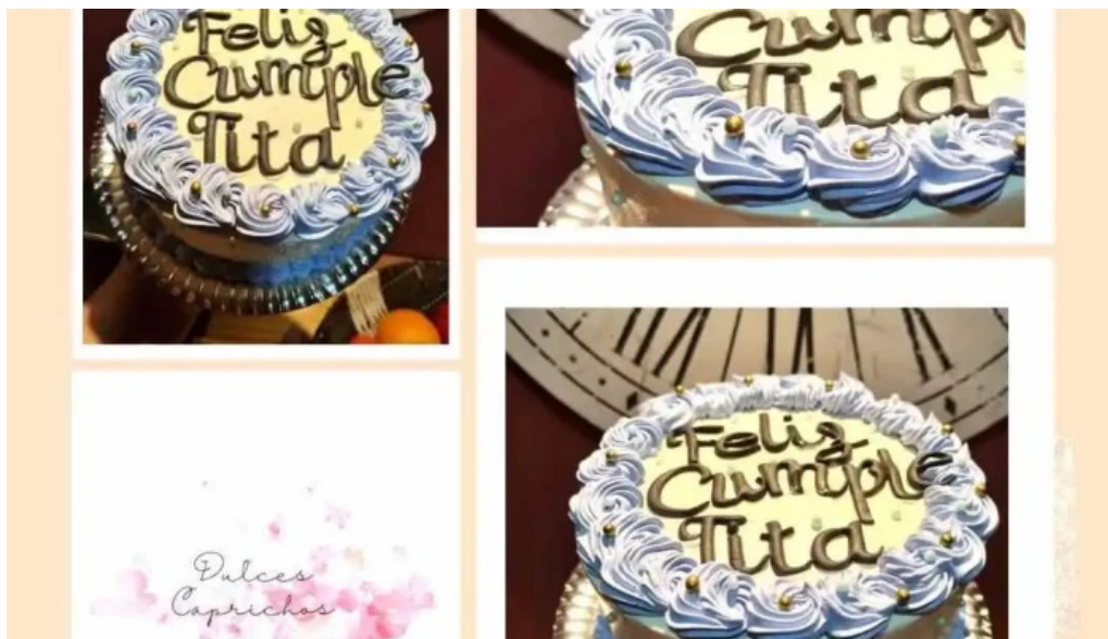
Dulces caprichos reposteria artesanal horneado