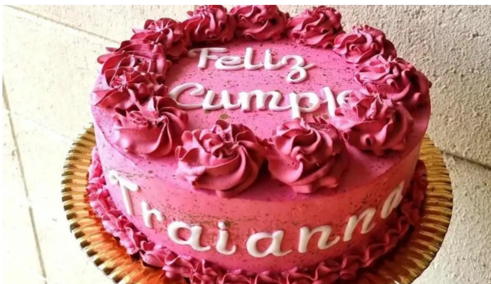
Dulces caprichos reposteria artesanal 28 de noviembre