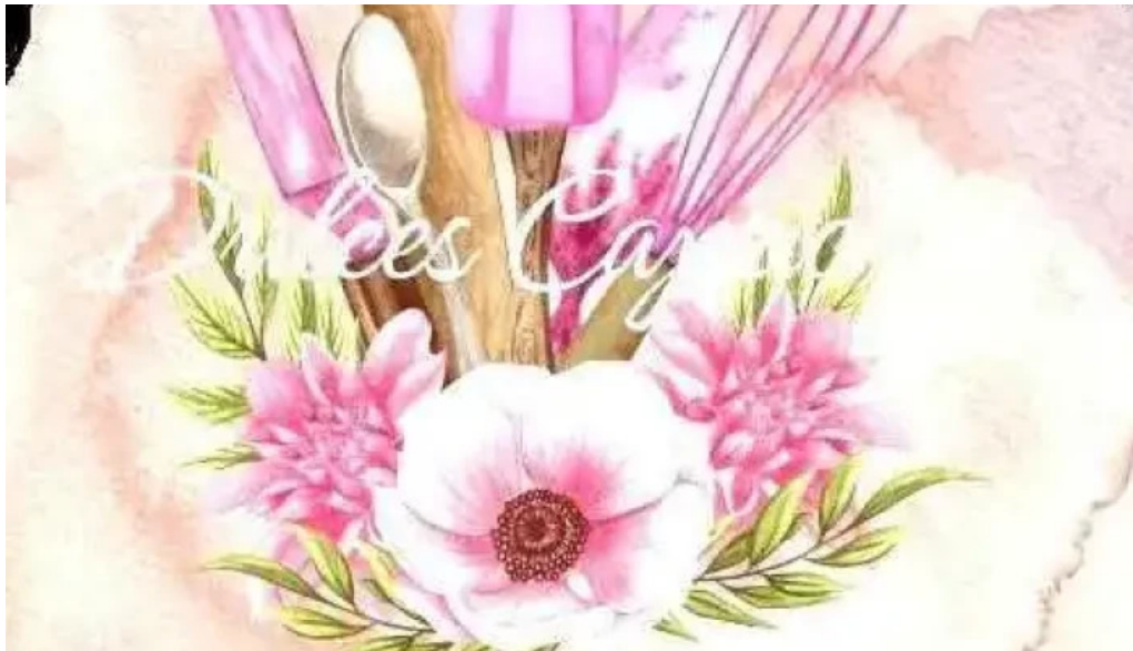
Dulces caprichos reposteria artesanal del propietario