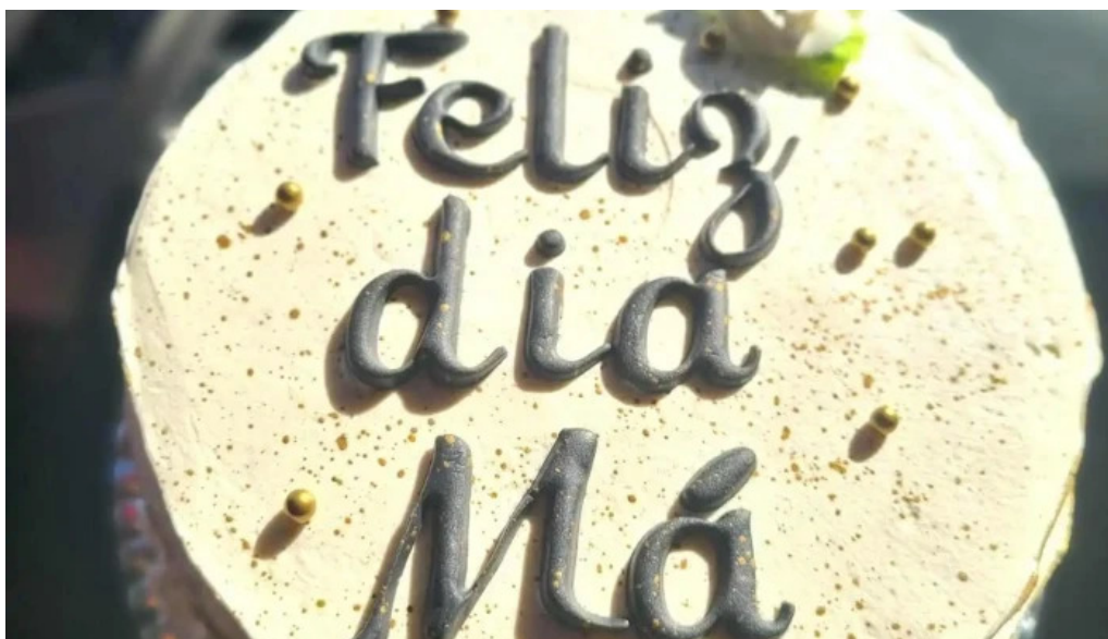
Dulces caprichos reposteria artesanal pastel