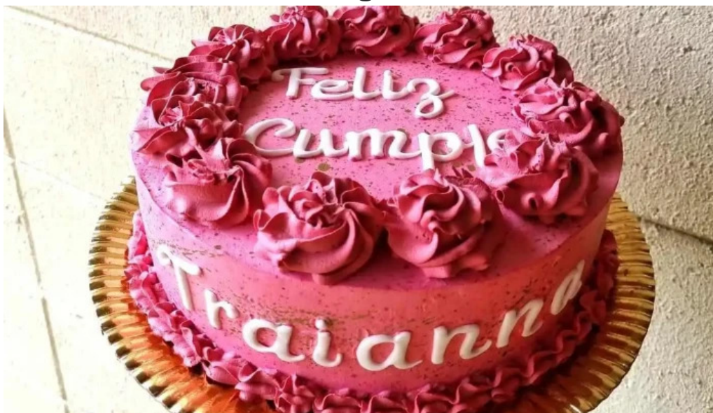
Dulces caprichos reposteria artesanal pasteleria