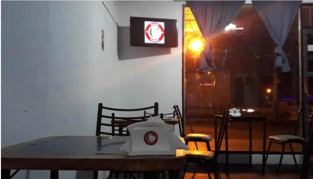
No existe mas del propietario