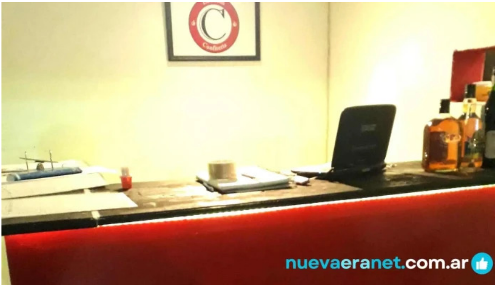
No existe mas catalogo