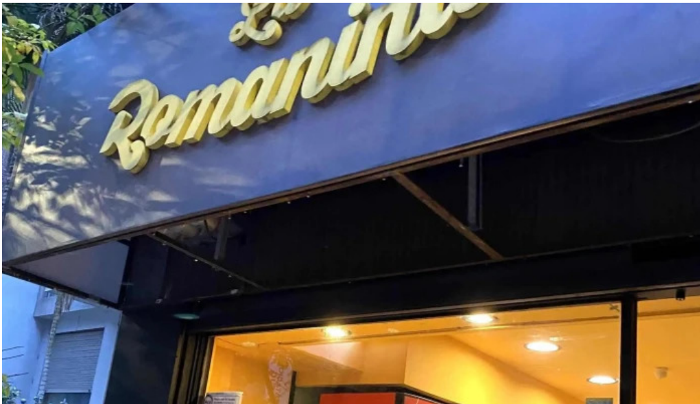
La romanina panaderia y cafeteria sitio web