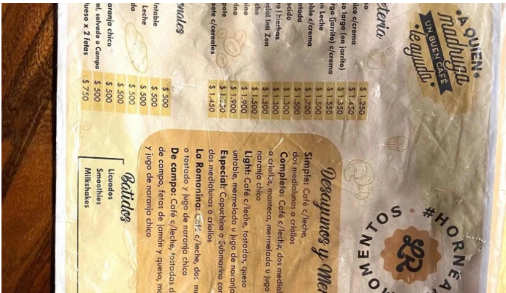
La romanina panaderia y cafeteria precios