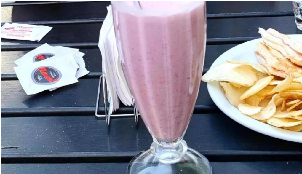
La romanina panaderia y cafeteria opiniones