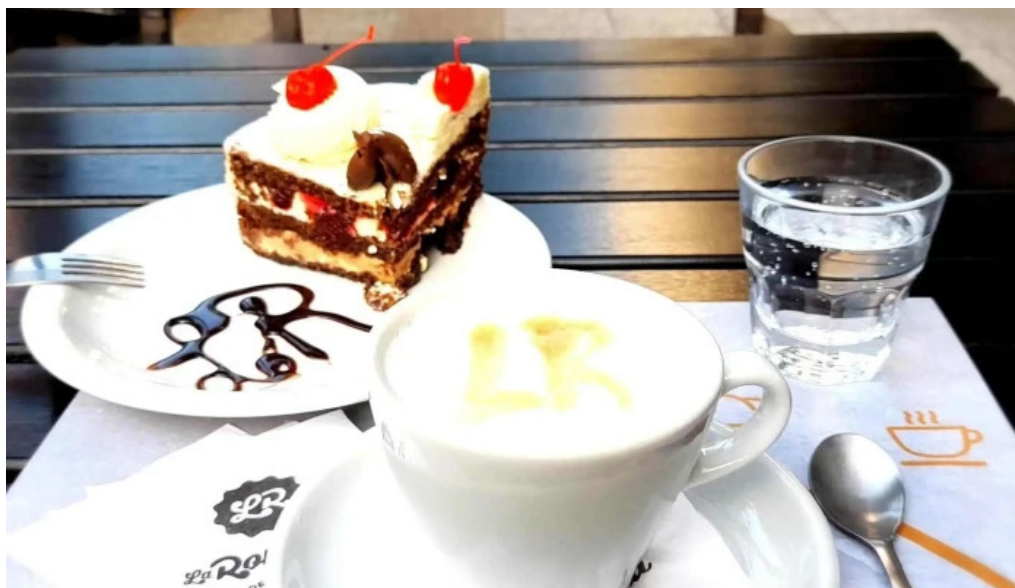
La romanina panaderia y cafeteria capuchino