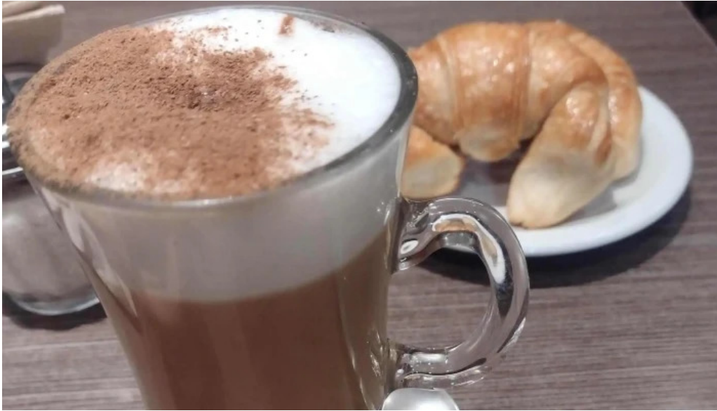
La romanina panaderia y cafeteria videos