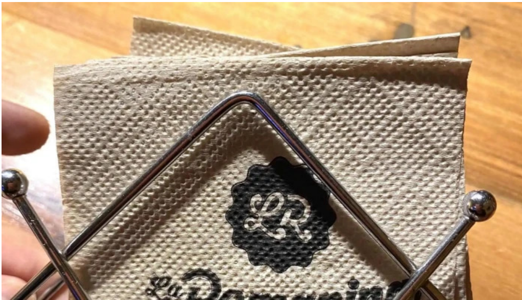
La romanina panaderia y cafeteria telefono