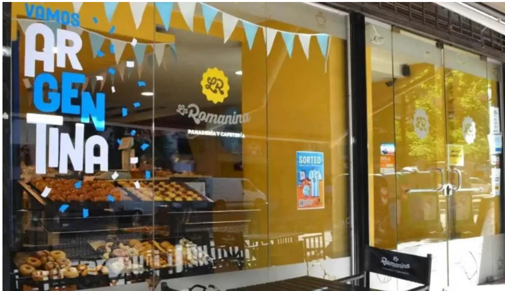
La romanina panaderia y cafeteria del propietario