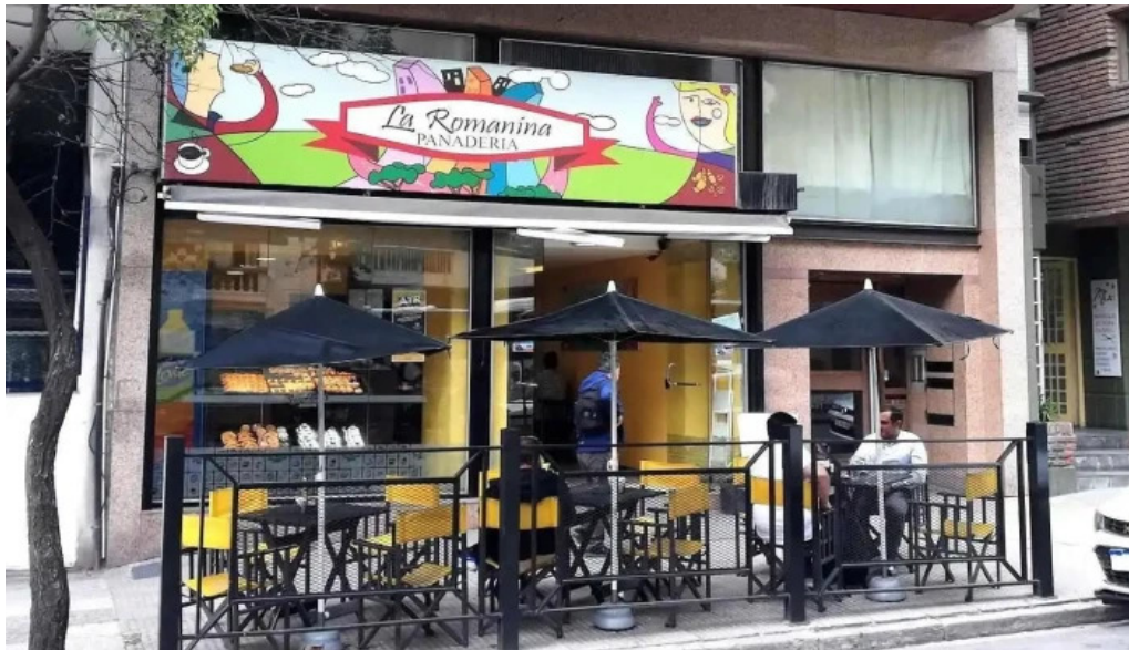
La romanina – panaderia y cafeteria x5000jgo