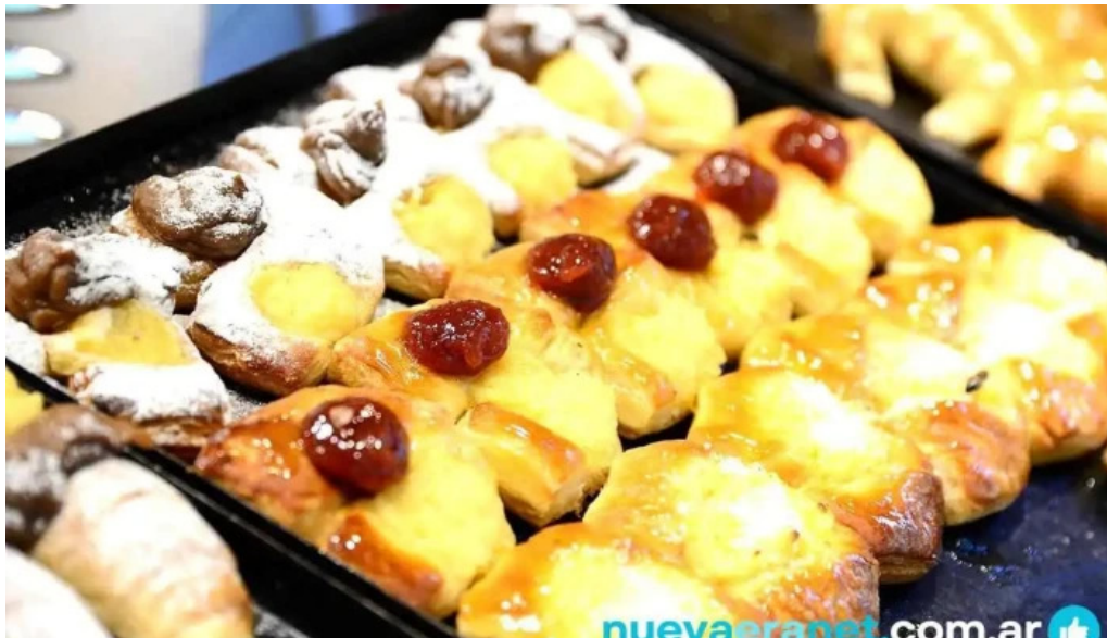
La romanina panaderia y cafeteria comida y bebida