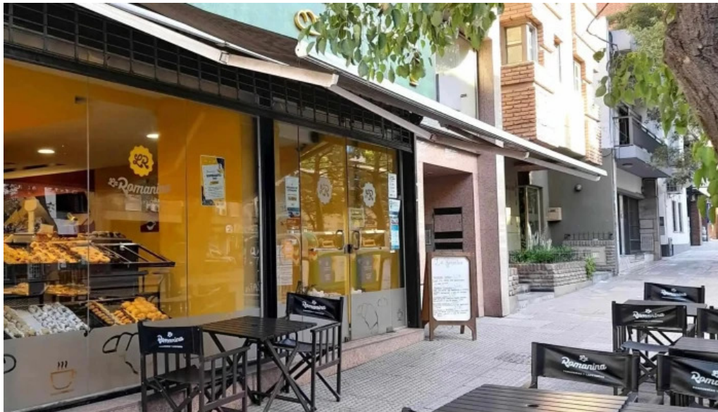
La romanina panaderia y cafeteria ambiente