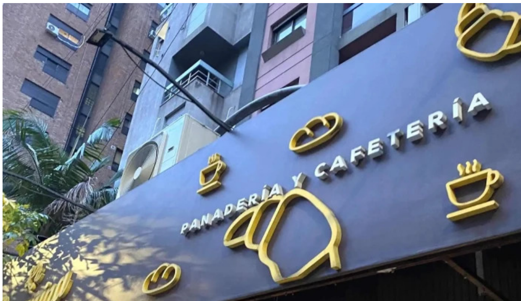
La romanina panaderia y cafeteria x5000jgo