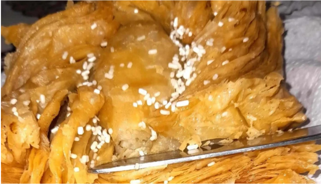
Panificadora el globo x5000jgc