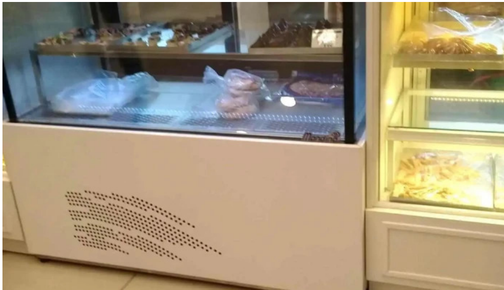
Panificadora el globo ambiente