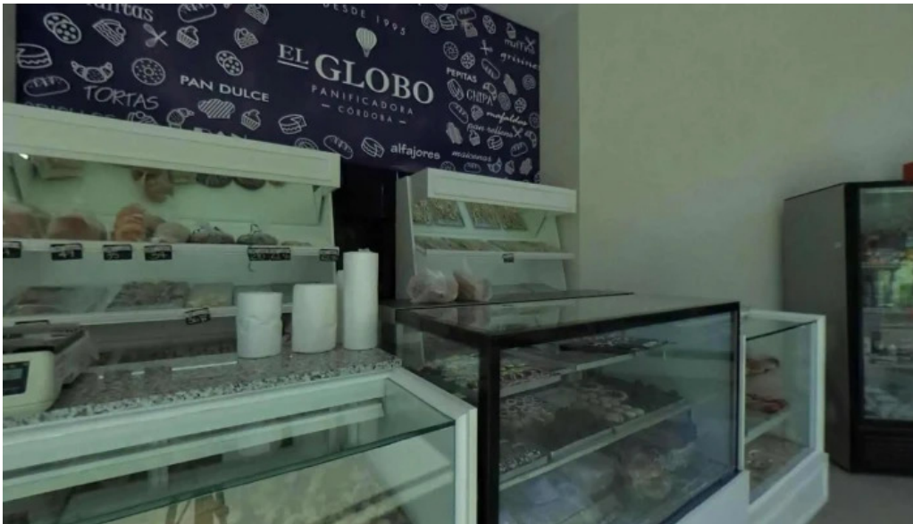
Panificadora el globo vitrina