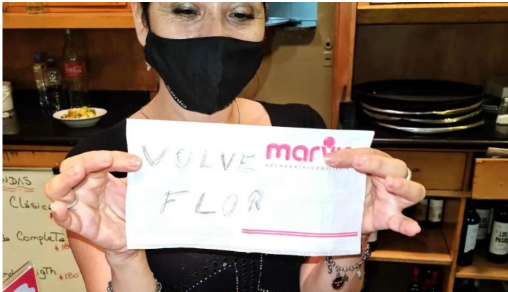
Panificadora el globo comentarios