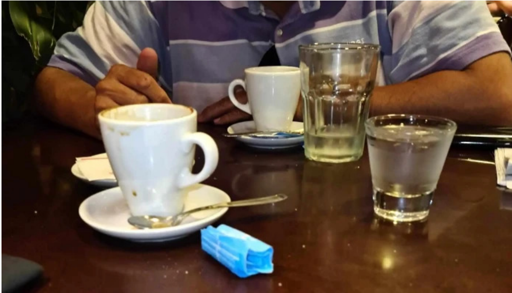
Panificadora el globo telefono