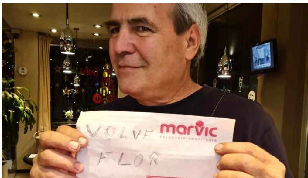
Panificadora el globo abierto ahora