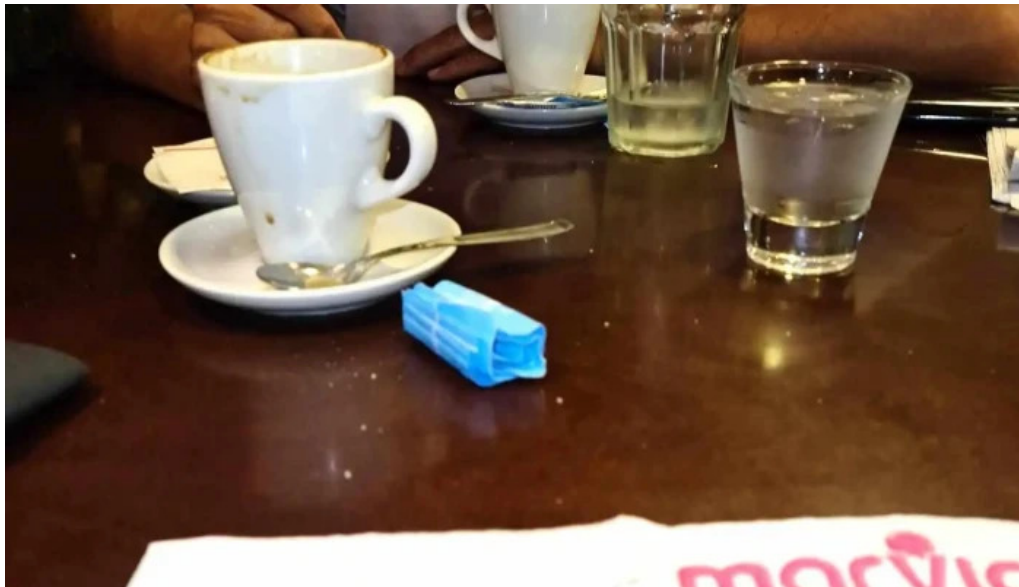
Panificadora el globo comida y bebida