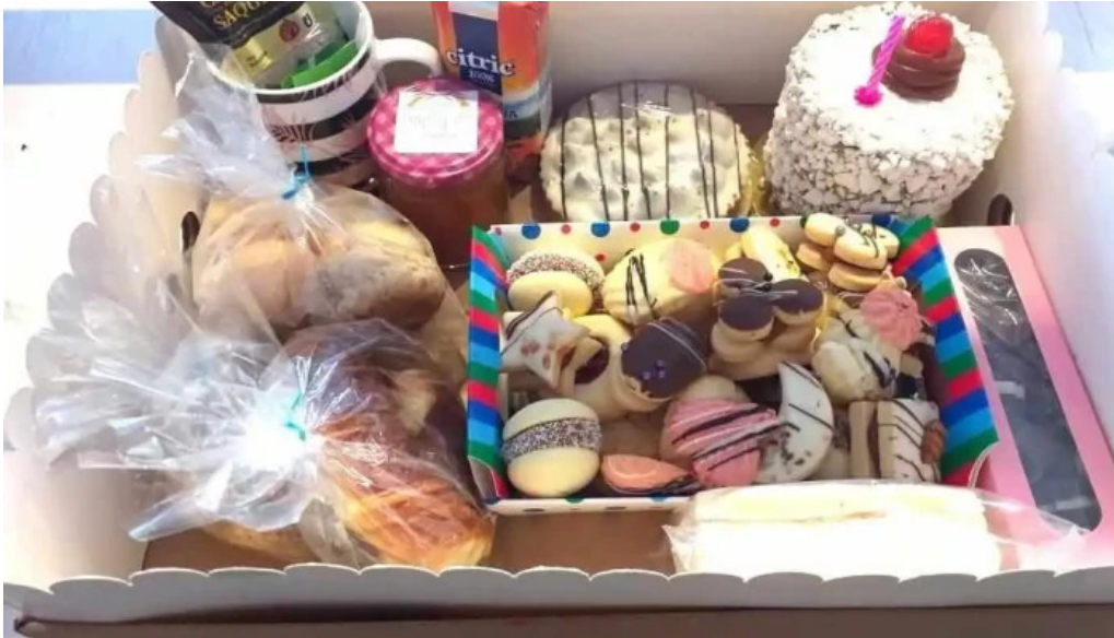
Panaderia y confiteria la paulina pastel