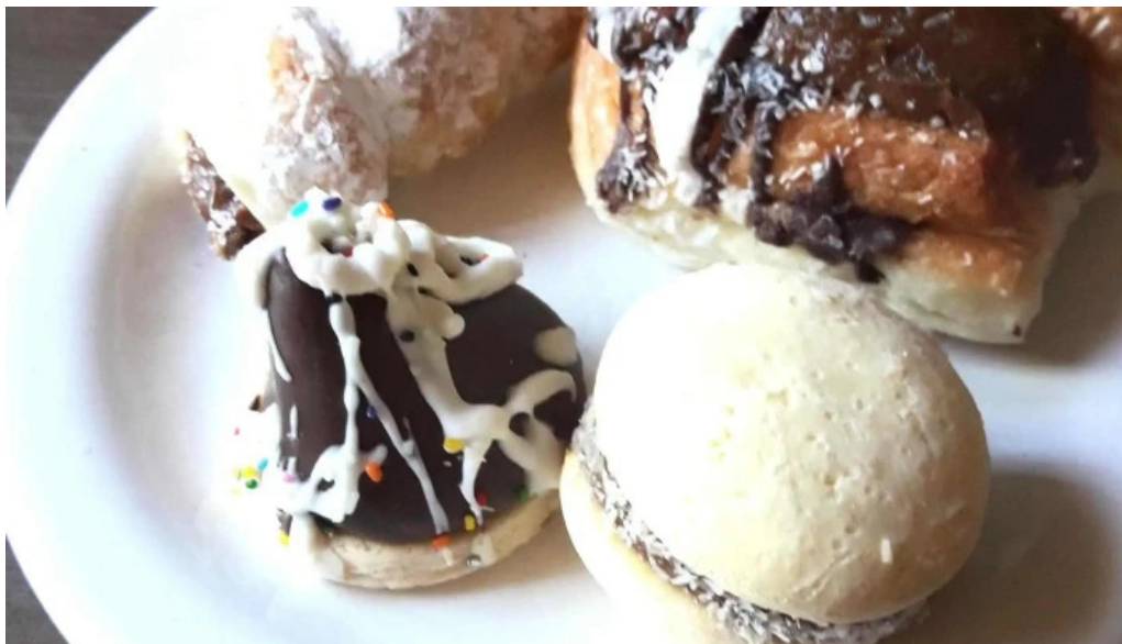
Panaderia y confiteria la paulina santa rosa