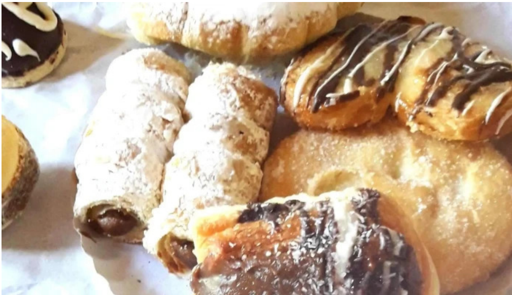
Panaderia y confiteria la paulina catalogo