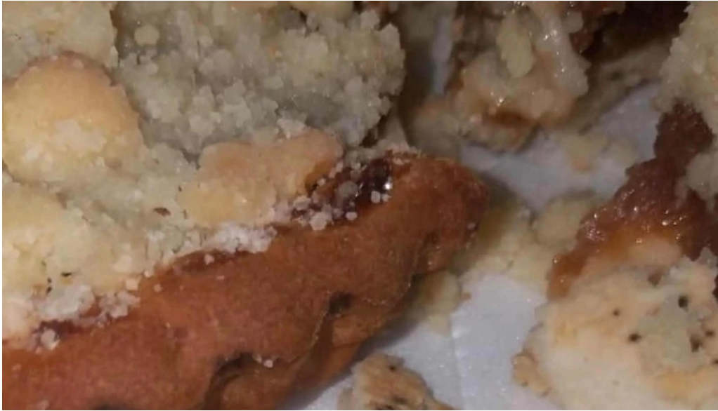
Panaderia y confiteria la paulina donde