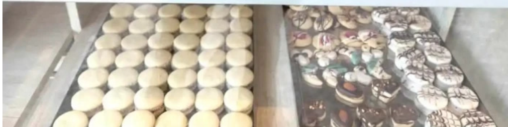
Panaderia y confiteria la paulina vitrina