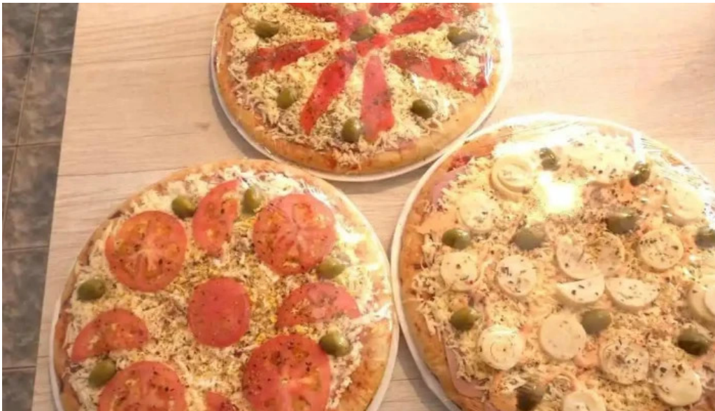
Panaderia y confiteria la paulina del propietario