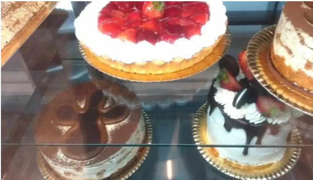
Panaderia y confiteria la paulina comida y bebida