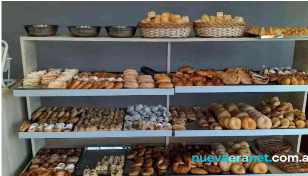
Panadería y confitería la paulina ambiente