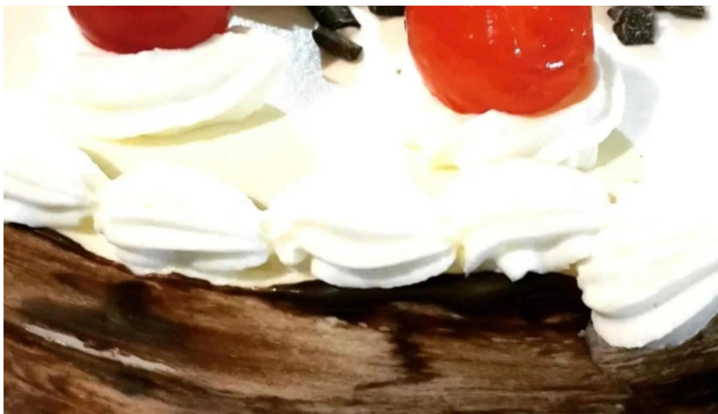
Panaderia el mundo pastel