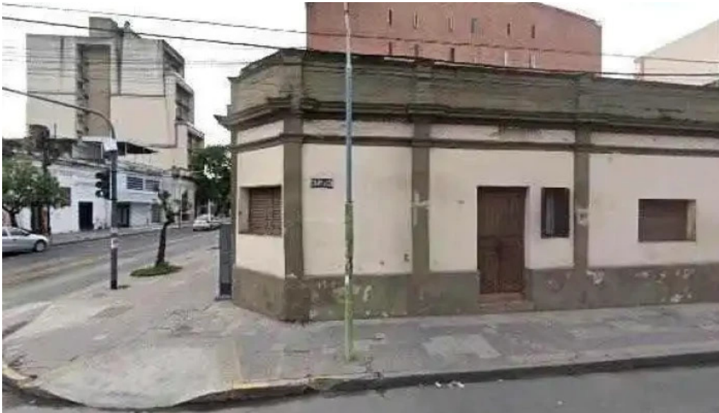
Panaderia el mundo telefono