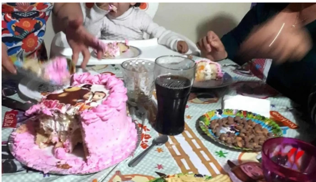
Panaderia el mundo comida y bebida