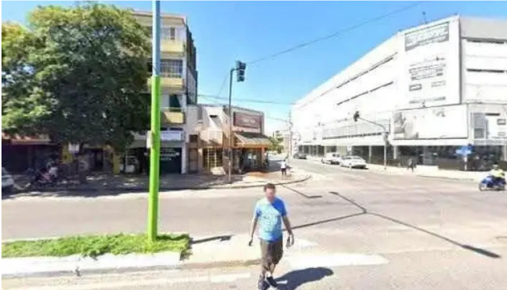
La espiga de oro abierto ahora