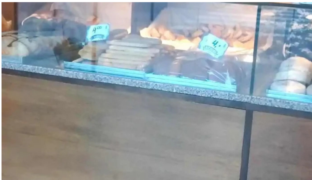
La espiga de oro ambiente