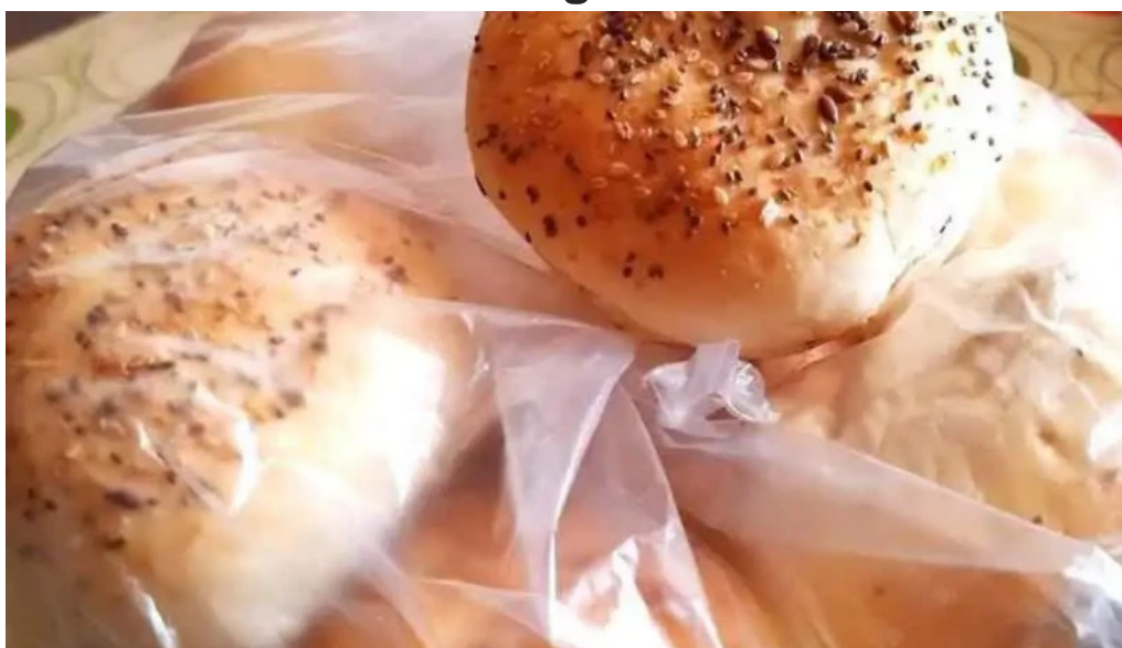
El mejor integral tucuman san miguel de tucuman