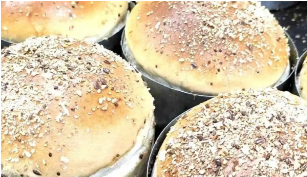
El mejor integral tucuman comida y bebida