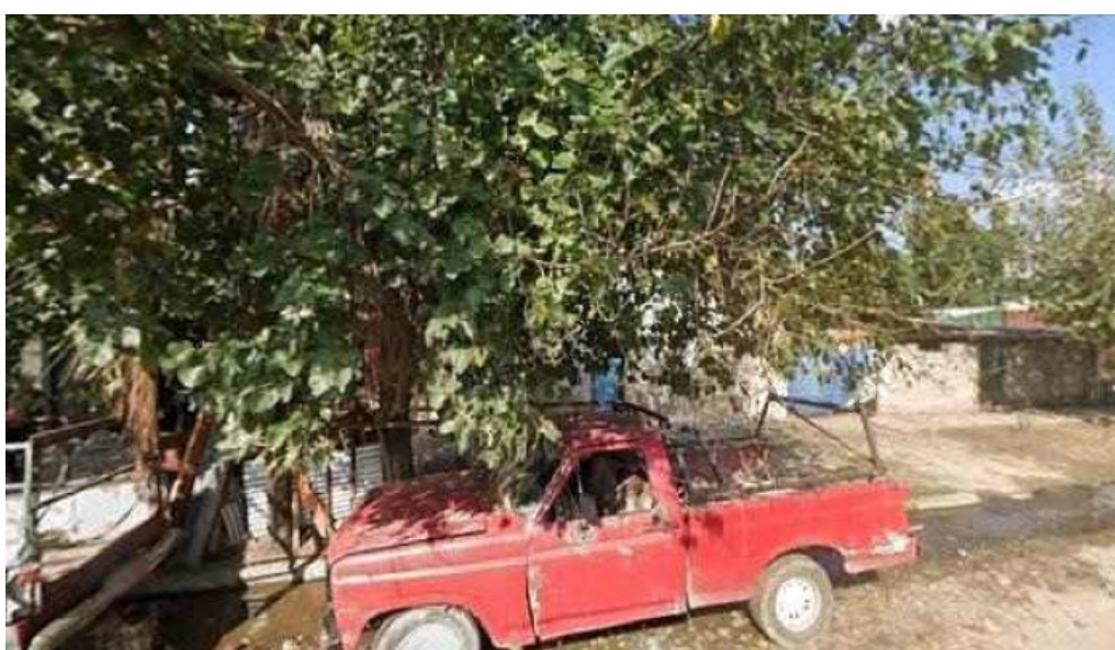
El mejor integral tucuman numero