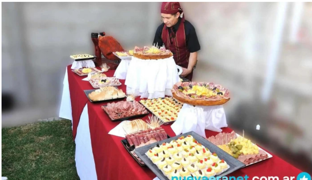
Tia olga panaderia comida y bebida