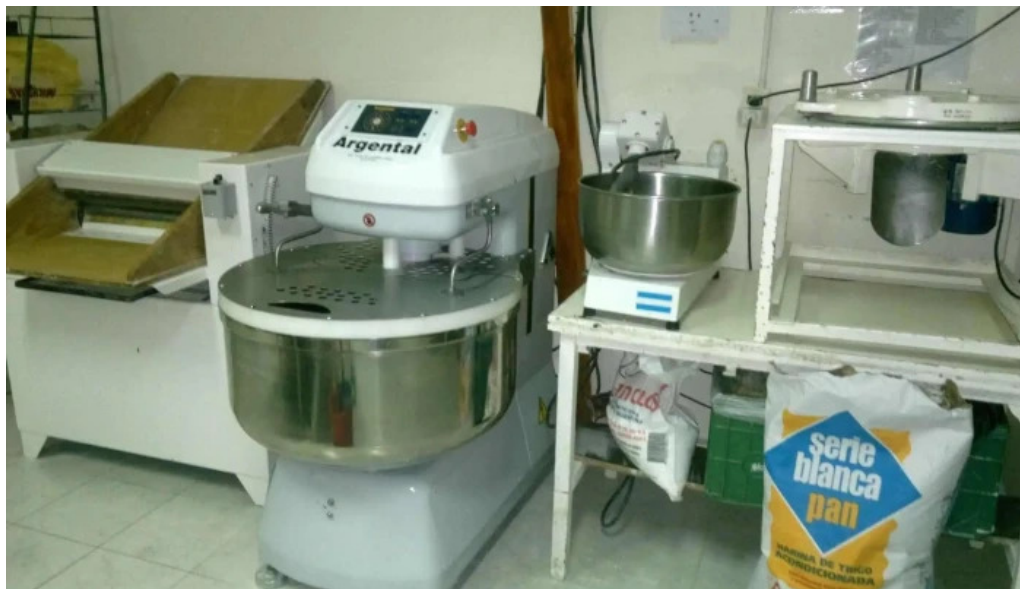
Tia olga panaderia del propietario