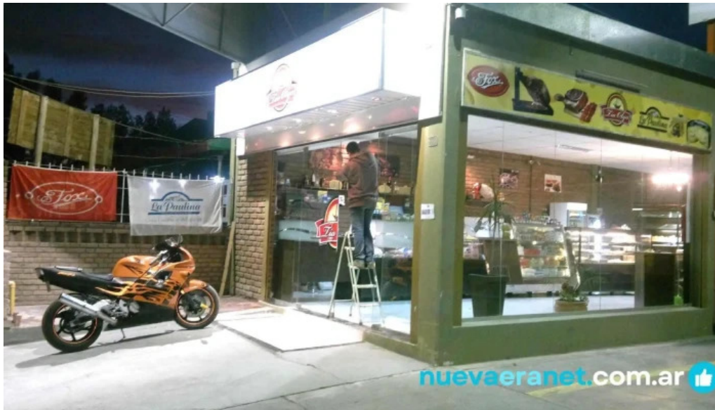
Tia olga panaderia como llegar