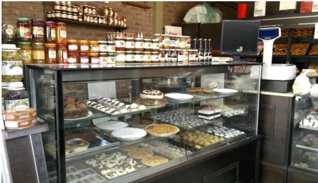
Tia olga panaderia ambiente