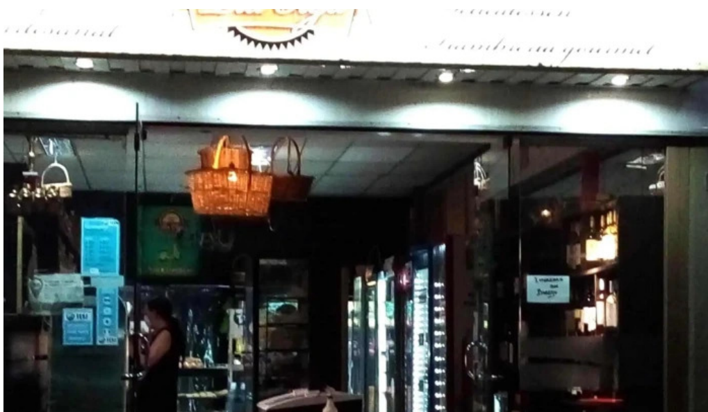
Tia olga panaderia rivadavia