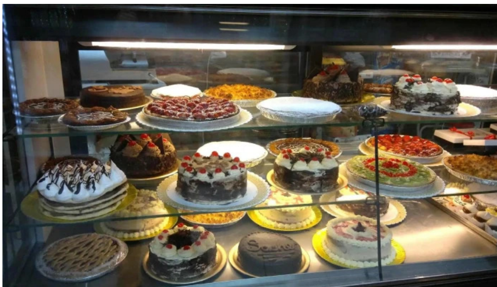
Tia olga panaderia pastel