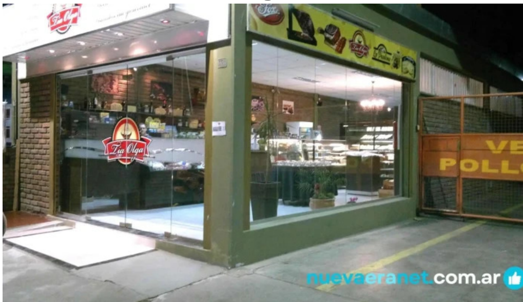
Tia olga panaderia vitrina