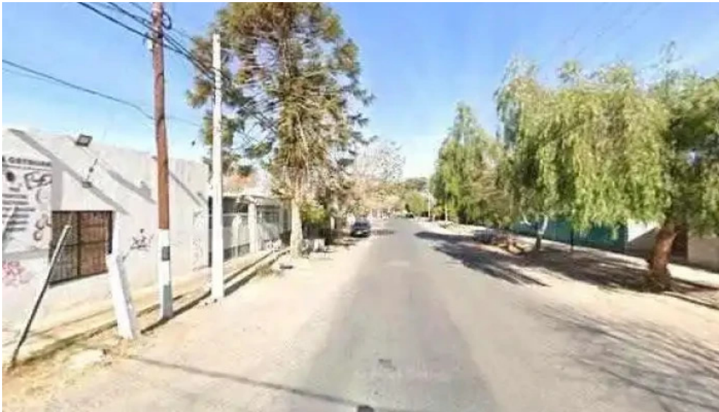
Panaderia artesanal y minimarket dulce catalina sitio webdeg