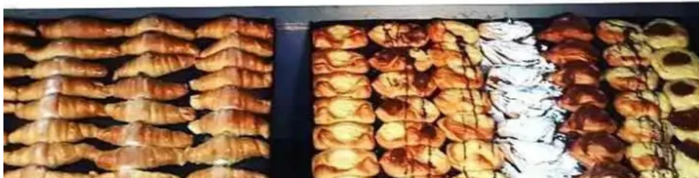
Panadería artesanal y minimarket dulce catalina comida y bebida