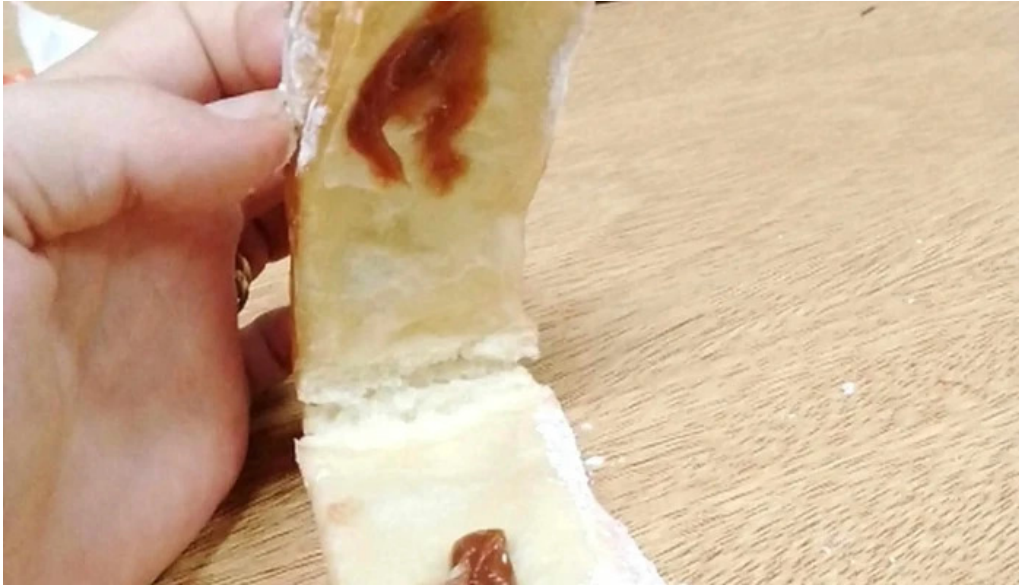
Panaderia san roque direccion