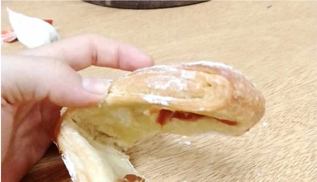
Panadería san roque cerca de mi