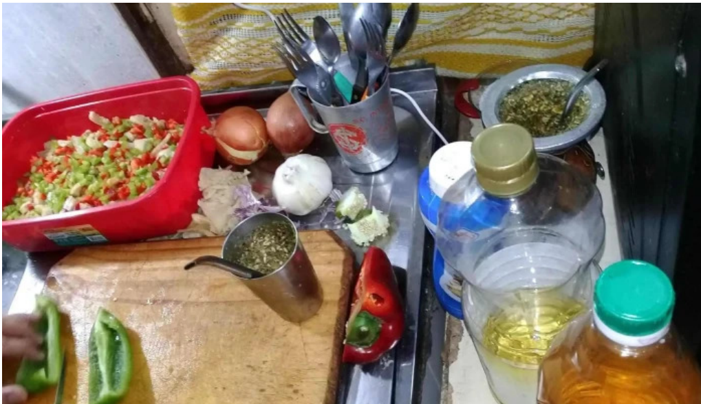
Panaderia san roque comida y bebida