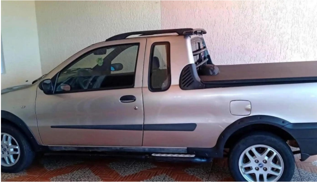
Panaderia san roque videos