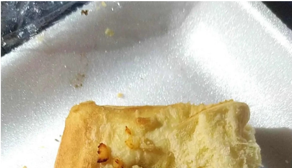
Panaderia san roque puntaje