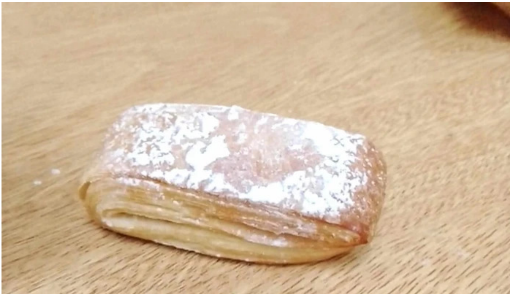
Panaderia san roque puerto iguazu