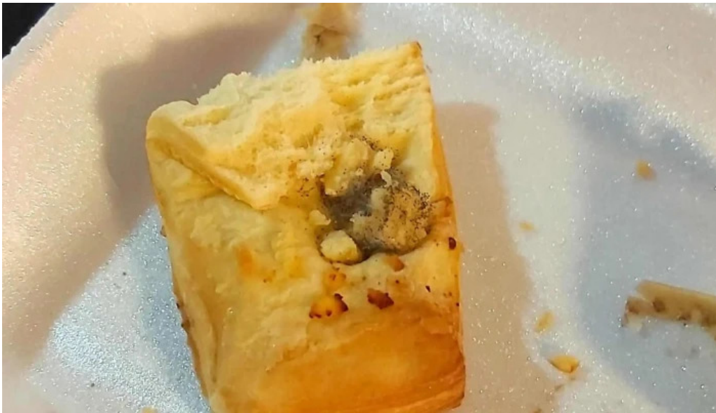
Panaderia san roque fotos