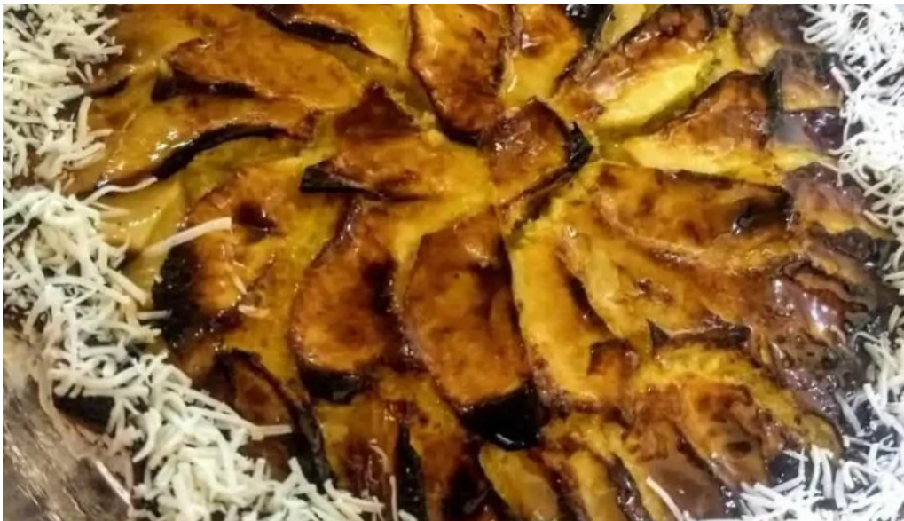
Panaderia san roque pastel