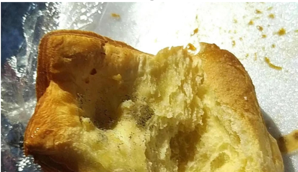
Panaderia san roque zona