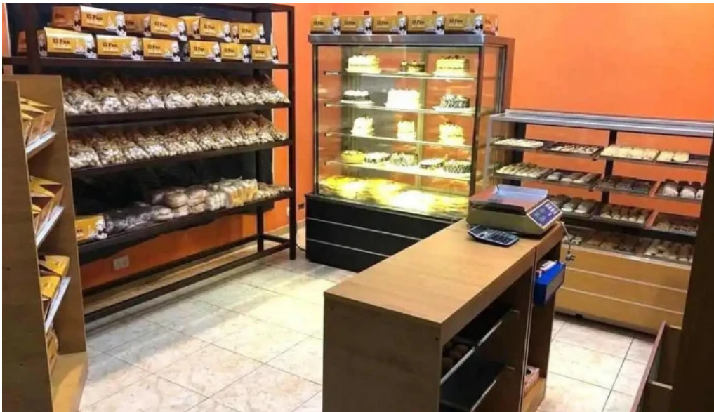
El pan de la abuela ambiente