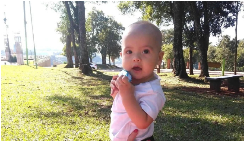
El pan de la abuela puerto iguazu