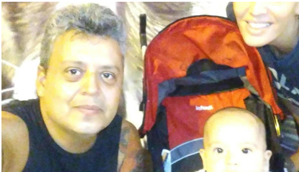
El pan de la abuela instagram