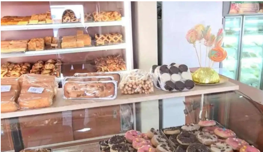
Mana panificados vitrina