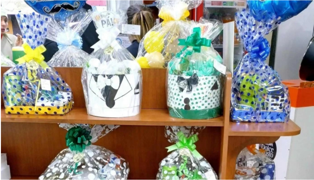
Mana panificados como llegar