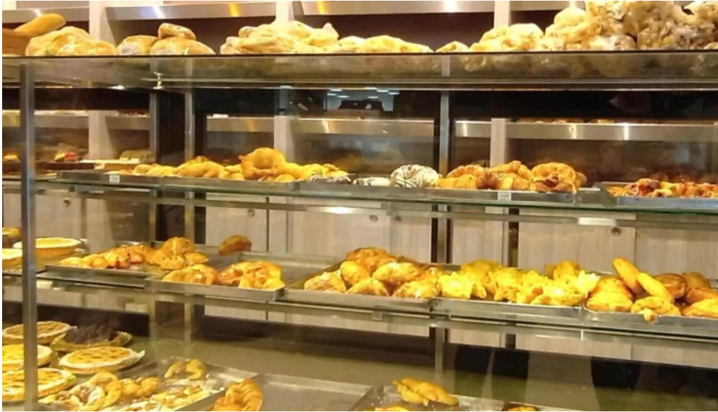
Mana panificados posadas