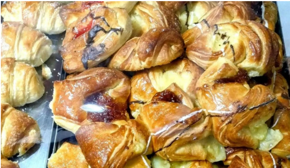
Mana panificados cerca de mi