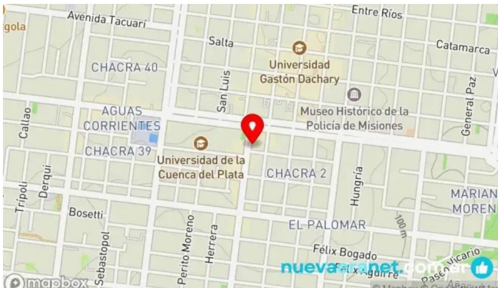
Mana panificados mapa