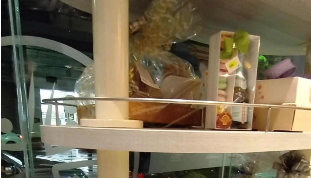
Mana panificados videos