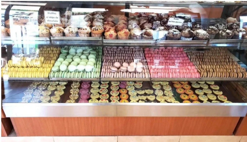
Mana panificados ambiente