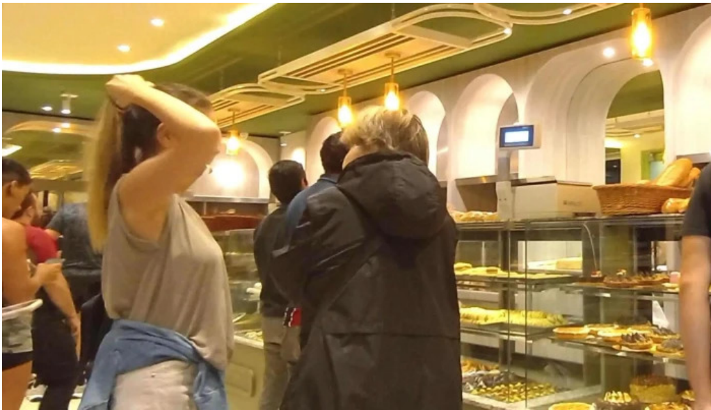
Mana panificados puntaje