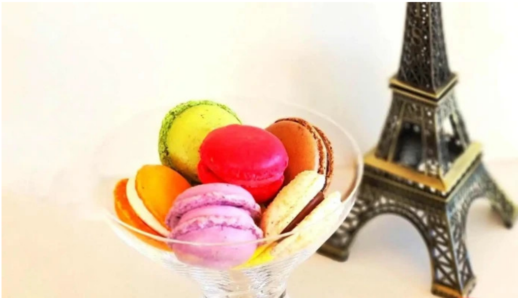
Mana panificados comida y bebida