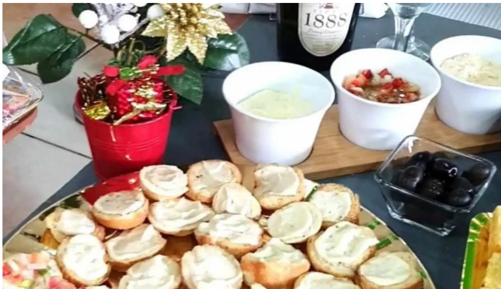
Mana panificados del propietario