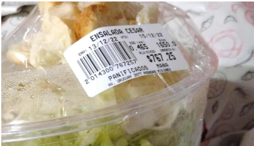
Mana panificados abierto ahora