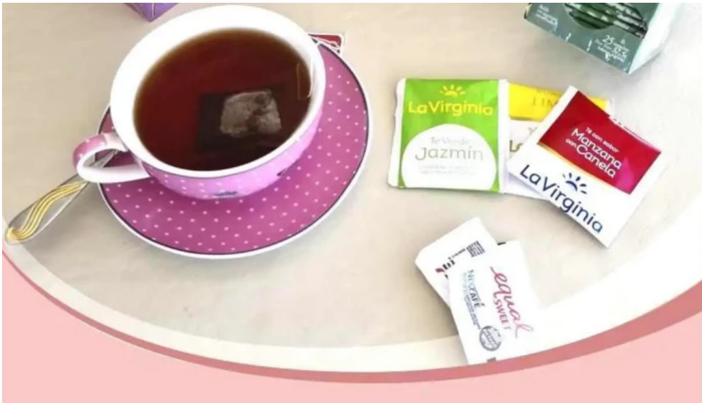
Mana panificados menu