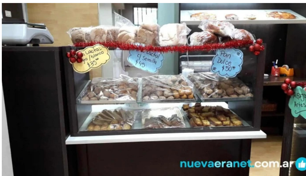
Panaderia la primavera ambiente