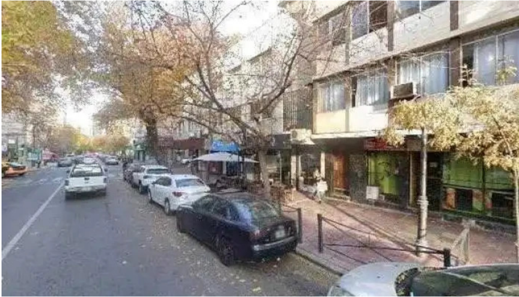
Panaderia la primavera cerca de mideg