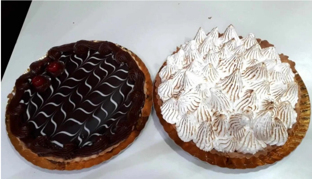
Panaderia la primavera pastel