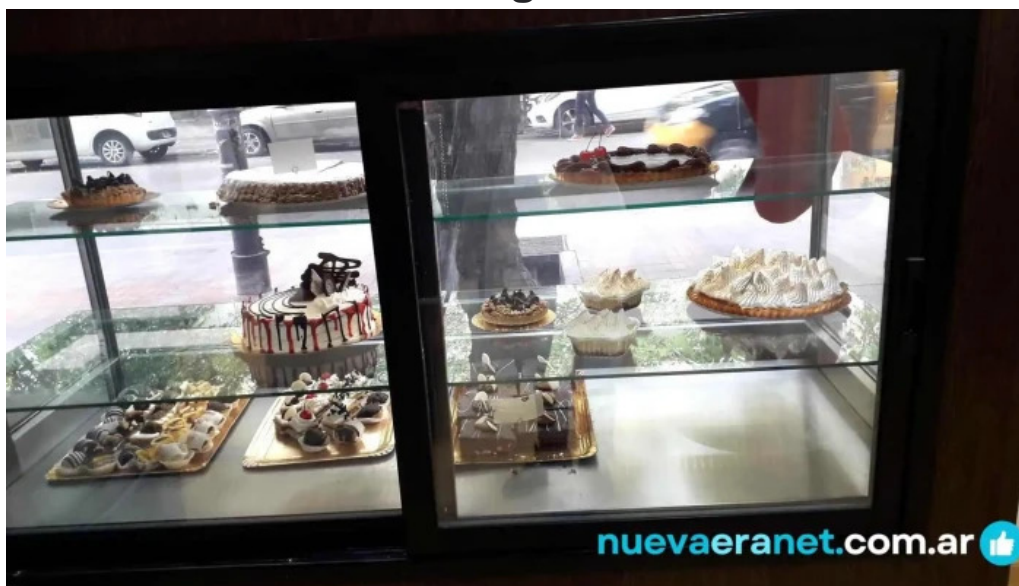
Panaderia la primavera vitrina