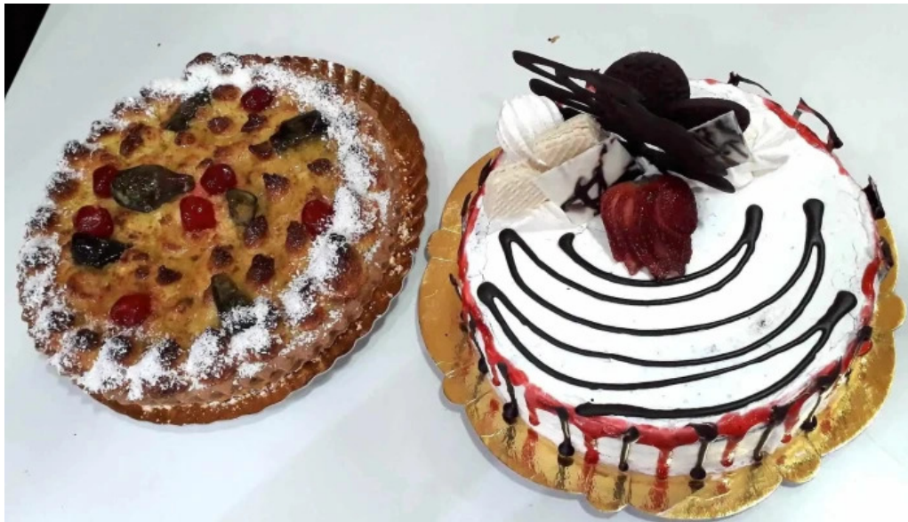
Panaderia la primavera comida y bebida