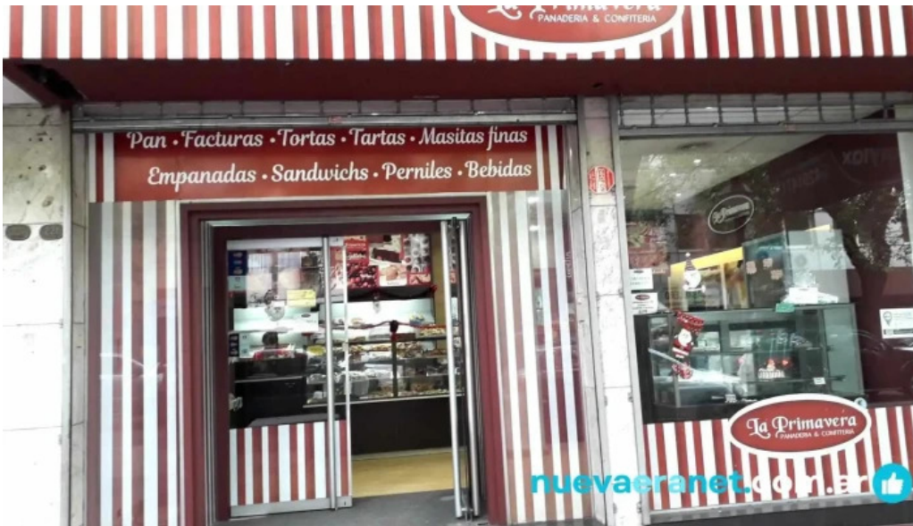
Panaderia la primavera cerca de mi