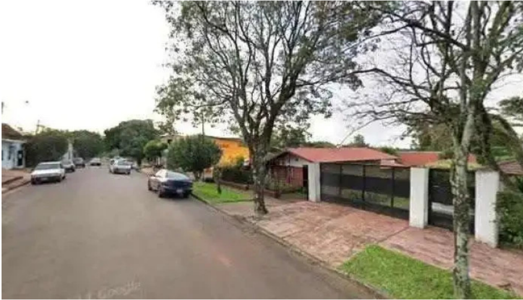
Panaderia el canon 2 horario