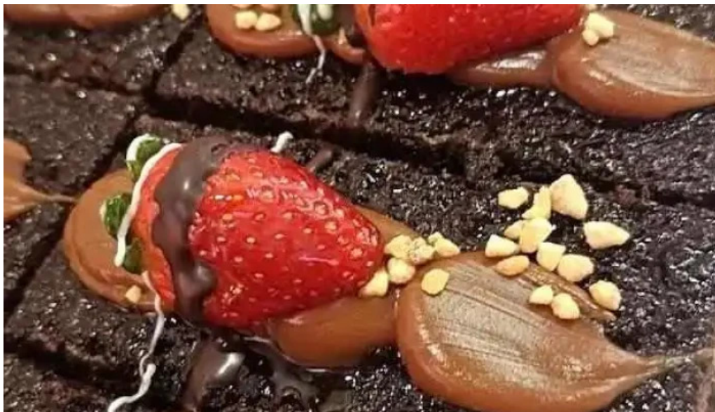
Panaderia el canon 2 leandro n alem