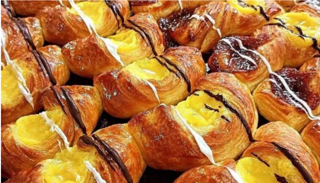
Panadería el canon 2 comida y bebida