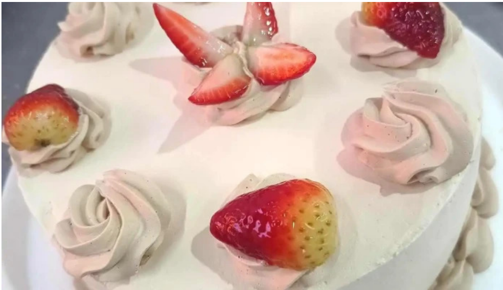
Panaderia el canon 2 del propietario