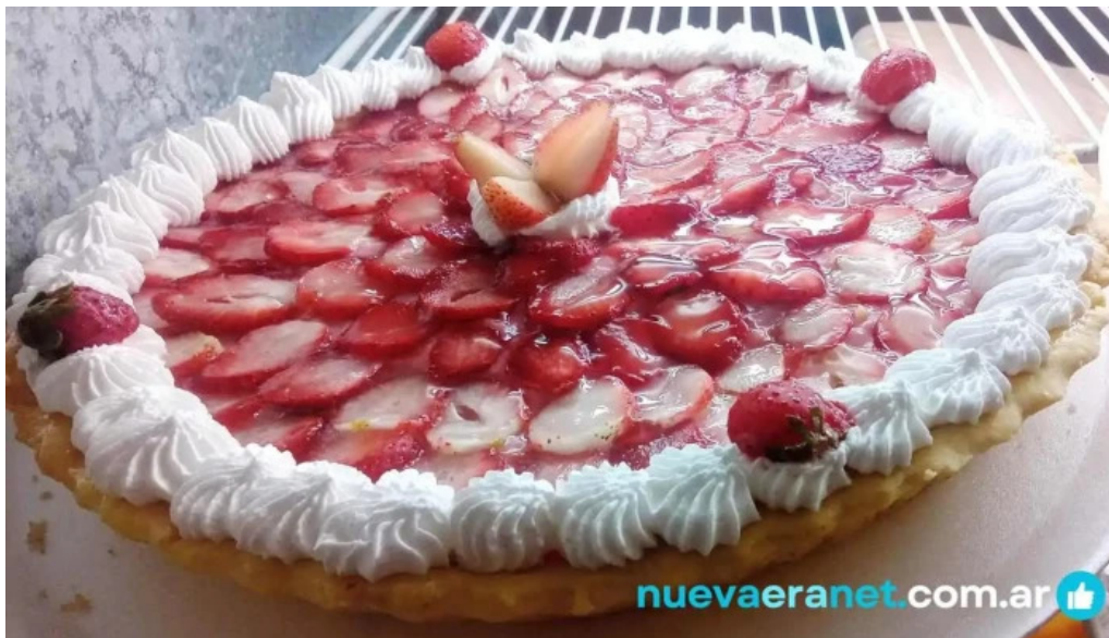
Panaderia el canon 2 pastel