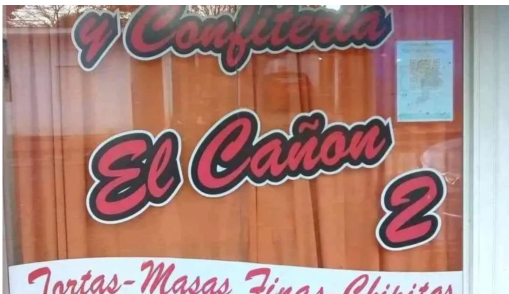
Panaderia el canon 2 mas recientes