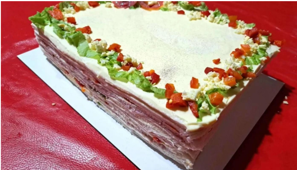
Don fernando del propietario