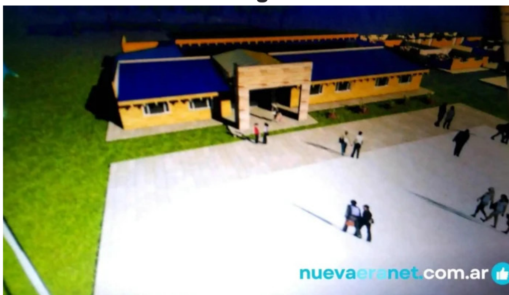
Don fernando videos