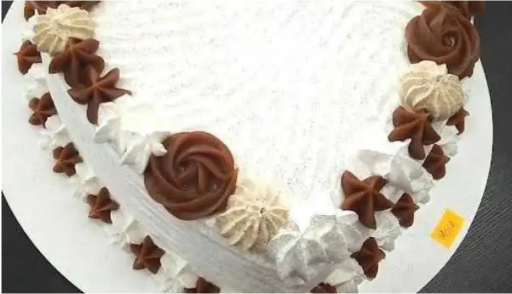
Don fernando leandro n alem