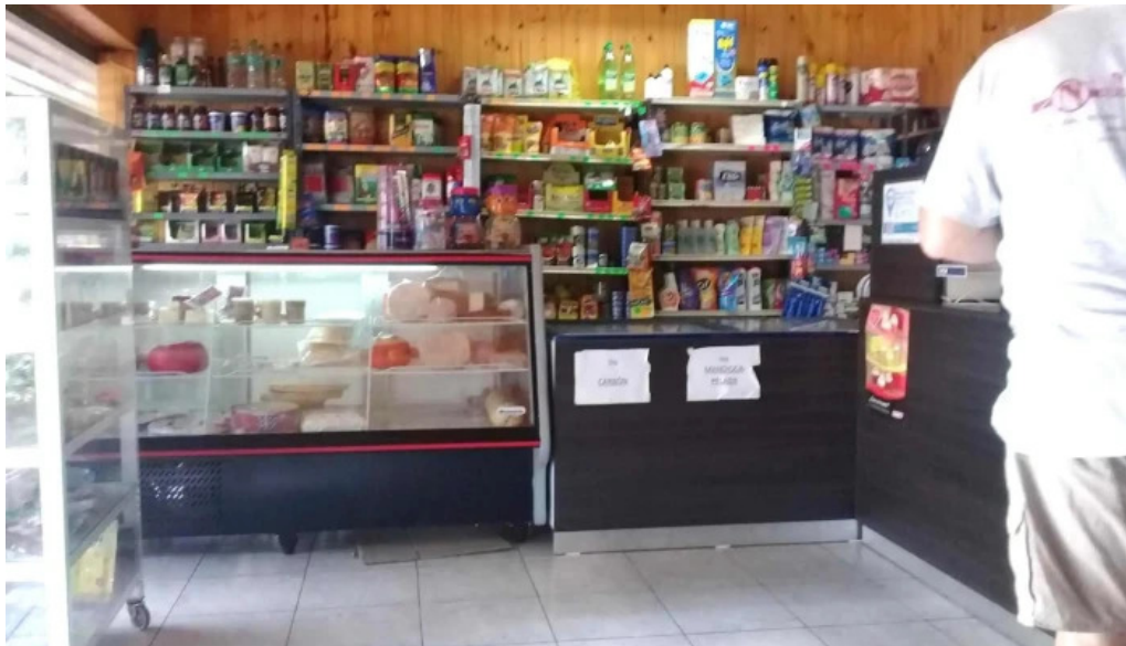
Don fernando ambiente