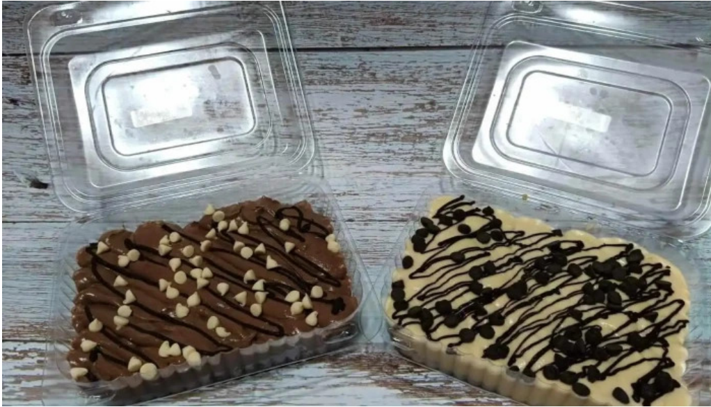
Don fernando comida y bebida