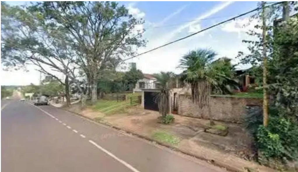
Don fernando comentarios