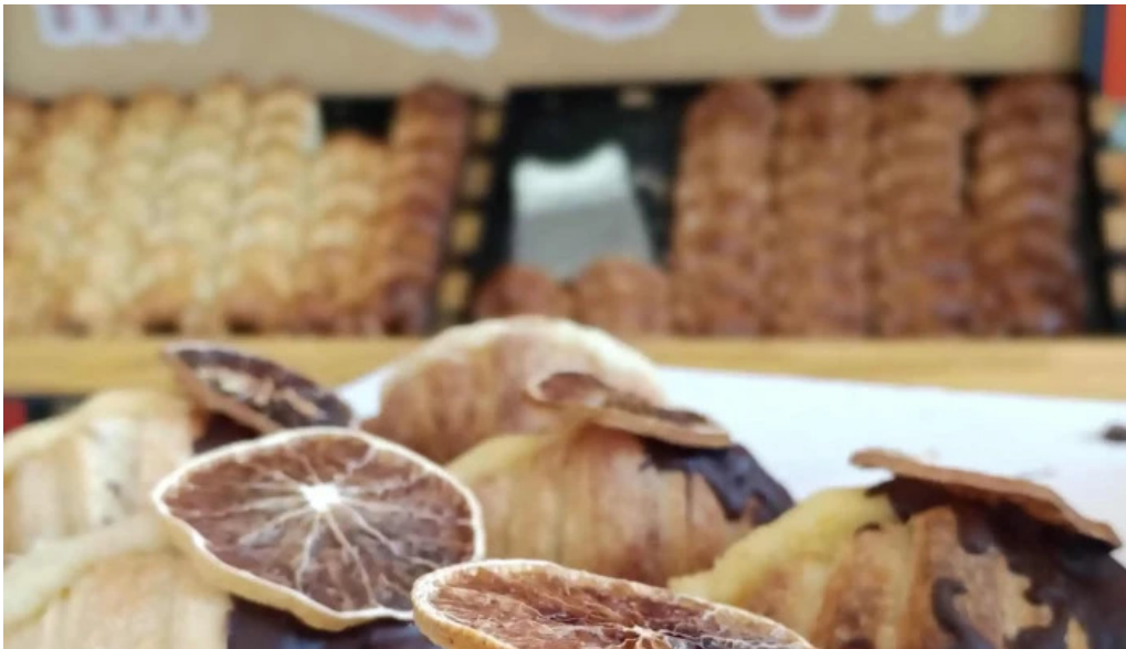
Carlina panaderia direccion