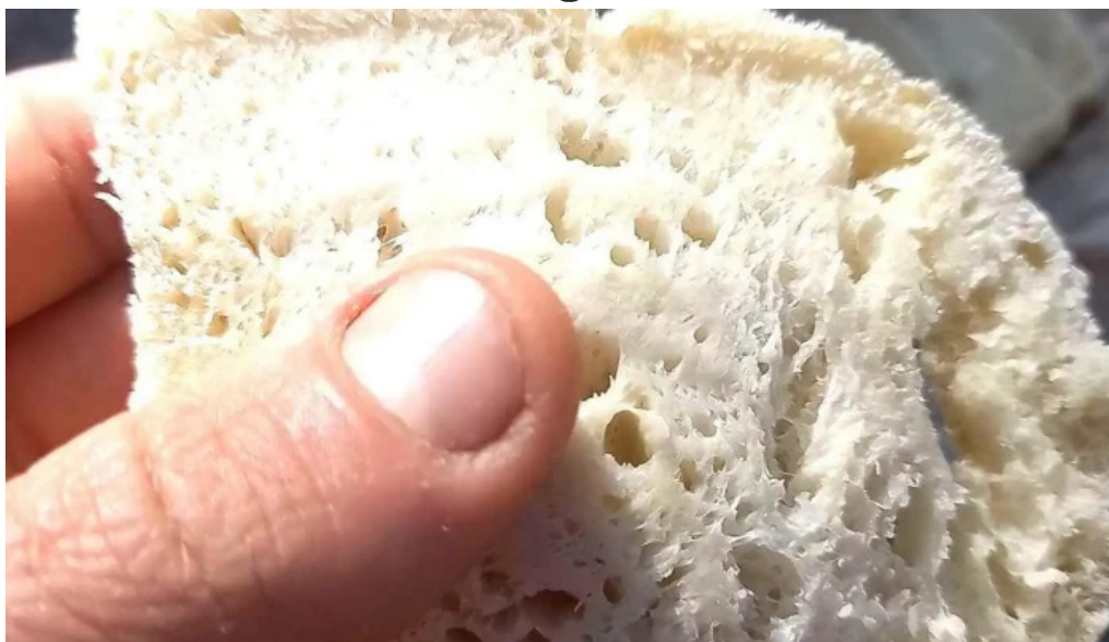
Carlina panaderia videos