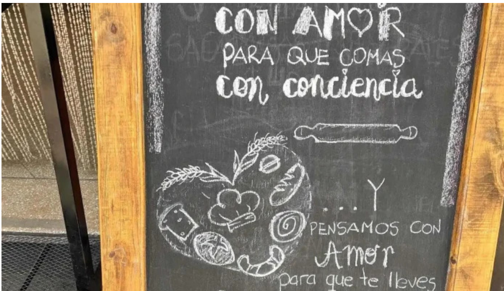
Carlina panaderia carta