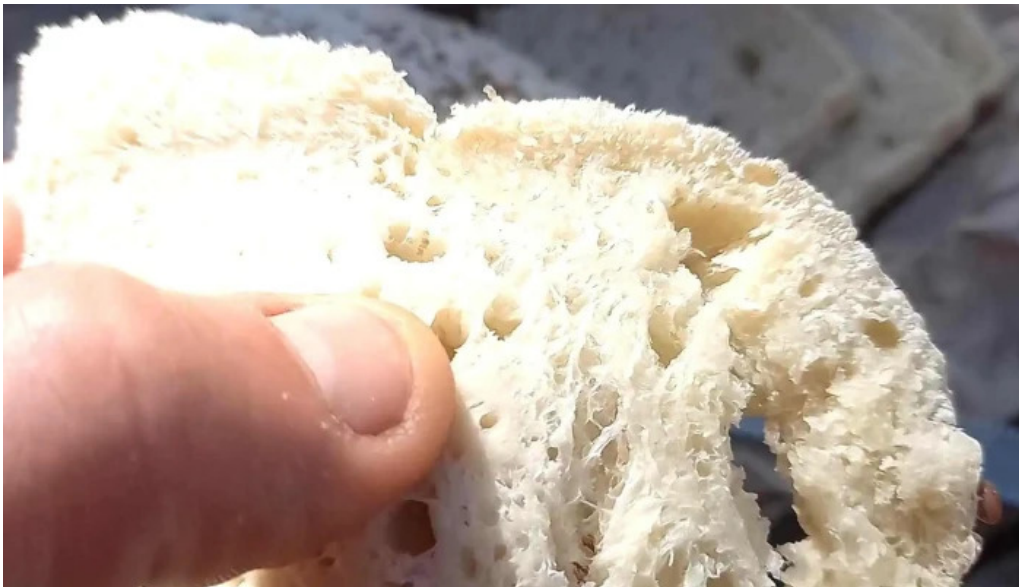
Carlina panaderia la falda