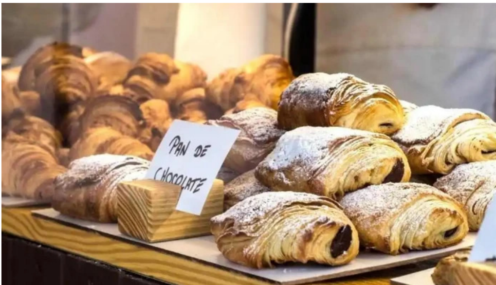
Carlina panaderia croissant