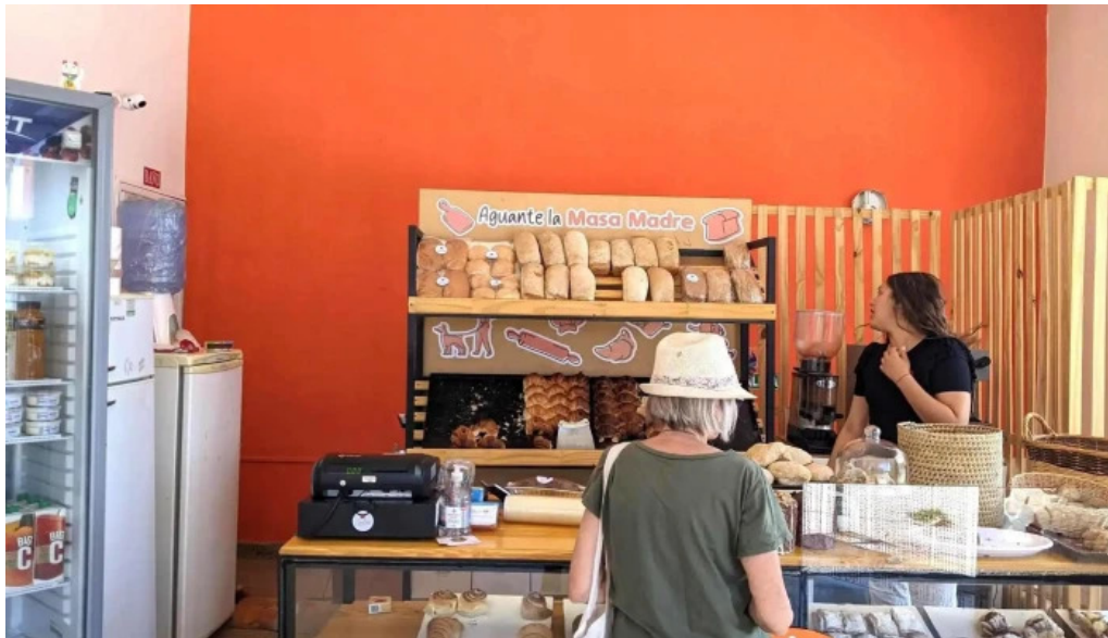
Carlina panadería ambiente