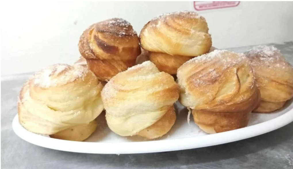
Carlina panaderia comida y bebida