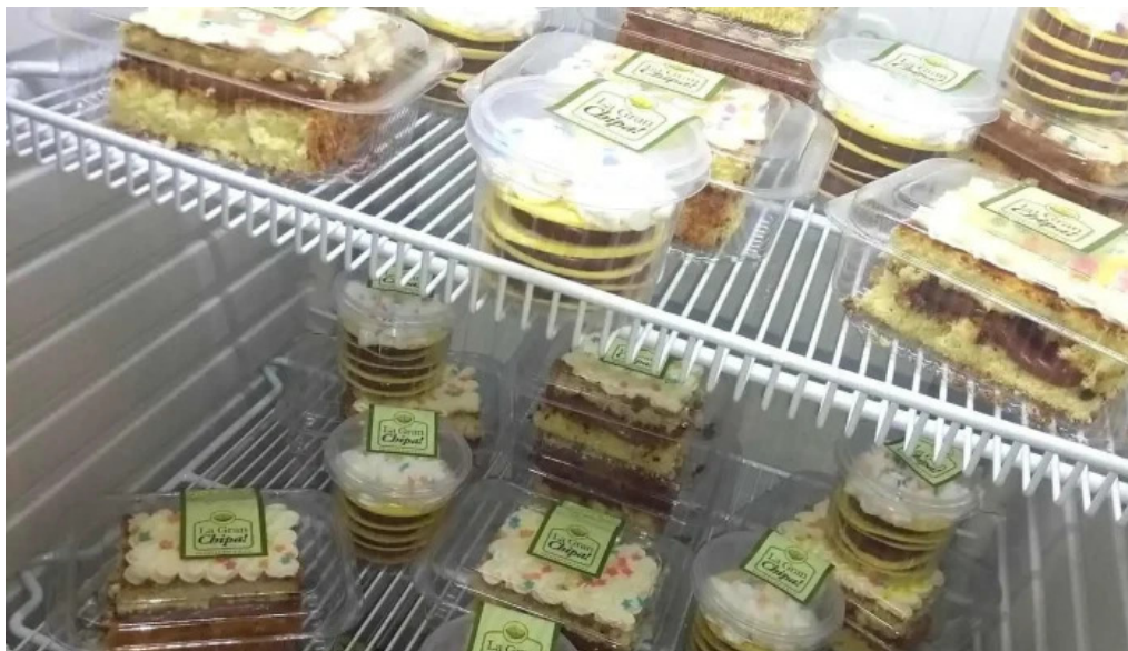
La gran chipa ambiente