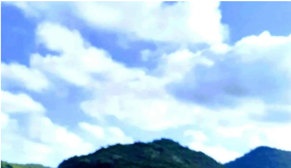
La gran chipa telefono