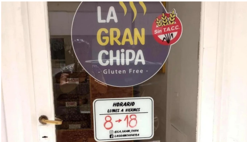
La gran chipa comentarios