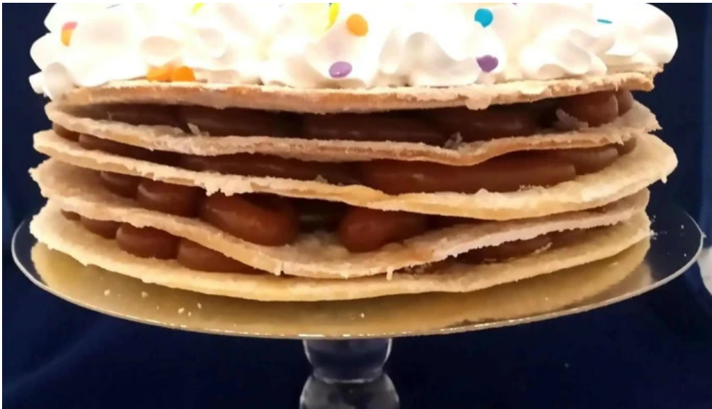
La gran chipa comida y bebida