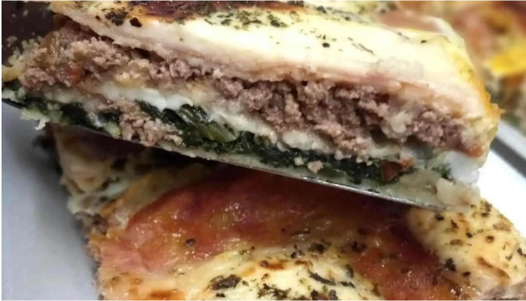
La gran chipa del propietario