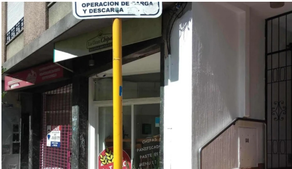
La gran chipa jza