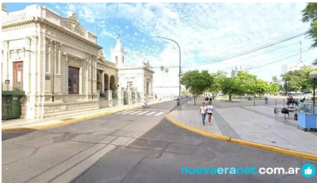
Panaderia los nietos cruz de los milagros