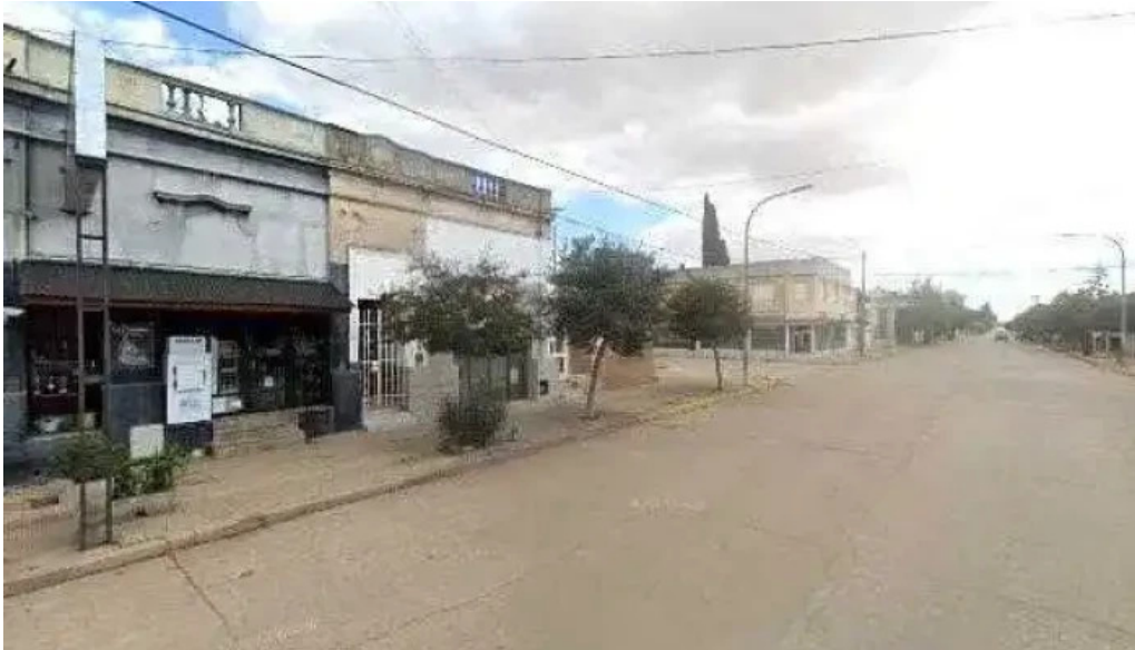
La parissima panes dulces ubicacion