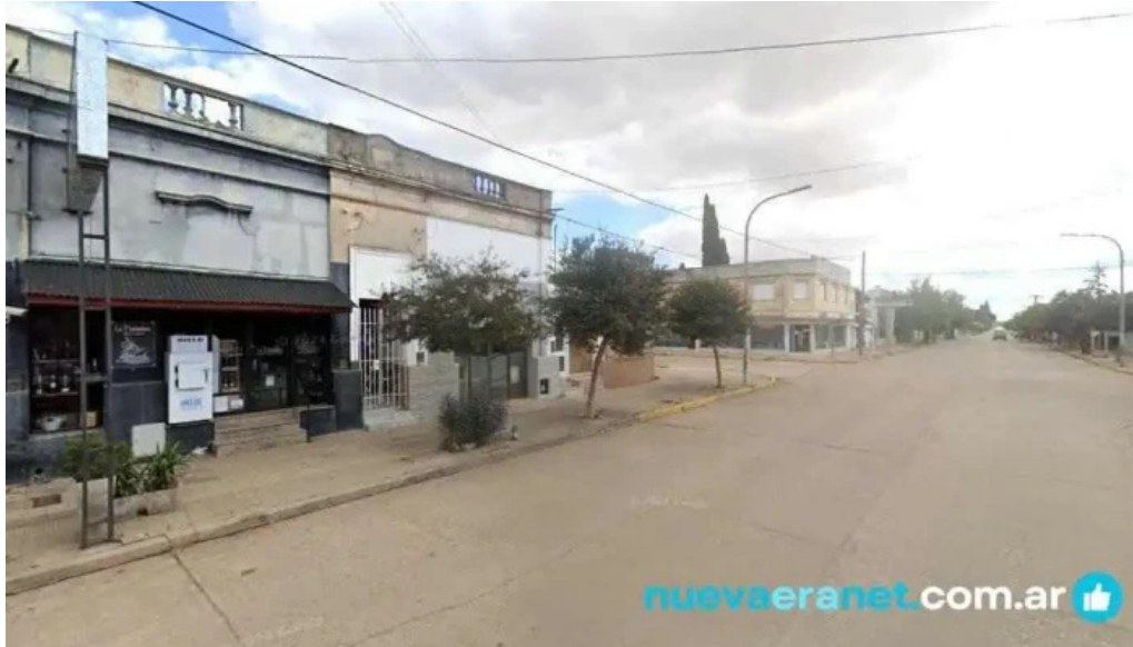
La parissima panes dulces cruz alta