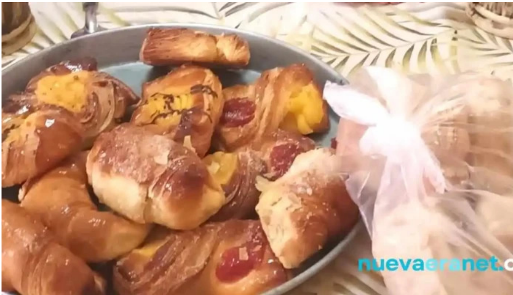
Panaderia y pasteleria la moderna comida y bebida