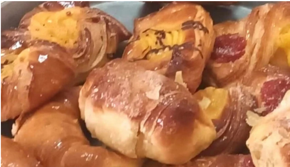
Panaderia y pasteleria la moderna cosquin