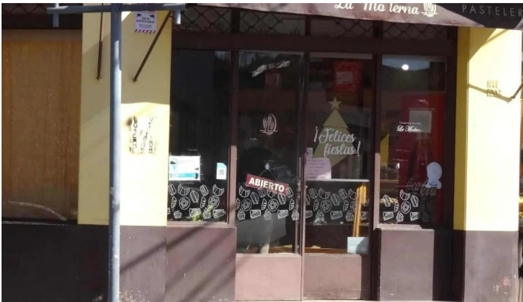
Panaderia y pasteleria la moderna cerca de mi