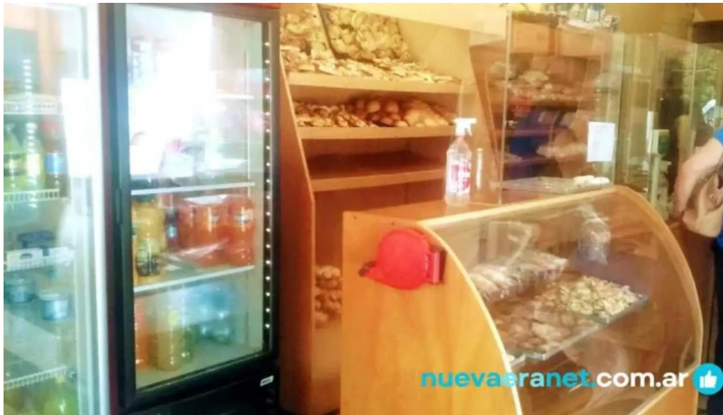
Panadería y pastelería la moderna ambiente