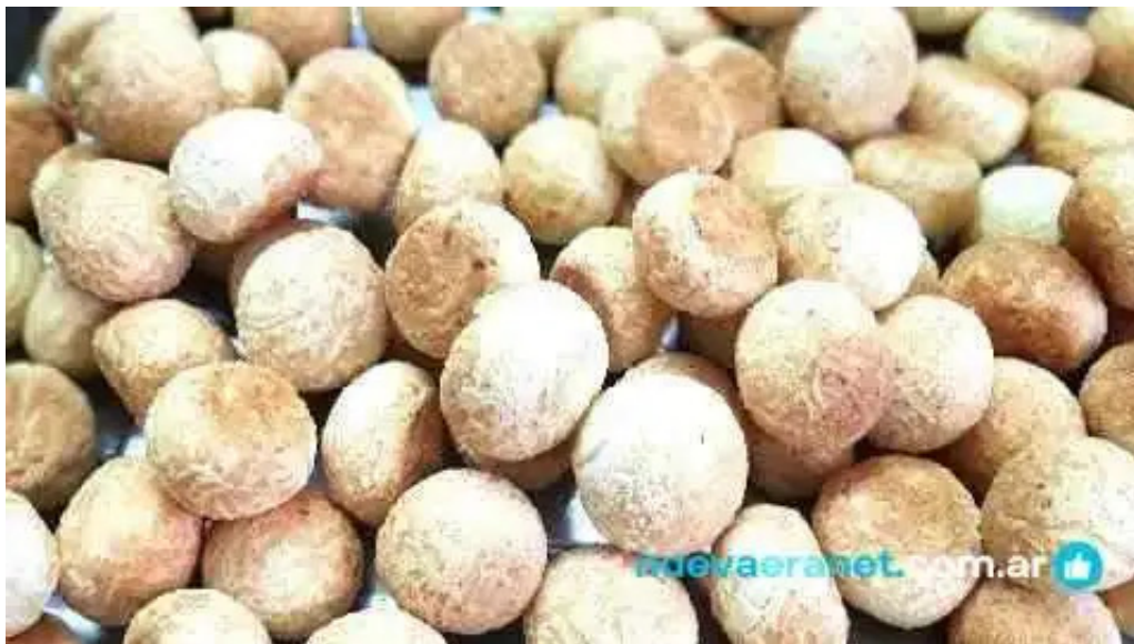
Yoana chipacitos donde