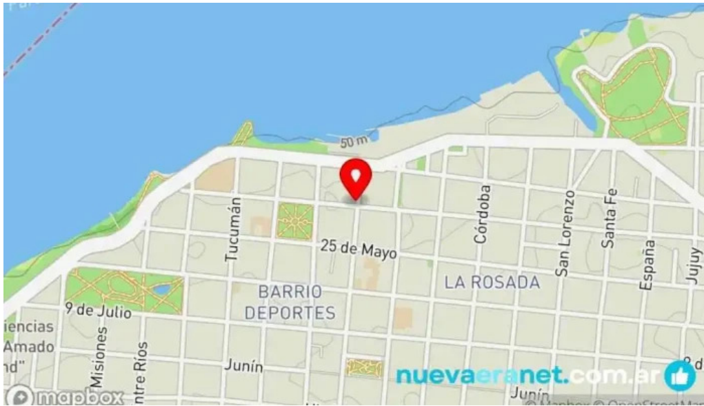
Yoana chipacitos mapa