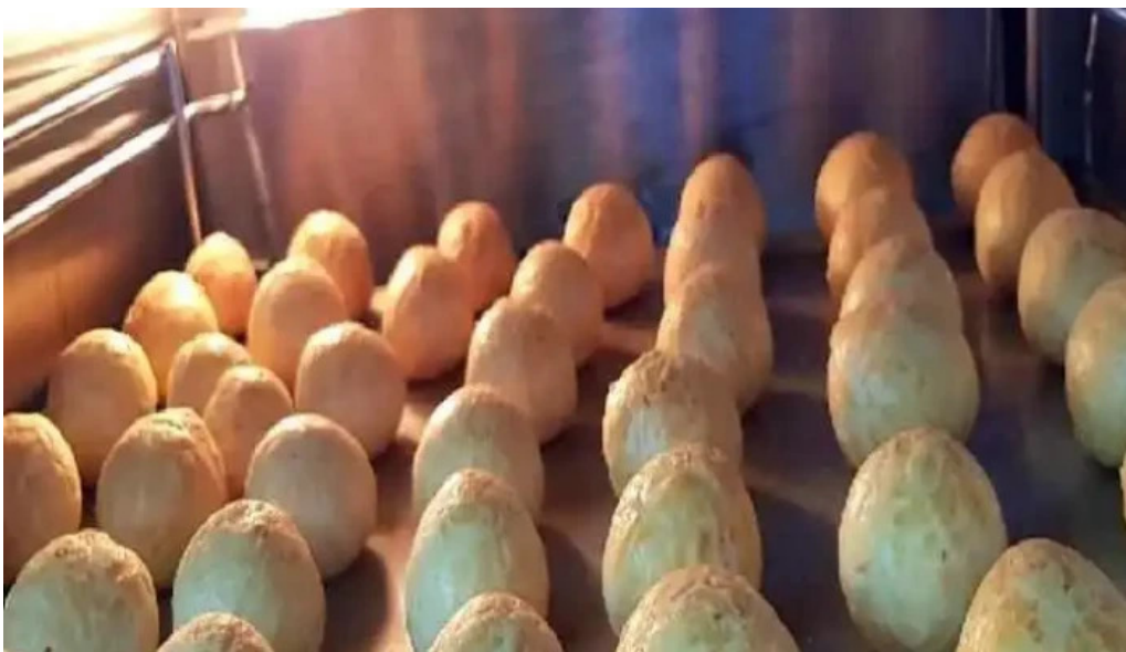
Yoana chipacitos comida y bebida