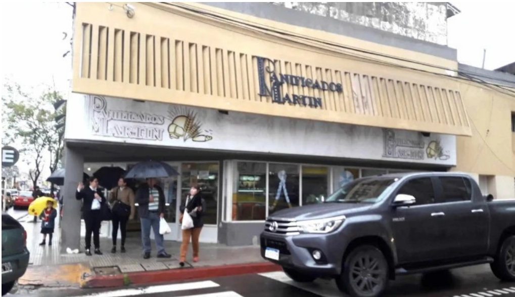
Panificados martin numero