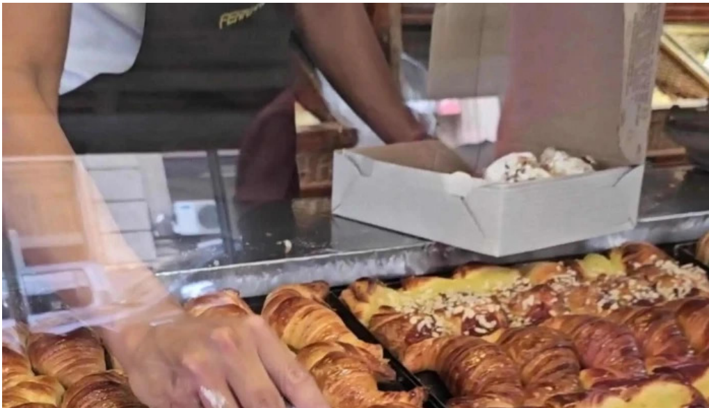
Panificados martin corrientes