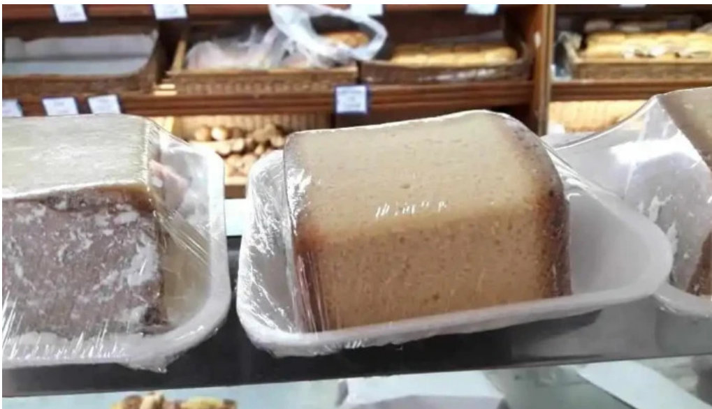
Panificados martin comida y bebida