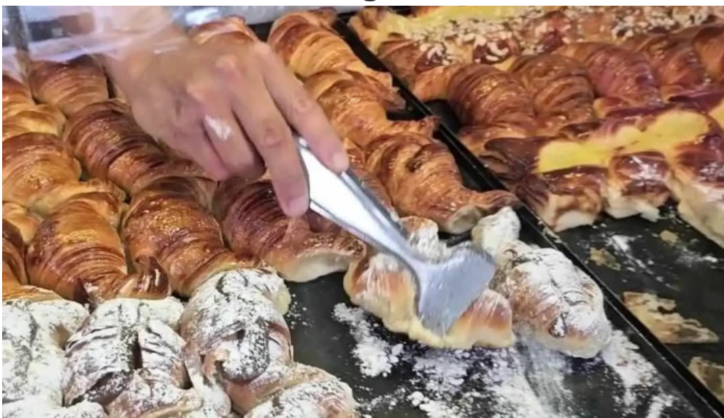
Panificados martin videos