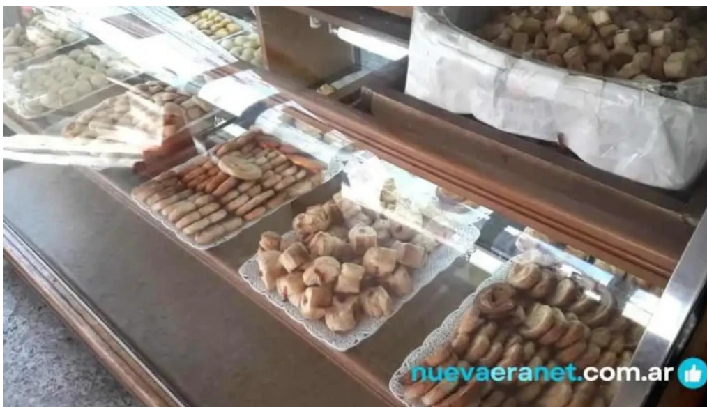
Panificados martin ambiente