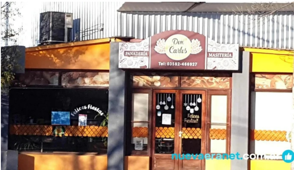
Panaderia y masiteria don carlos donde