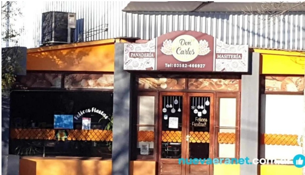
Panaderia y masiteria don carlos coronel moldes