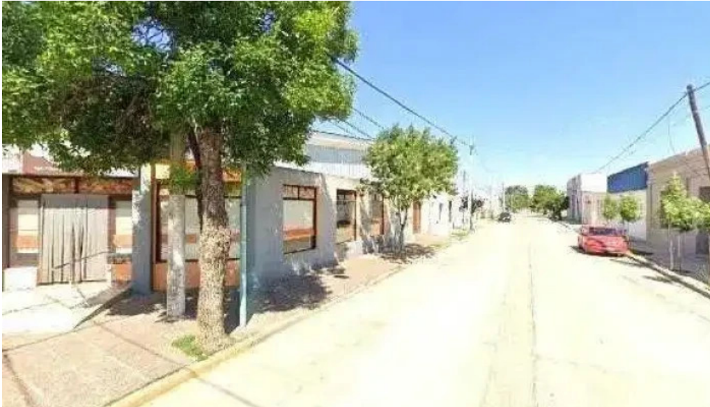
Panaderia y masiteria don carlos dondedeg