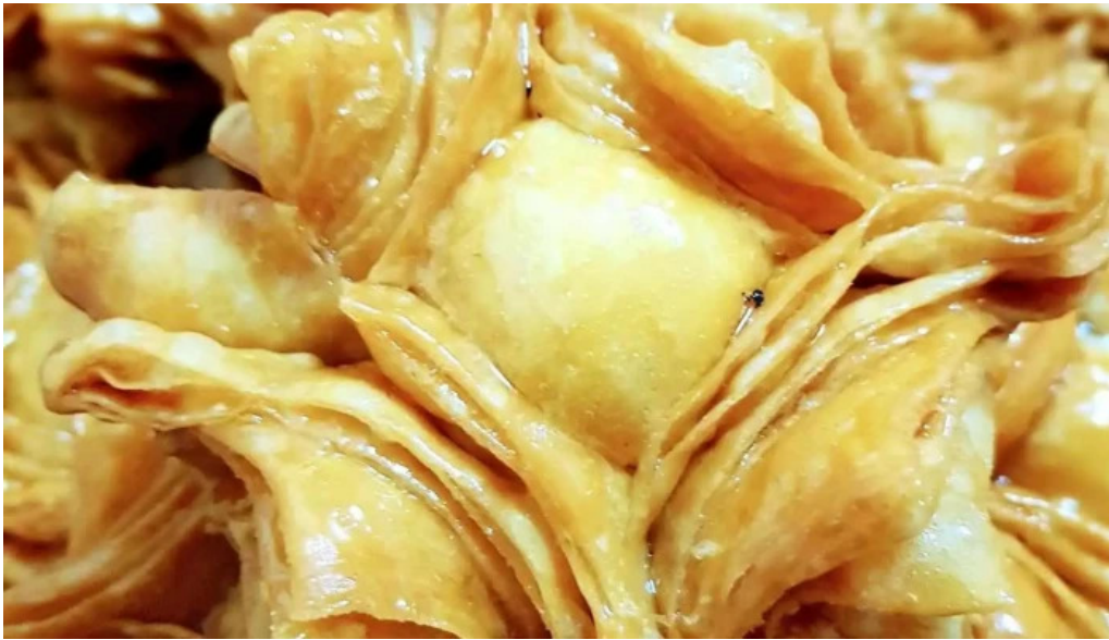
Santa claus panificacion comida y bebida