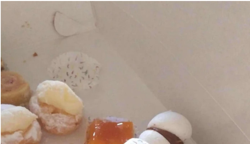
Santa claus panificacion descuentos