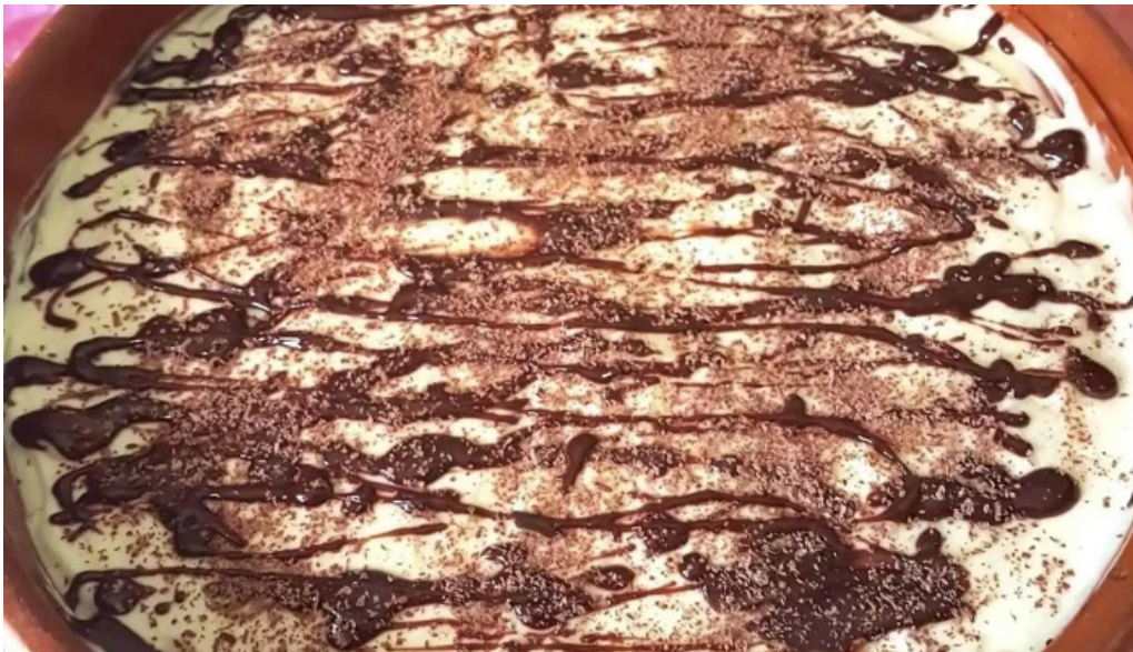
Santa claus panificacion pastel