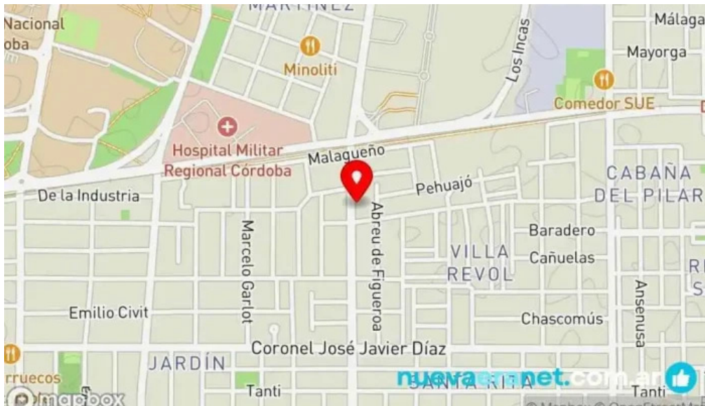
Santa claus panificacion mapa