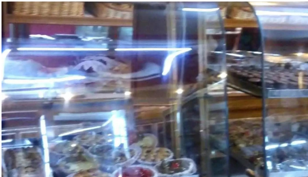
Santa claus panificacion vitrina