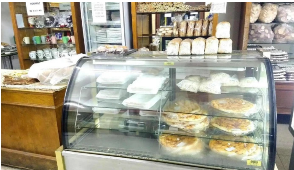
Santa claus panificacion ambiente