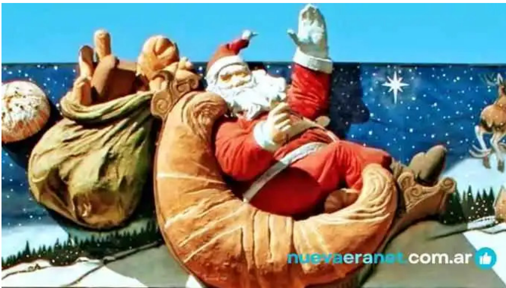
Santa claus panificacion del propietario